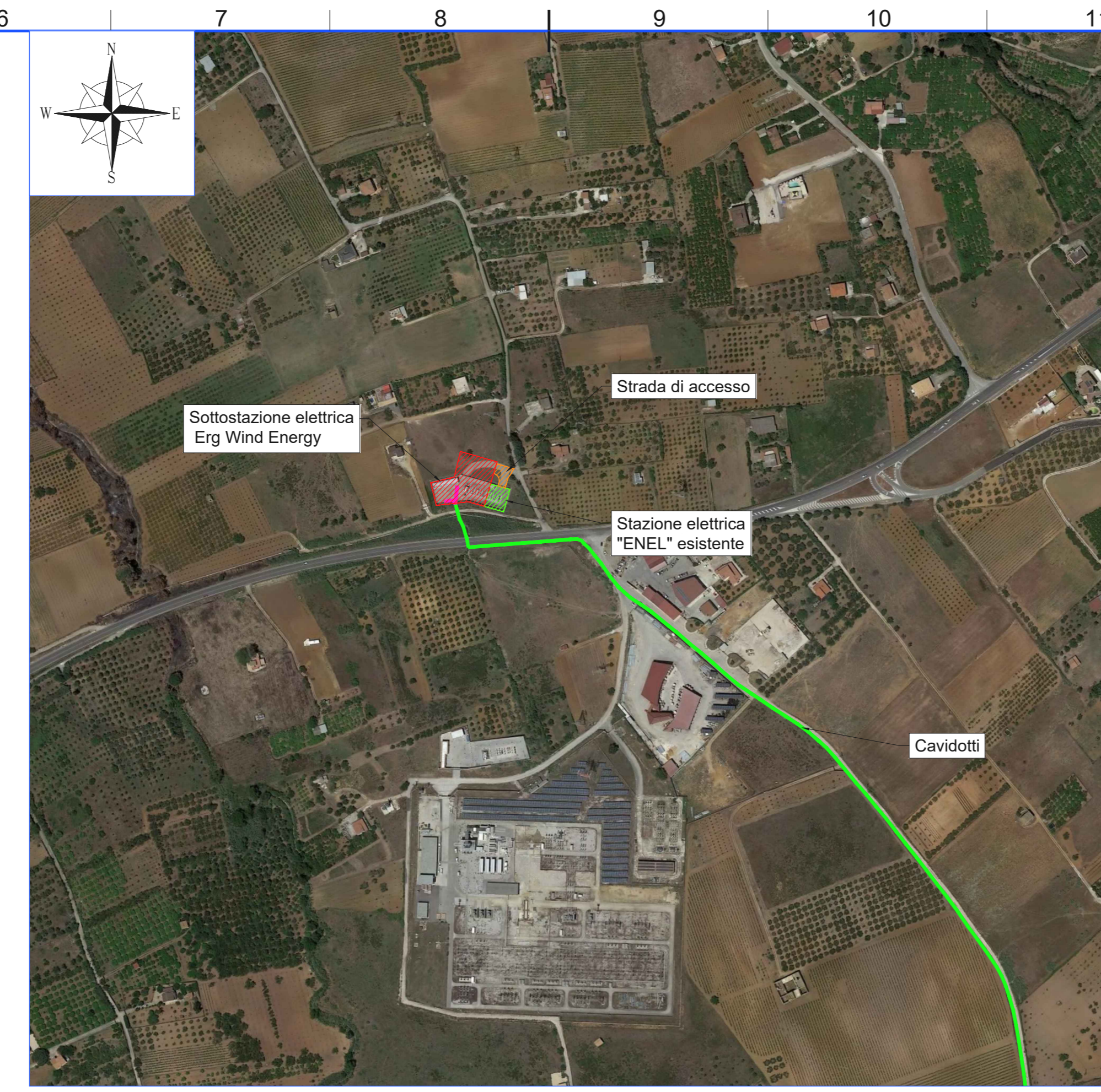
INQUADRAMENTO SU ORTOFOTO SCALA 1:4.000