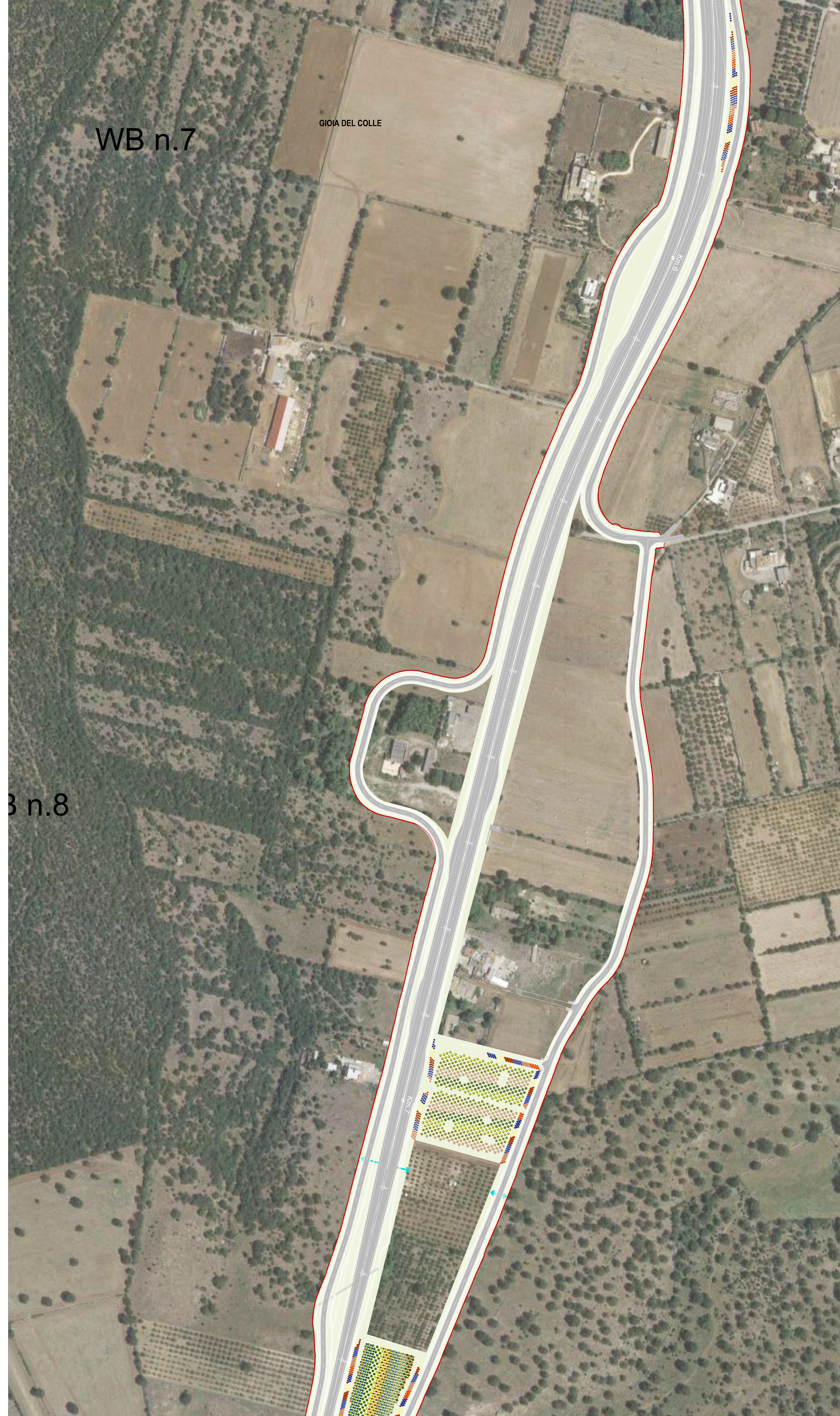
05 STRALCIO PLANIMETRICO 05 1:2000