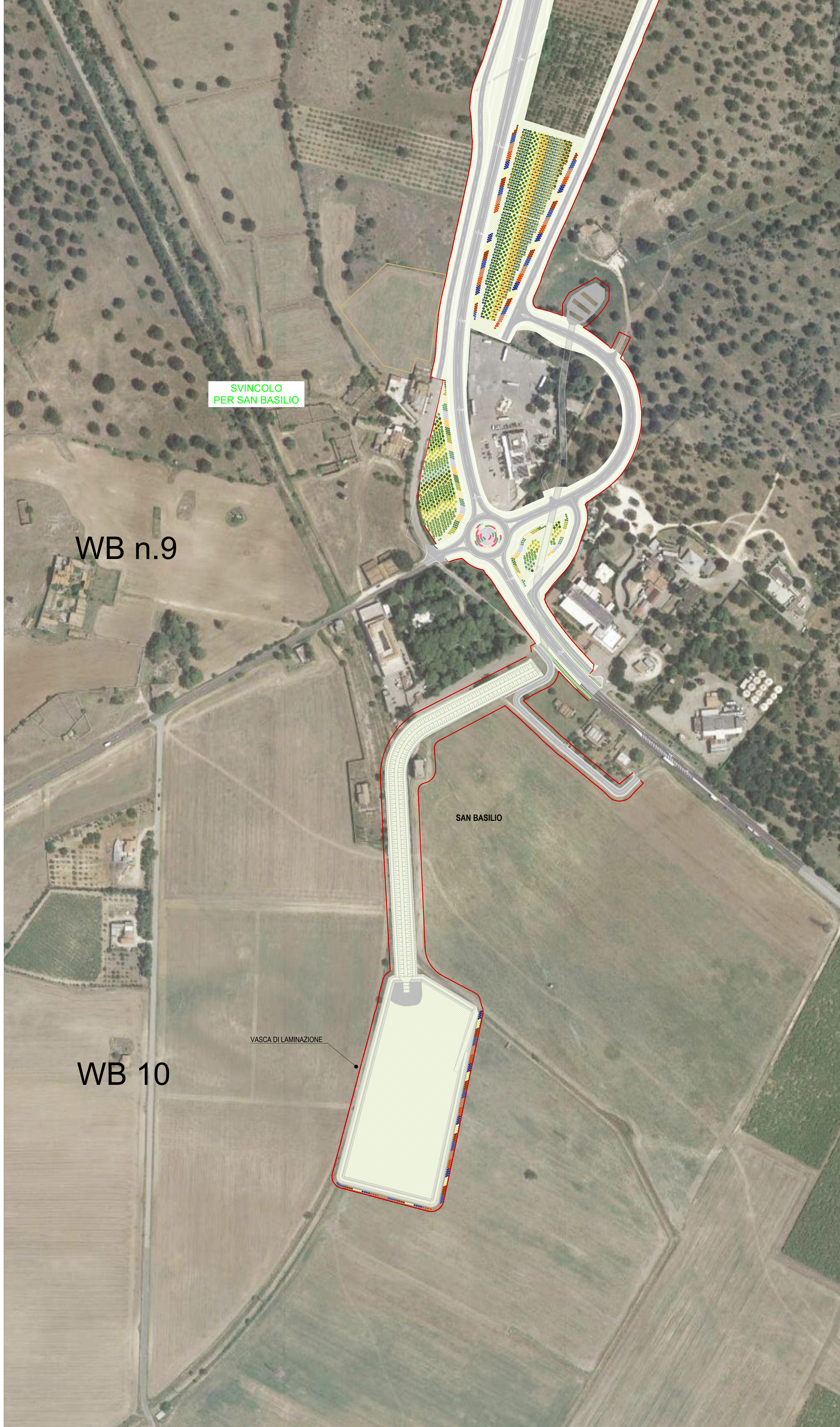
06 STRALCIO PLANIMETRICO 06 1:2000