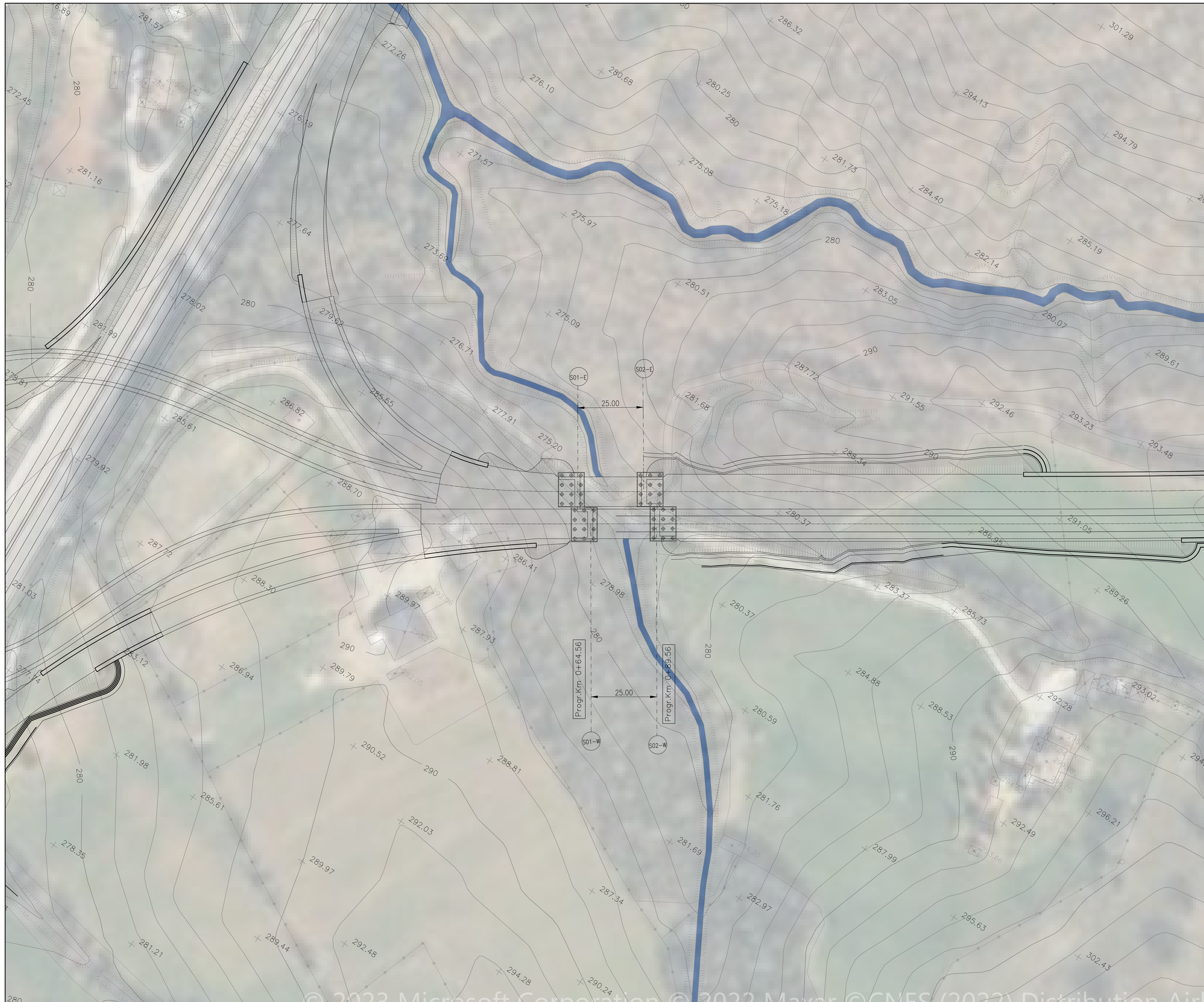
INQUADRAMENTO Scala 1:500