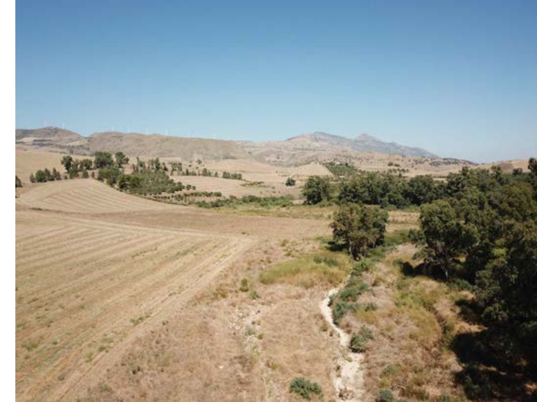
Punto di ripresa n°8 ante operam