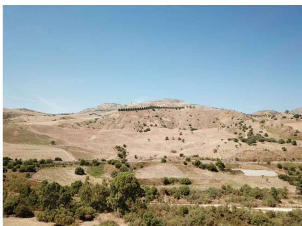
Punto di ripresa n°6 post operam.