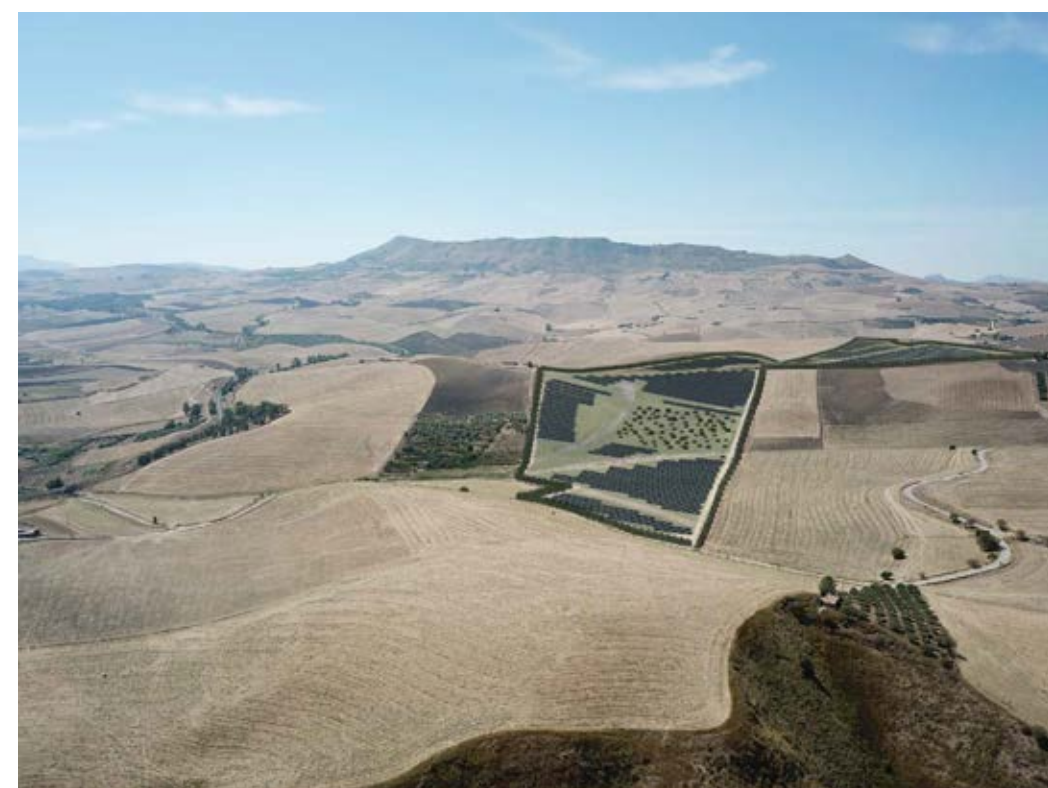
Punto di ripresa n°7 post operam.