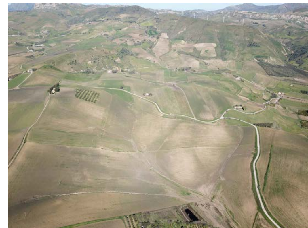
Punto di ripresa n°2 ante operam