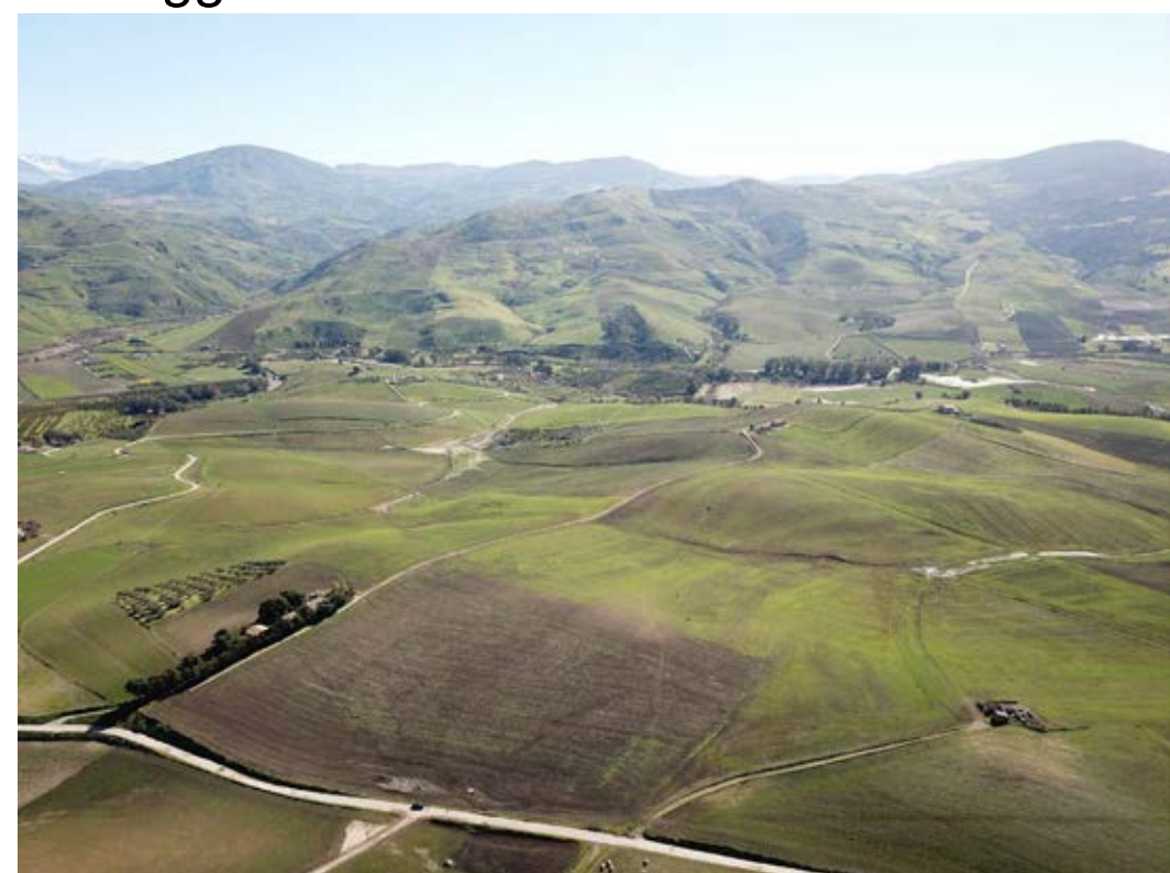
Punto di ripresa n°1 ante operam