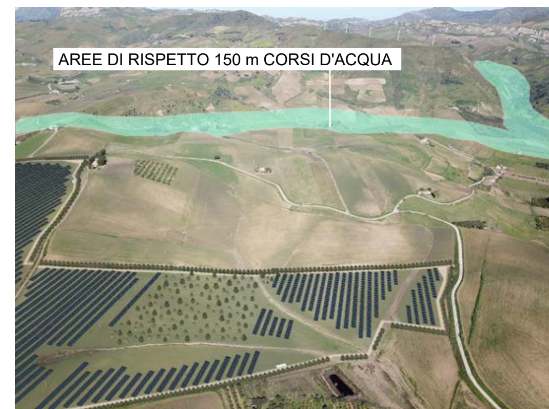
Punto di ripresa n°2 post operam.