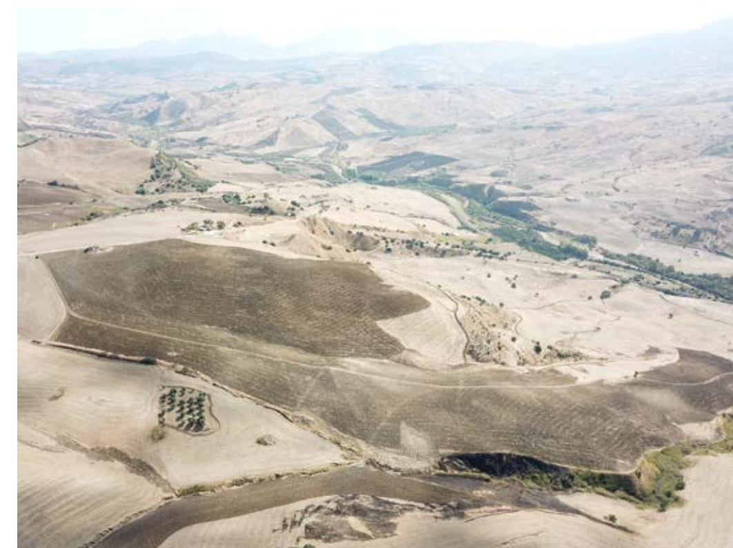
Punto di ripresa n°3 ante operam