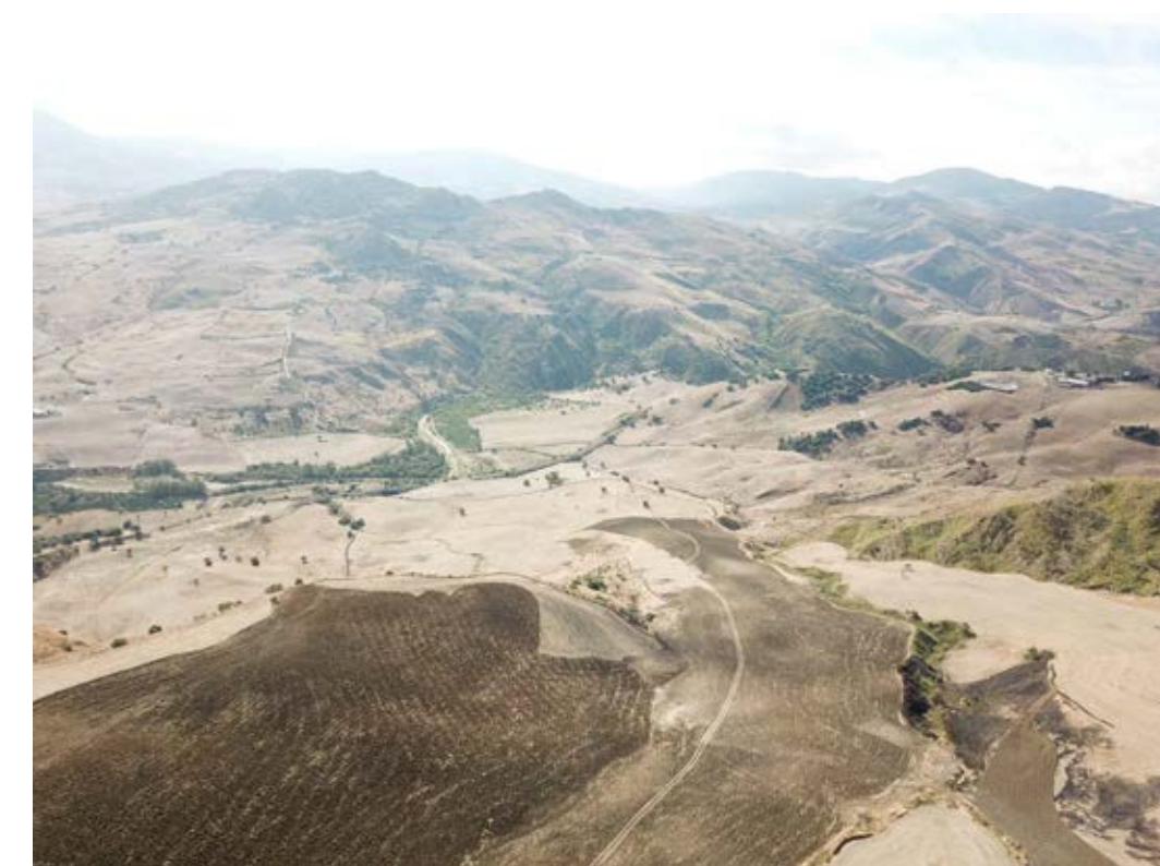
Punto di ripresa n°4 ante operam