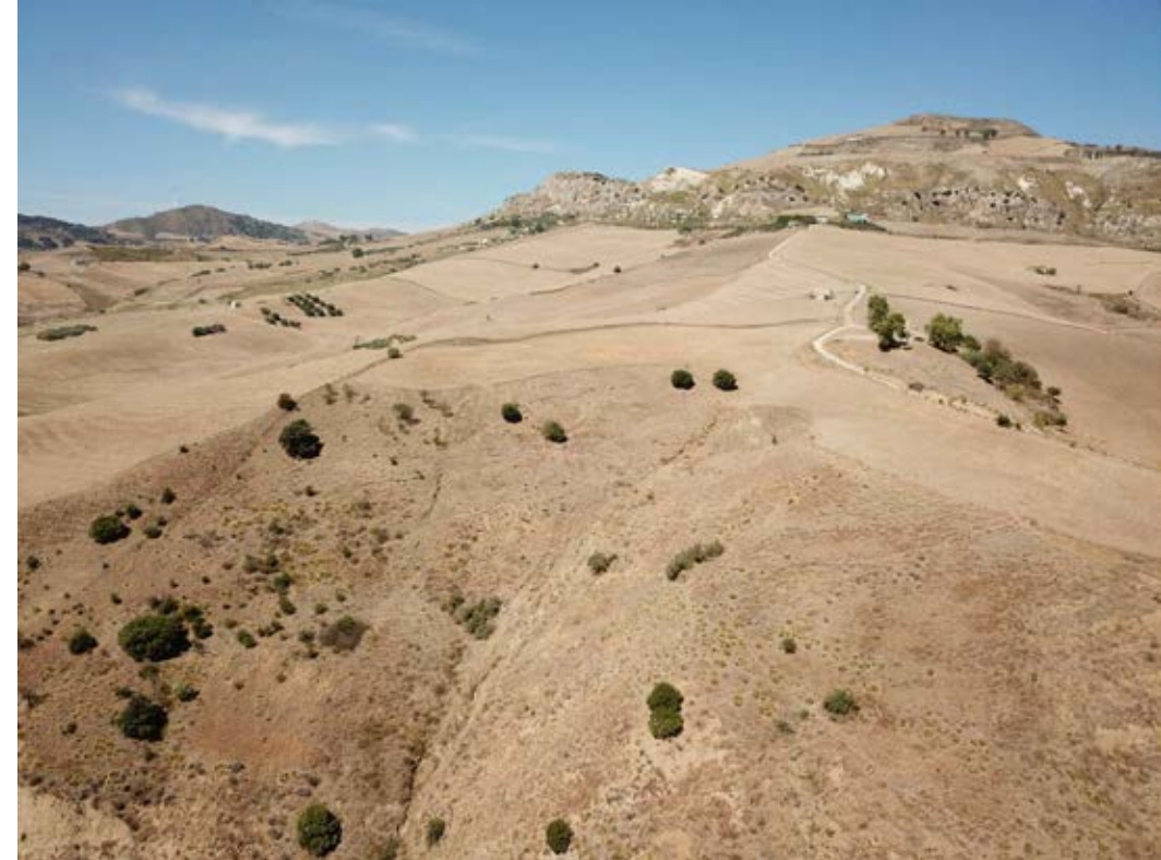
Punto di ripresa n°5 ante operam