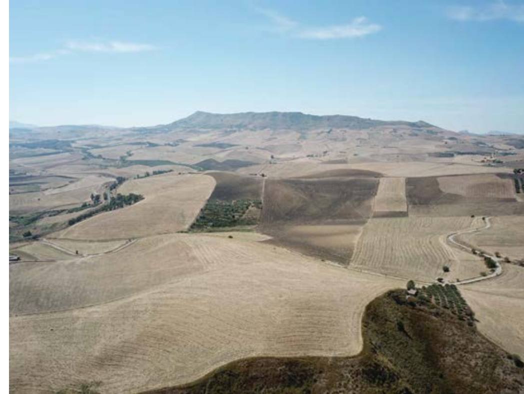
Punto di ripresa n°7 ante operam