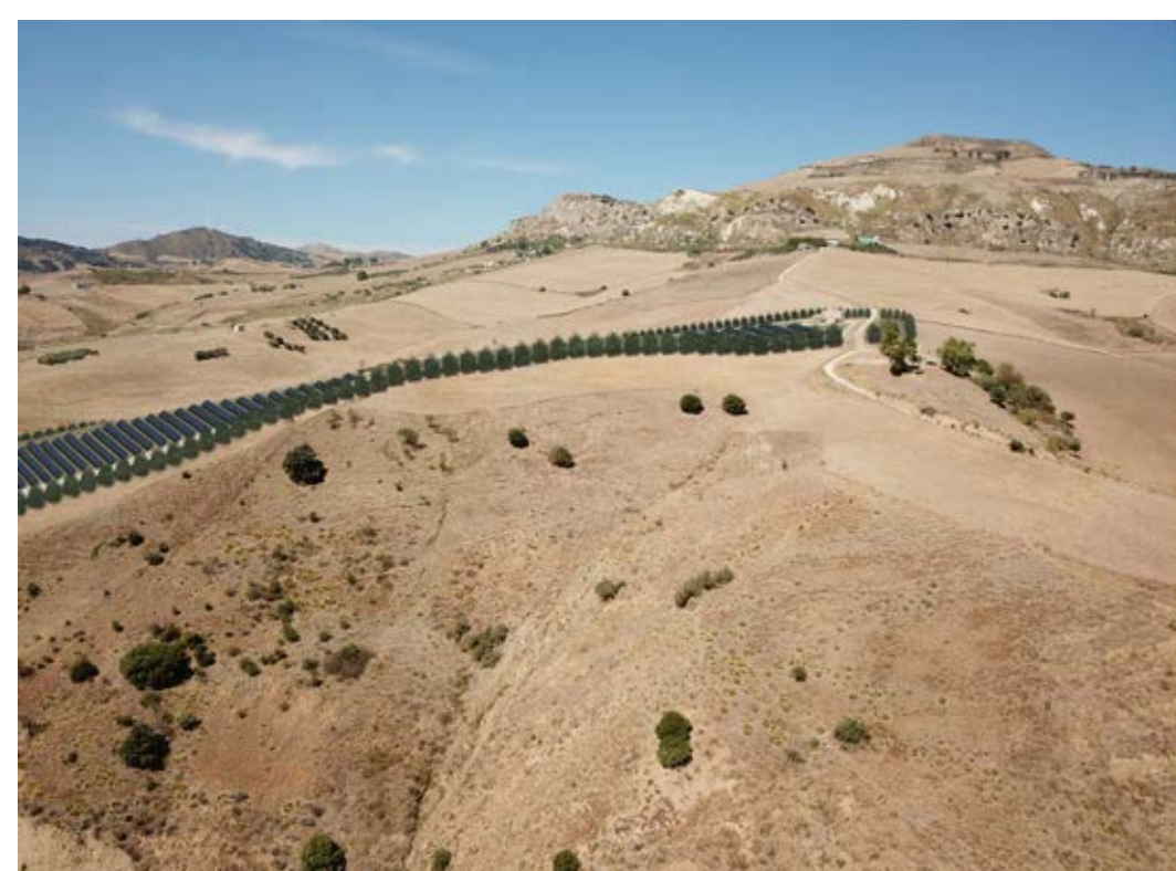
Punto di ripresa n°5 post operam.