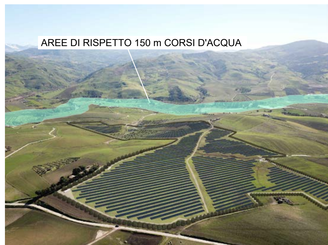
Punto di ripresa n°1 post operam.