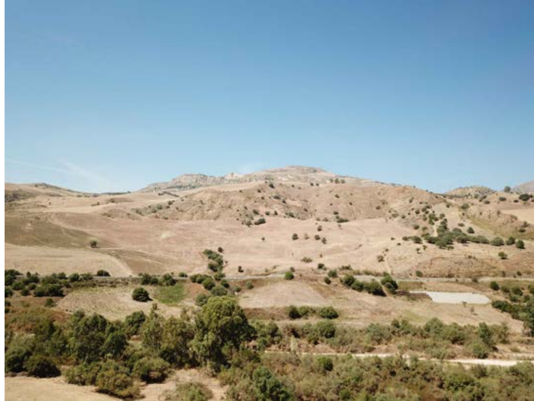
Punto di ripresa n°6 ante operam