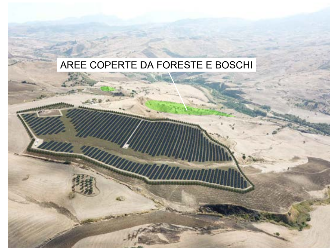
Punto di ripresa n°3 post operam.