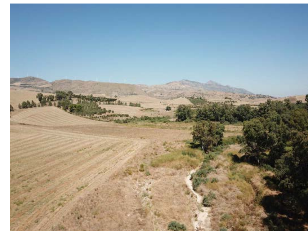
Punto di ripresa n°8 post operam.