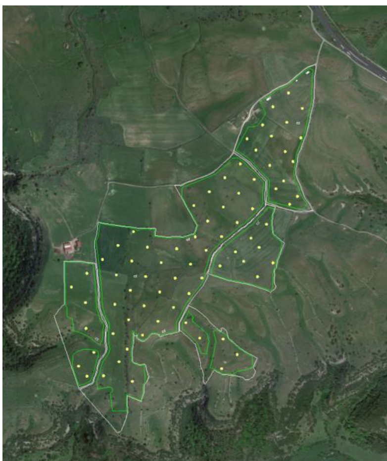
FIGURA 2: STRALCIO ORTOFOTO – PUNTI DI MONITORAGGIO

Per una superficie dell'area d'impianto (area in verde) di circa 33,88 ettari, ne deriva che i punti da sottoporre ad indagine saranno 75.