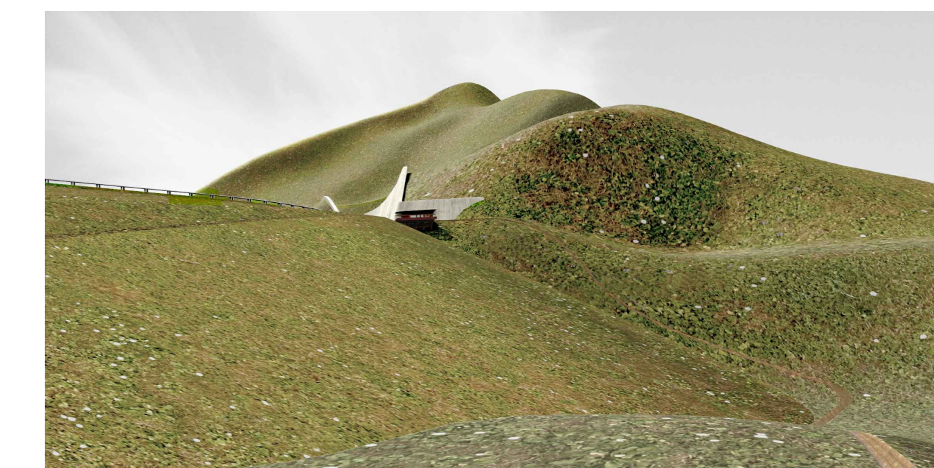
VISTE IN AVVICINAMENTO DELLA CENTRALE

RUOTIENERGIA Regione Basilicata Provincia di Potenza