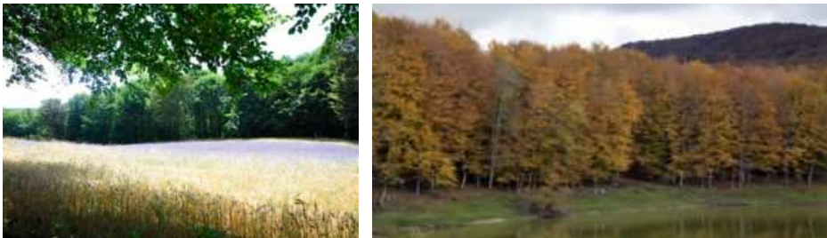
Figura 2. Alcune immagini dell’Abetina di Ruoti in diverse stagioni.

Negli anni scorsi si sono verificati numerosi incendi anche nelle aree esterne limitrofe ai confini delle zone forestali esistenti che hanno rischiato seriamente di estendersi anche all’interno delle aree ad oggi tutelate. Oltre a ciò ad oggi i principali pericoli sono rappresentati da tagli irrazionali del bosco ed attività di pascolo non regolamentato.