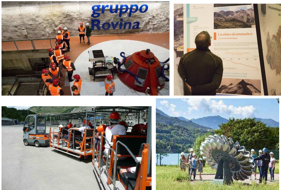
Figura 1. Esempi di fruizione dell'impianto di matrice turistica-energetica.

settoriali e tematici, potrebbe essere previsto anche un piccolo padiglione che abbinati agli aspetti puramente tecnici anche le peculiarità ambientali del territorio. Le parti più periferiche dell'impianto potranno altresì essere oggetto di visite guidate trasferendo i visitatori con appositi mezzi elettrici come un trenino turistico.