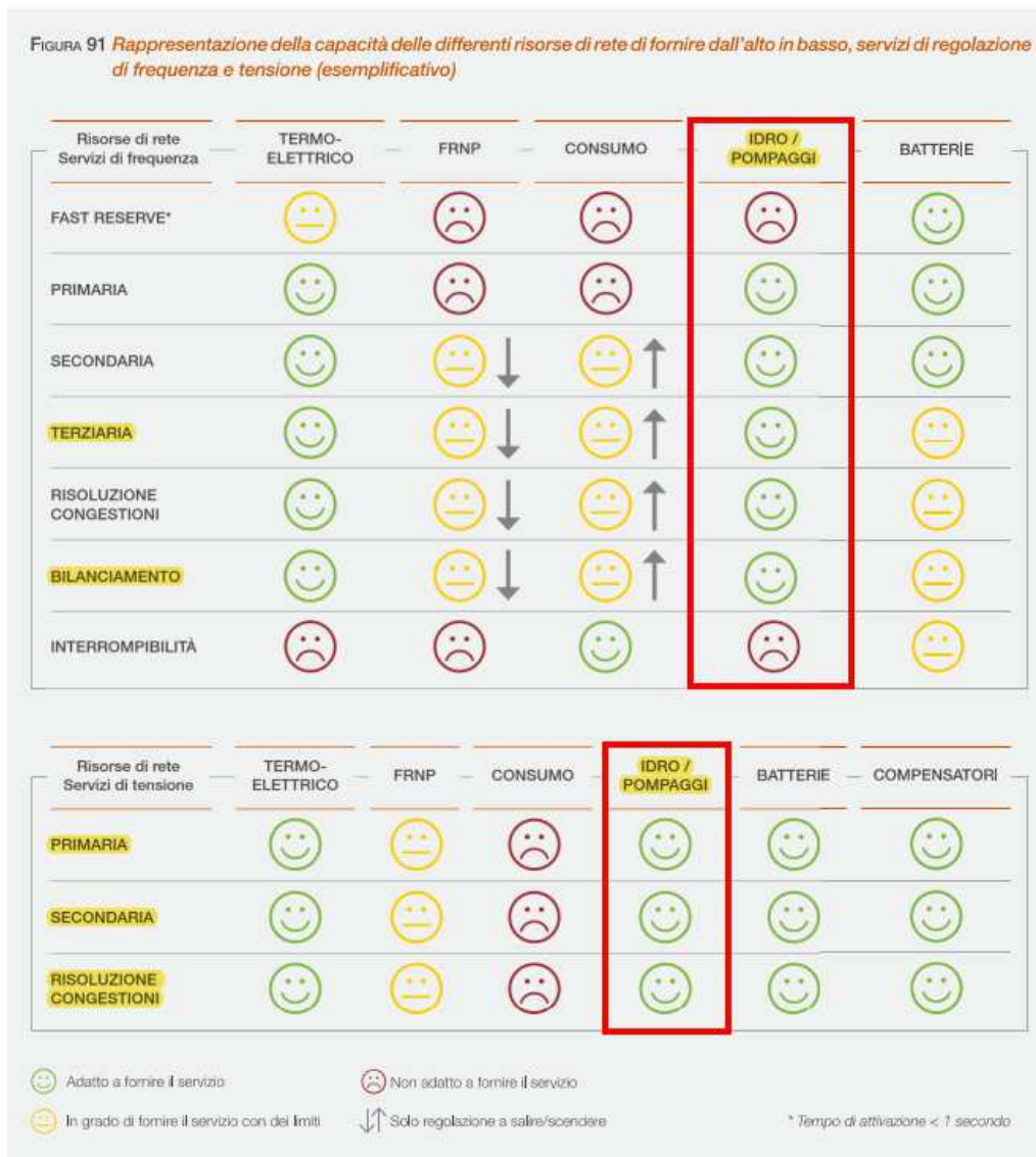
Figura 1: Rappresentazione della capacità delle differenti risorse di rete di fornire dall'alto in basso, servizi di regolazione di frequenza e tensione (esemplificativo), [PdS 2020, p.163]

In tale contesto, lo sviluppo di sistemi di accumulo può fornire un contributo significativo alla mitigazione degli impatti attesi, rappresentando di fatto uno degli strumenti chiave per abilitare la transizione energetica. Nel PdS 2020 si afferma che: