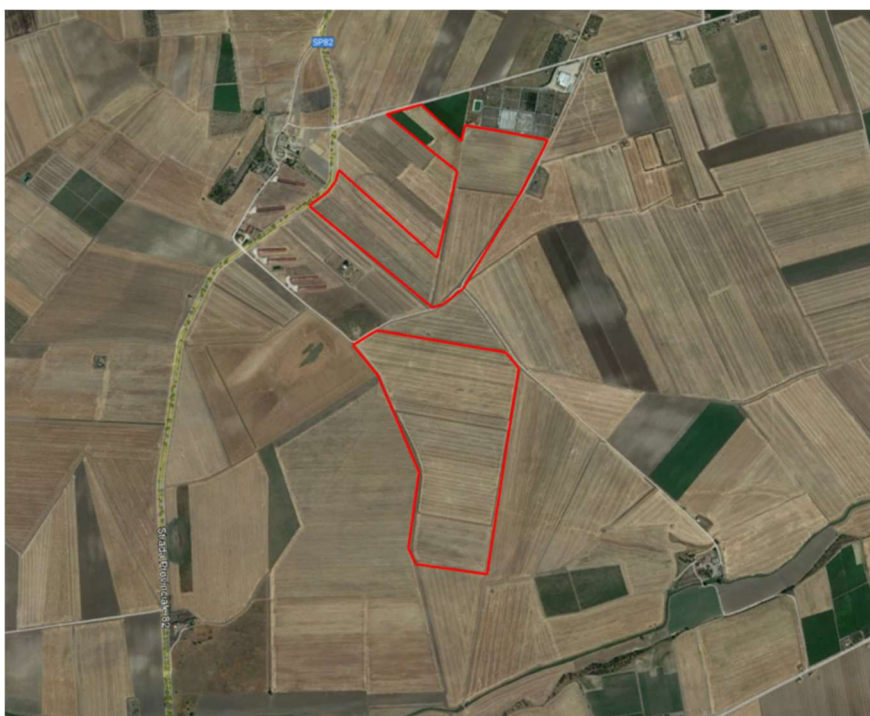
Fig. 01_ Individuazione dell'area di intervento su foto satellitare

per una estensione di circa 474537,40 m 2 , su un terreno di 68 ha complessivi; essa è classificata catastalmente come “Seminativo”.