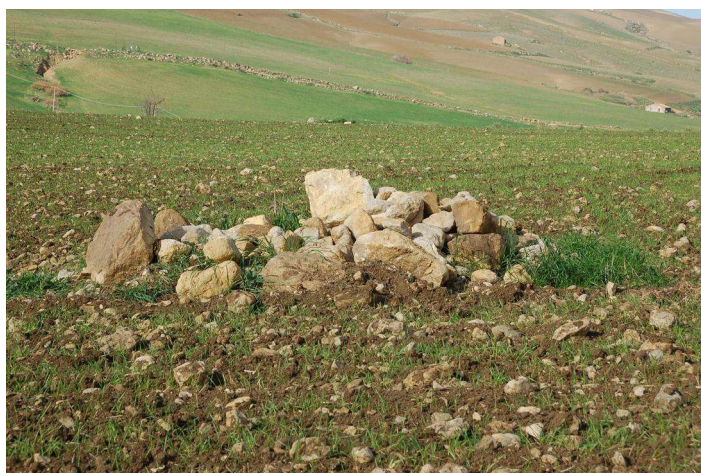
Fig. 04 _ Esempio di infrastruttura ecologica mista

Un'altra utilizzazione riguarderà la realizzazione di Infrastrutture Ecologiche miste all'interno delle aree di compensazione (fascia arborea di protezione) per favorire la fauna del suolo. Tali strutture saranno dei semplici cumuli di terra e pietre inerbite, di circa 1 m 3 ; questo metodo prevede la semina nei cumuli con vari miscugli di piante erbacee non invasive, tra cui specie a ricca fioritura, con lo scopo di provvedere polline e nettare per gli insetti che rappresentano la base della catena alimentare.