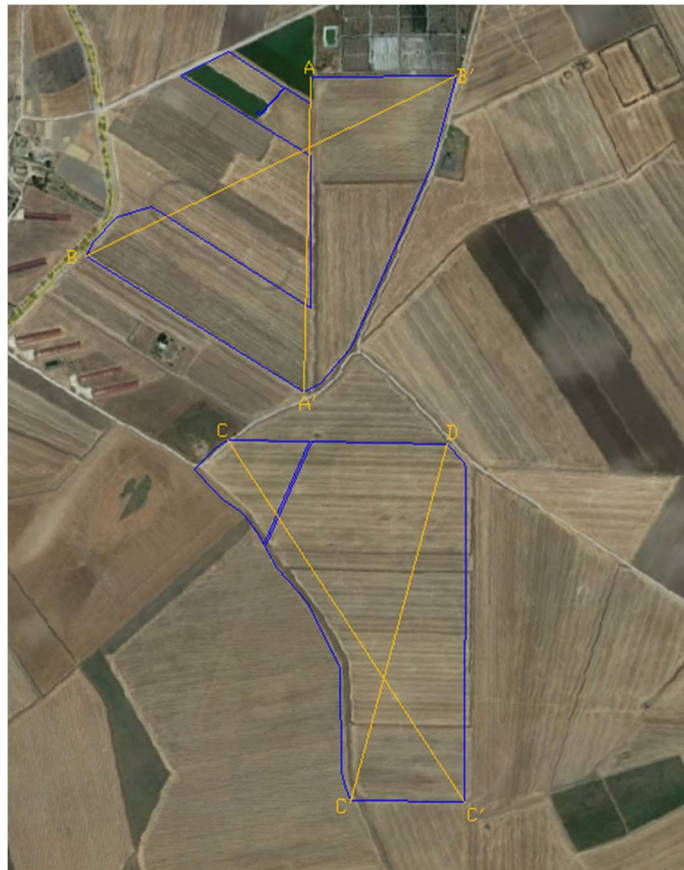
Fig. 03 _Area impianto e sezioni profilo morfologico.