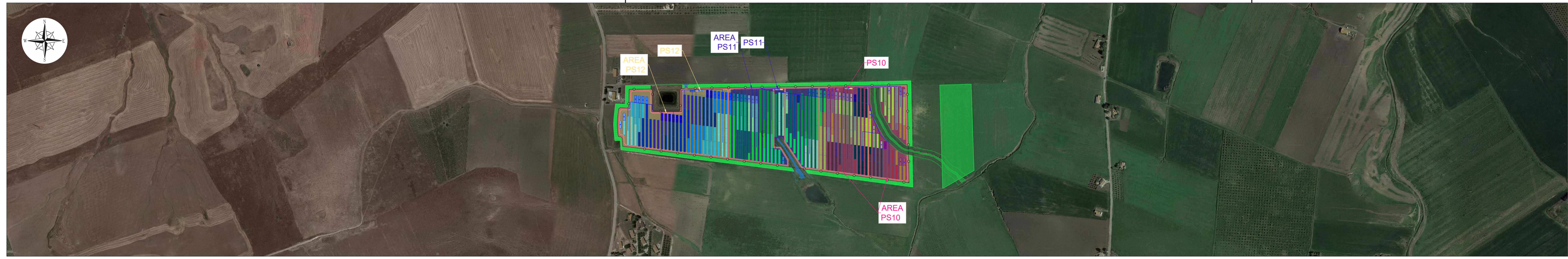
Planimetria di inquadramento della suddivisione in campi su ortofoto Scala 1:4.000