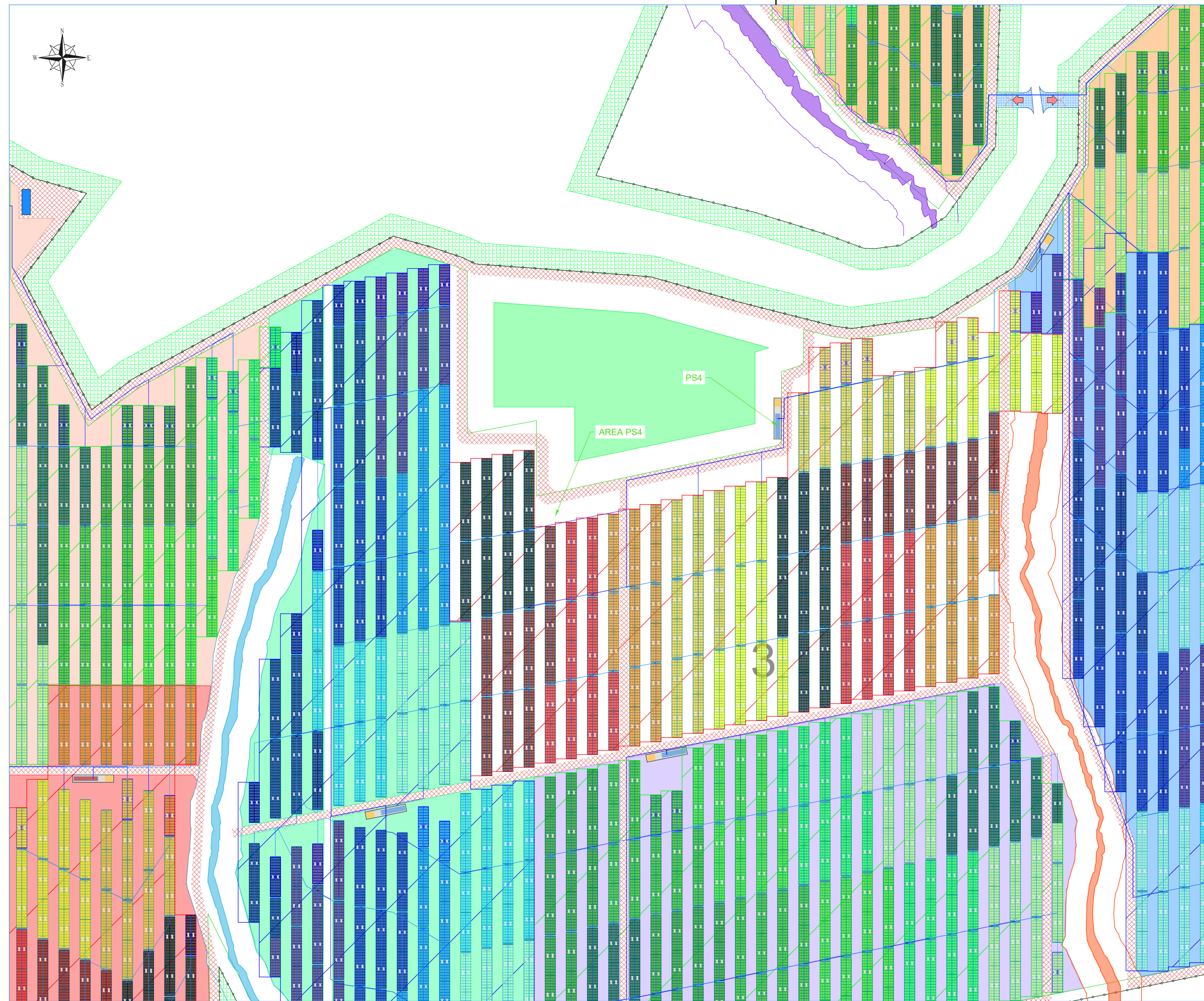
Planimetria dell'area di pertinenza della PS4 Scala 1:1.000