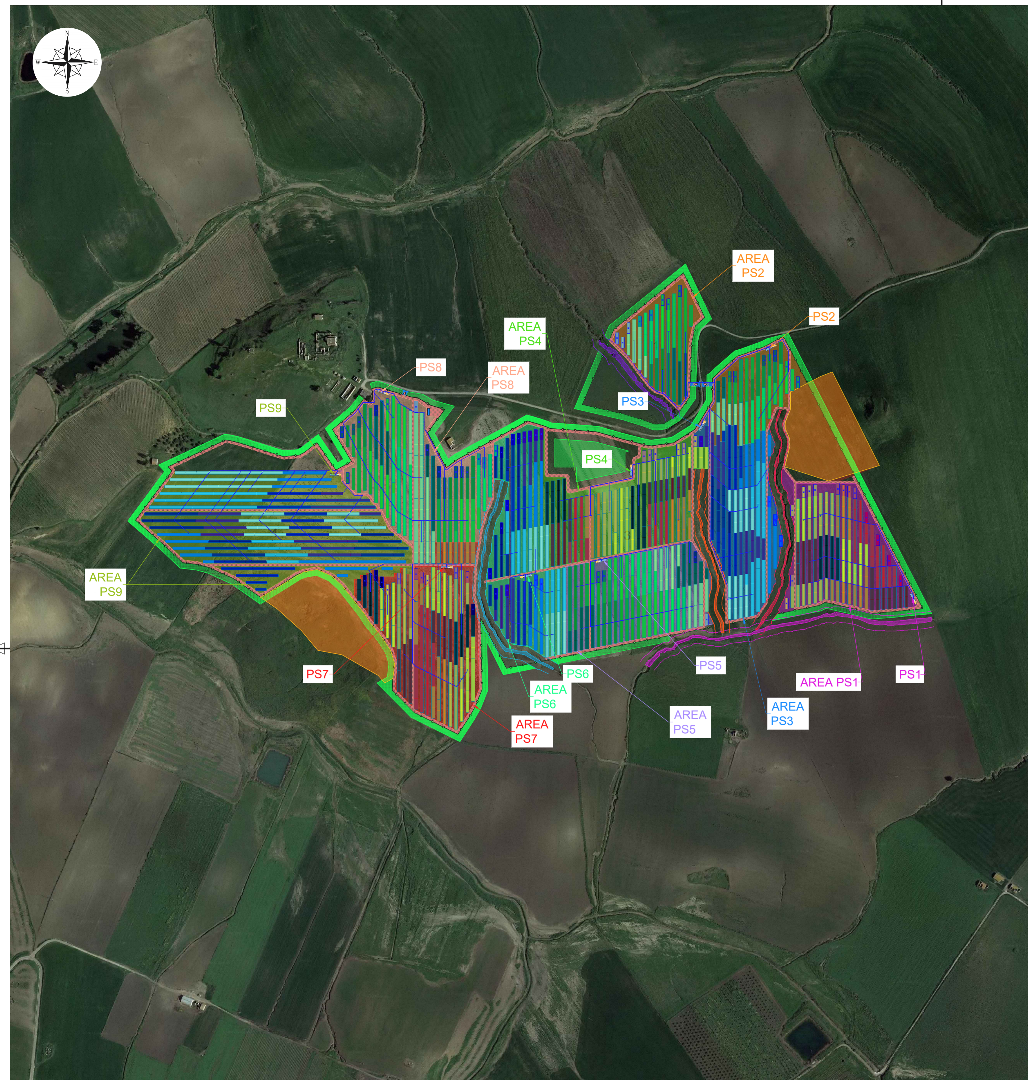
Planimetria di inquadramento della suddivisione in campi su ortofoto Scala 1:4.000