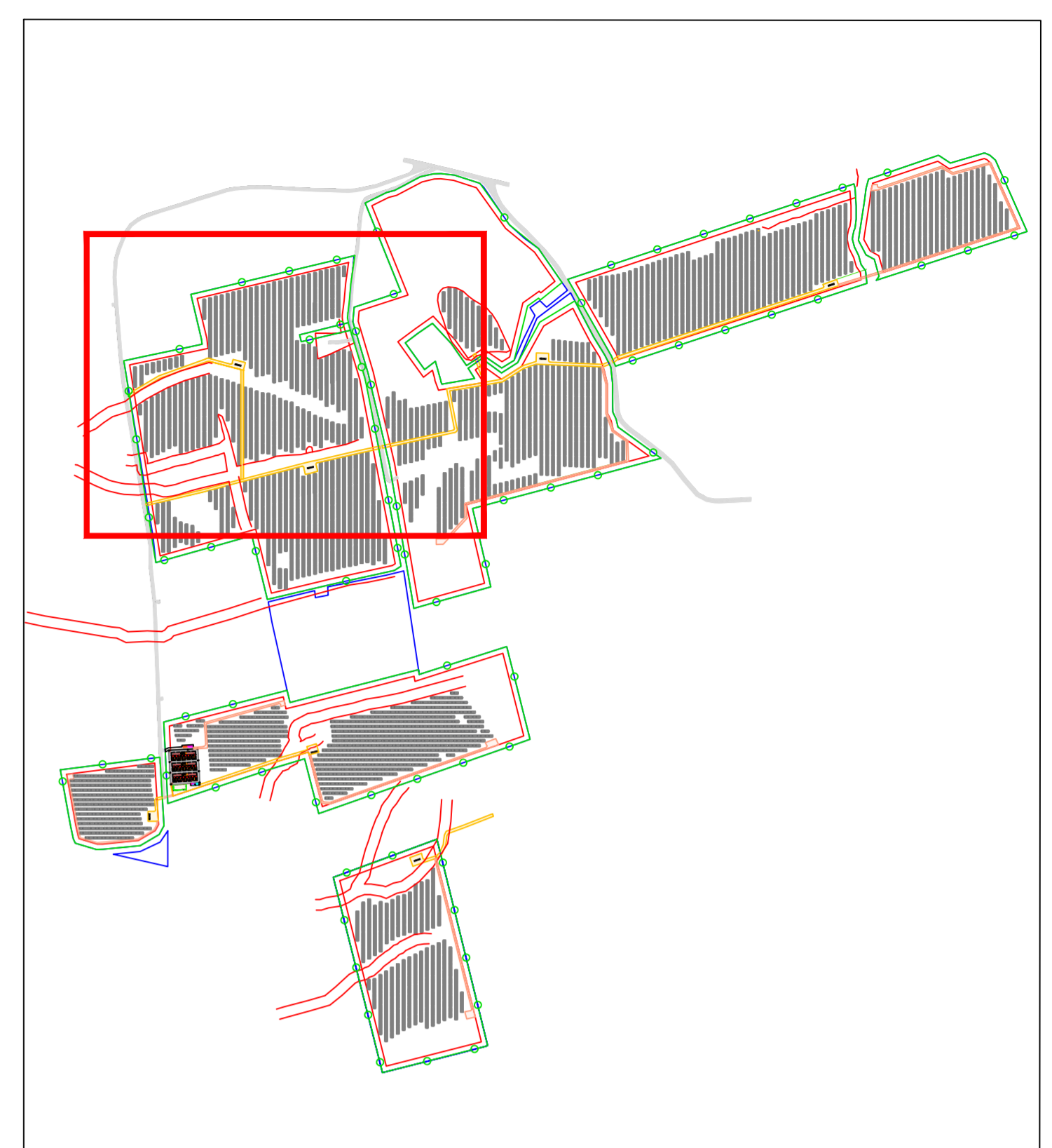
Quadro di unione - 1:10.000