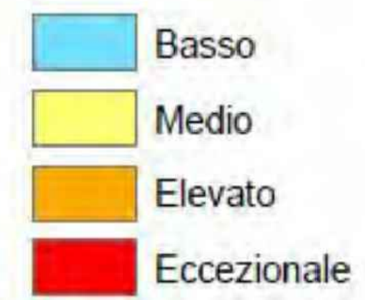
ALL2_PEAR 2 N.2 carta dei vincoli paesaggistici con la definizione del vincolo agricolo