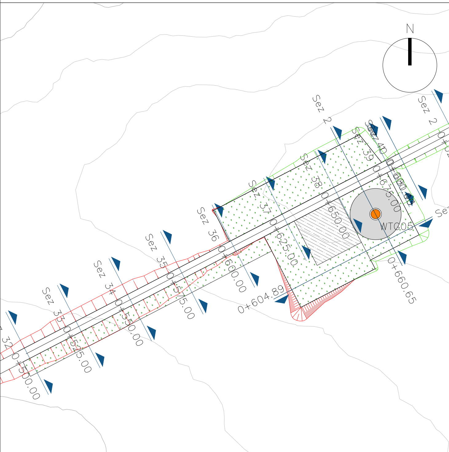
PARTICOLARE PIAZZOLA IN FASE DI ESERCIZIO DELL'AEROGENERATORE WTG05 scala 1:1000