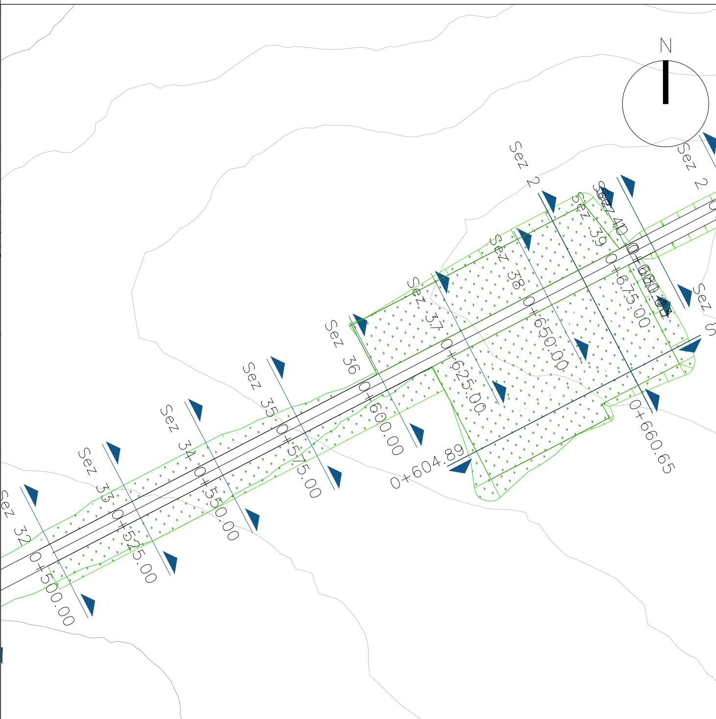
PARTICOLARE PIAZZOLA IN FASE DI DISMISSIONE DELL'AEROGENERATORE WTG05 scala 1:1000