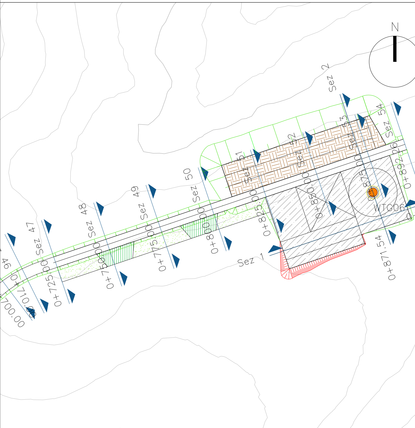
PARTICOLARE PIAZZOLA IN FASE DI MONTAGGIO DELL'AEROGENERATORE WTG06 scala 1:1000