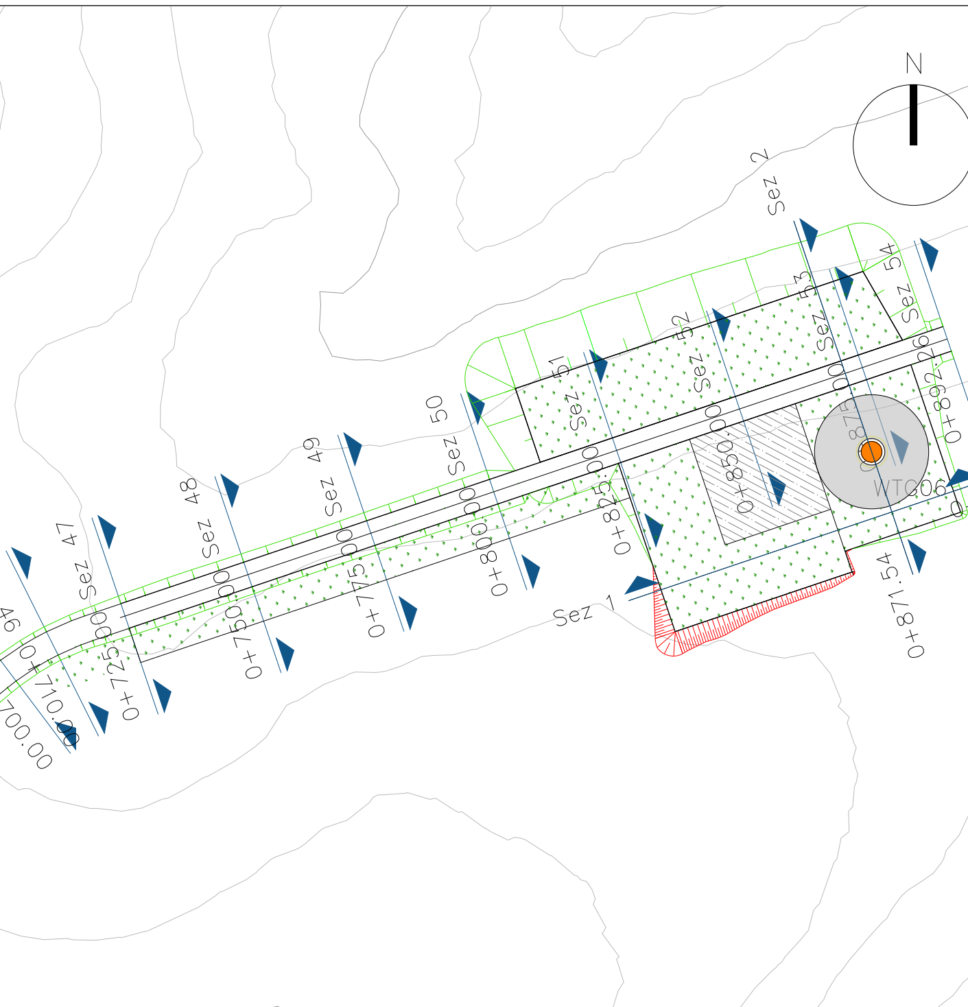
PARTICOLARE PIAZZOLA IN FASE DI ESERCIZIO DELL'AEROGENERATORE WTG06 scala 1:1000