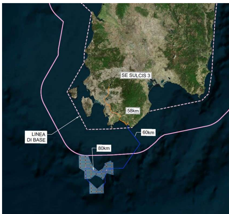
Figura 1 - Inquadramento generale su ortofoto.