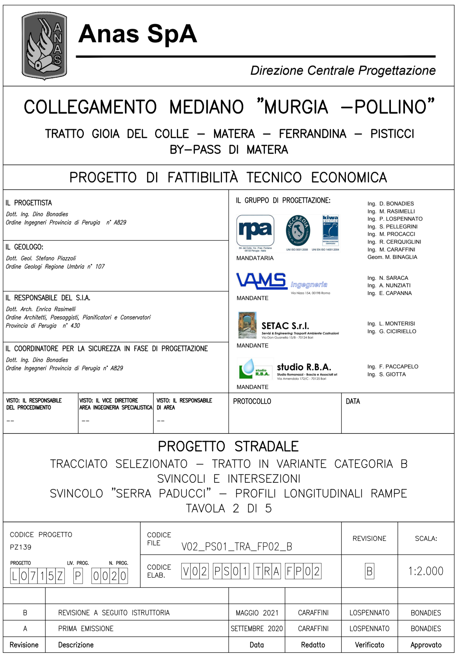
SVINCOLO "SERRA PADUCCI" - RAMPA 2