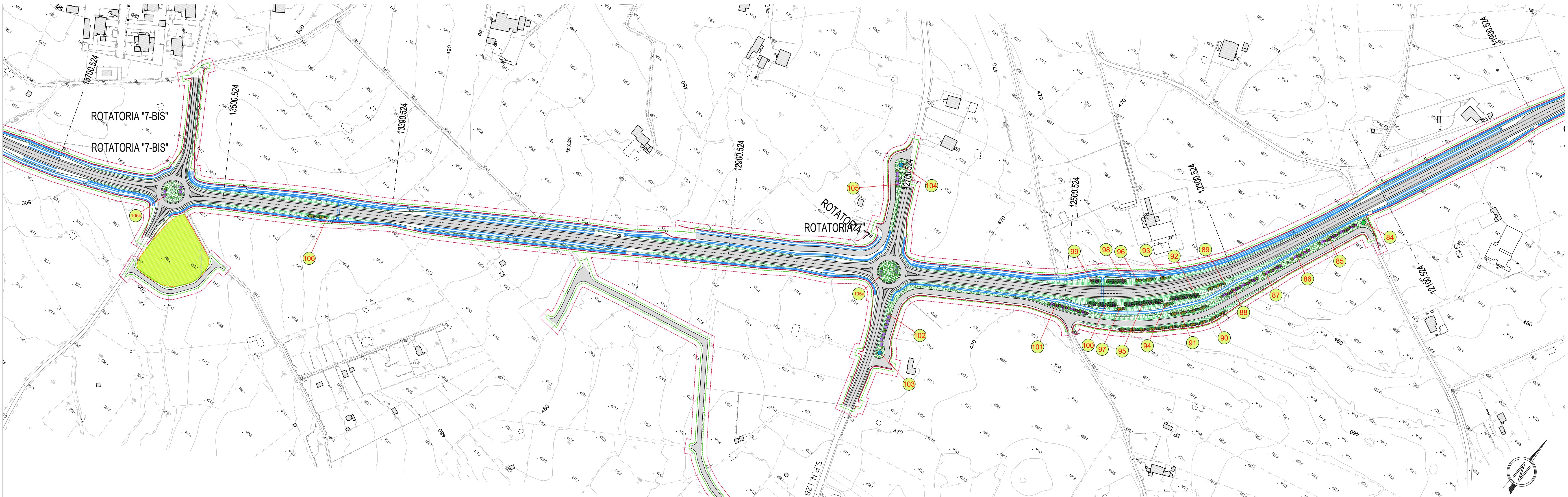
TABELLE COMPUTO SISTEMAZIONI E VERDE