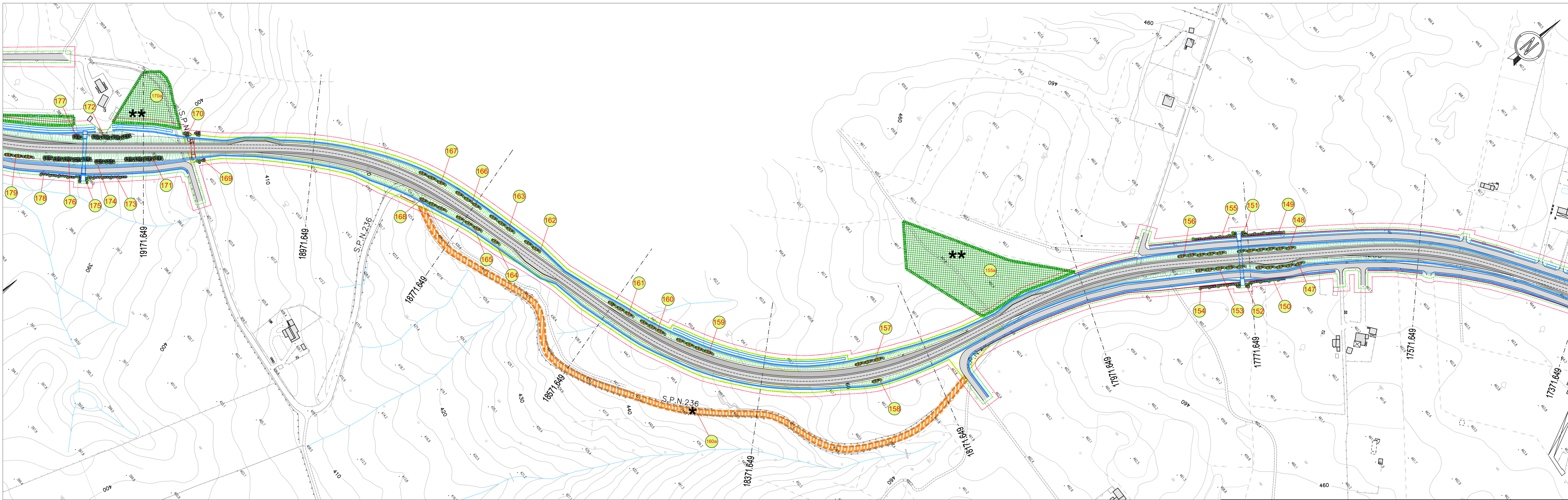
TABELLE COMPUTO SISTEMAZIONI E VERDE