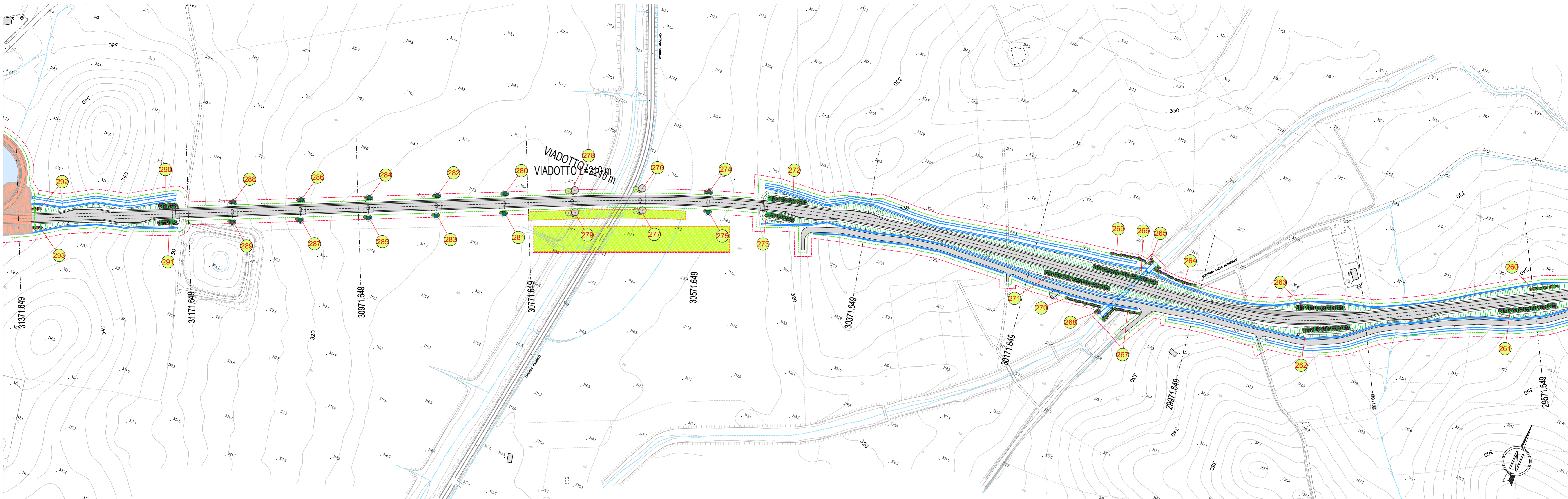
TABELLE COMPUTO SISTEMAZIONI E VERDE