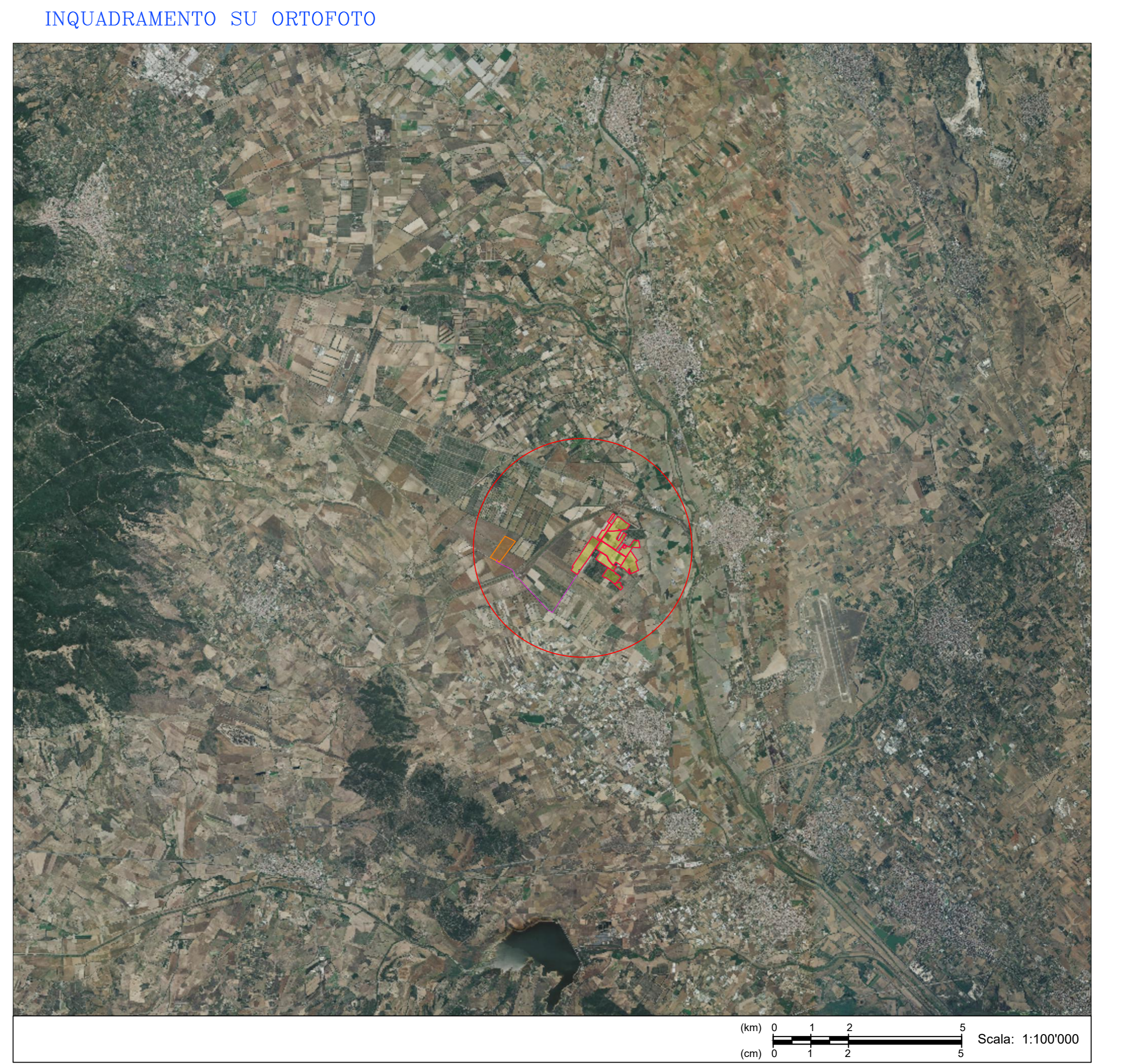
INQUADRAMENTO GENERALE DEGLI INTERVENTI