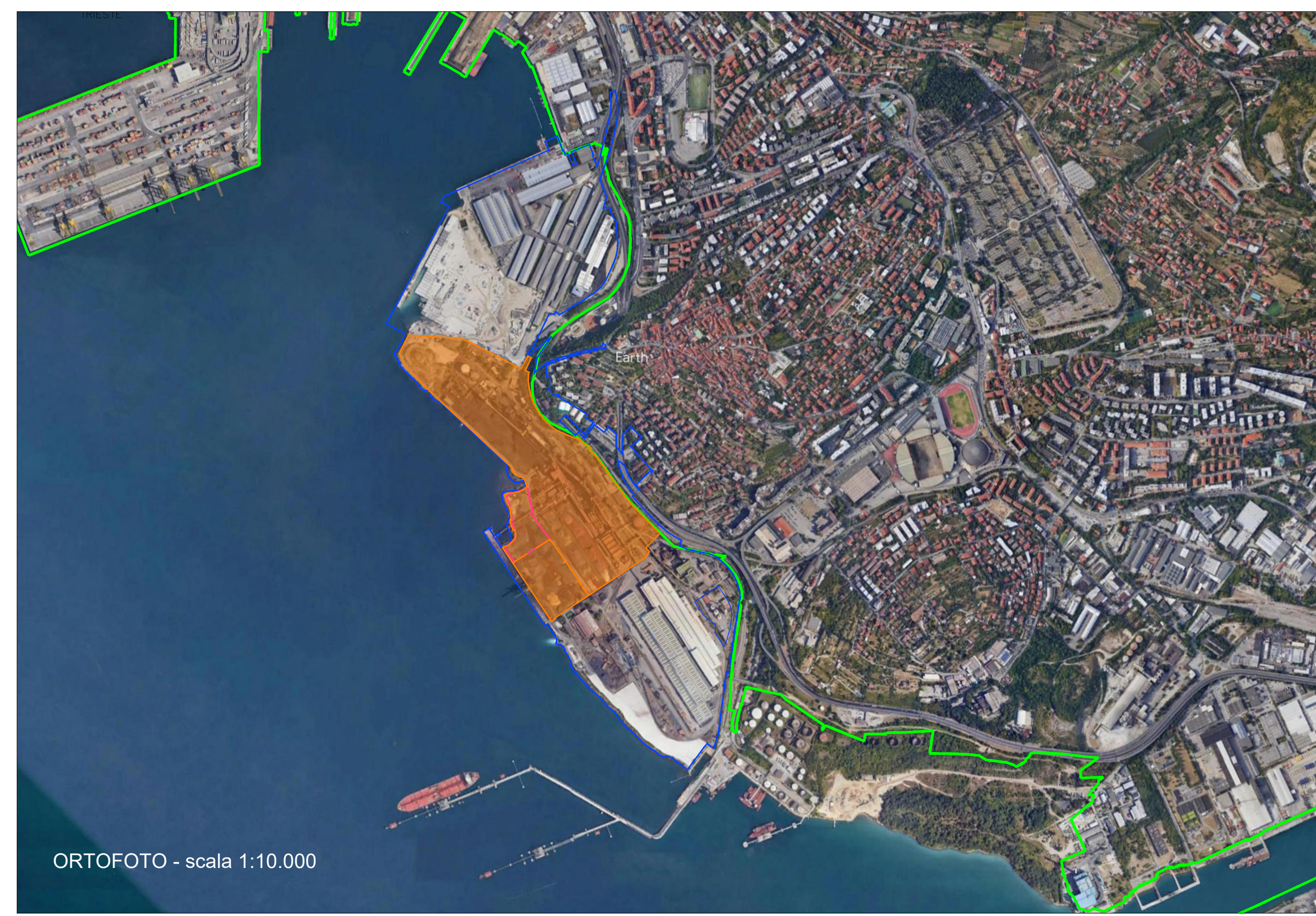
ORTOFOTO - scala 1:10.000