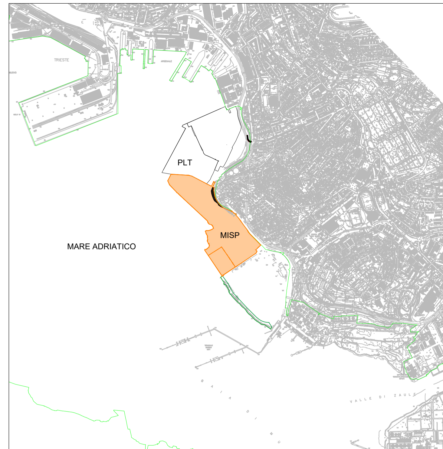
PLANIMETRIA INQUADRAMENTO AREA MISP