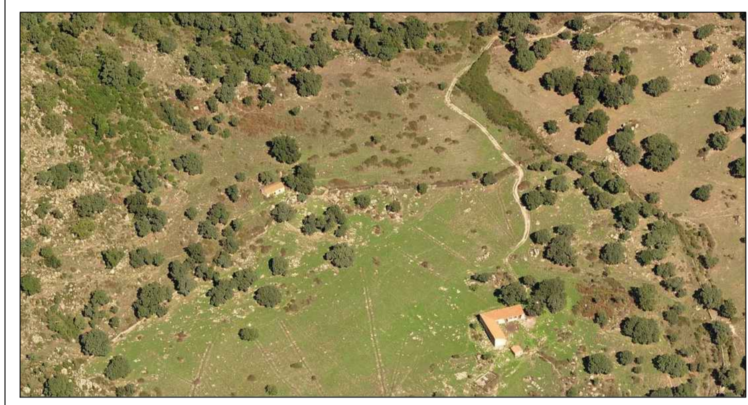
PROGETTAZIONE DEFINITIVA E STUDIO DI IMPATTO AMBIENTALE PER RICHIESTA DI AUTORIZZAZIONE UNICA DELL' IMPIANTO AGRIVOLTAICO DA 40 MW IN ZONA INDUSTRIALE DI PRATO SARDO NEL COMUNE DI NUORO (NU)