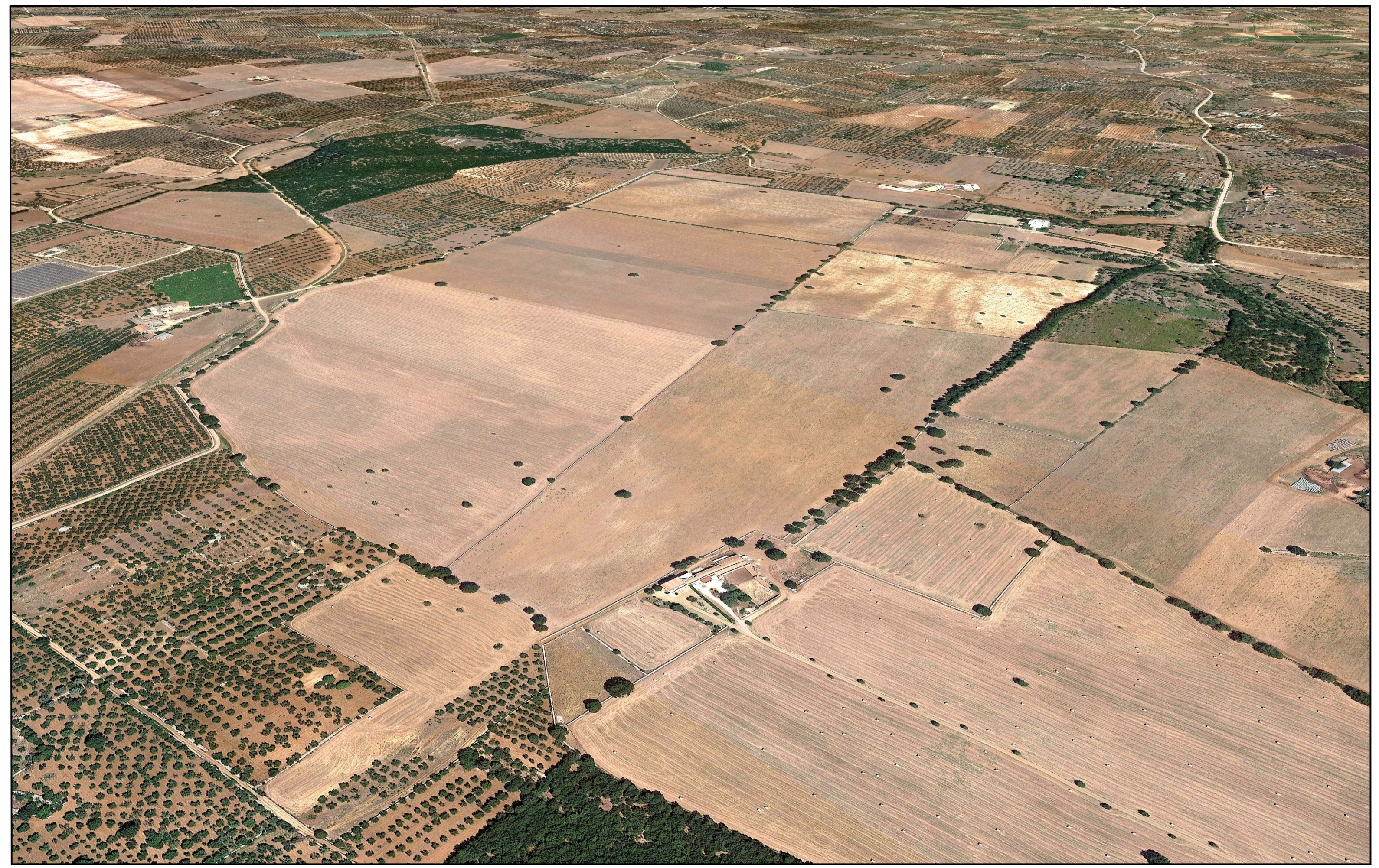
VISTA PLANIVOLUMETRICA SOTTOCAMPI 1, 2 - STATO DI FATTO