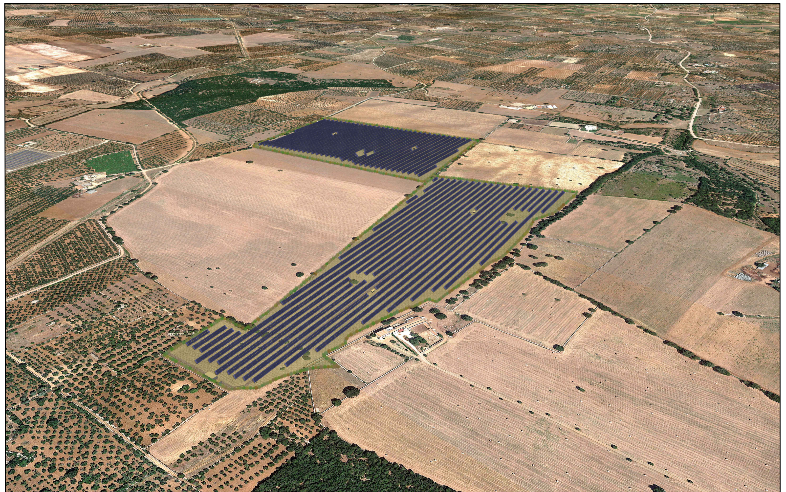
VISTA PLANIVOLUMETRICA SOTTOCAMPI 1, 2 - STATO DI PROGETTO