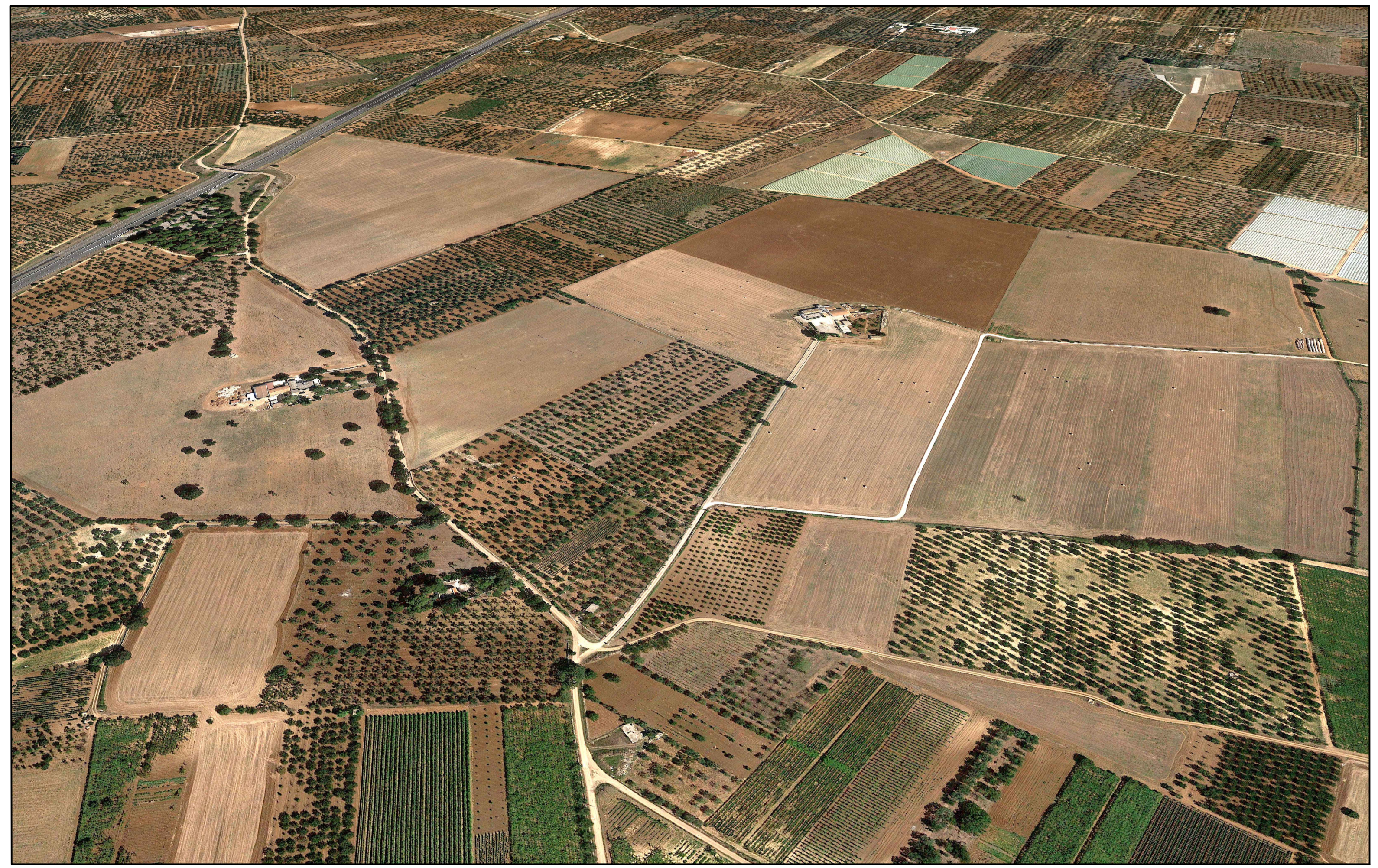
VISTA PLANIVOLUMETRICA SOTTOCAMPI 8, 9, 10, 11, 12 - STATO DI FATTO