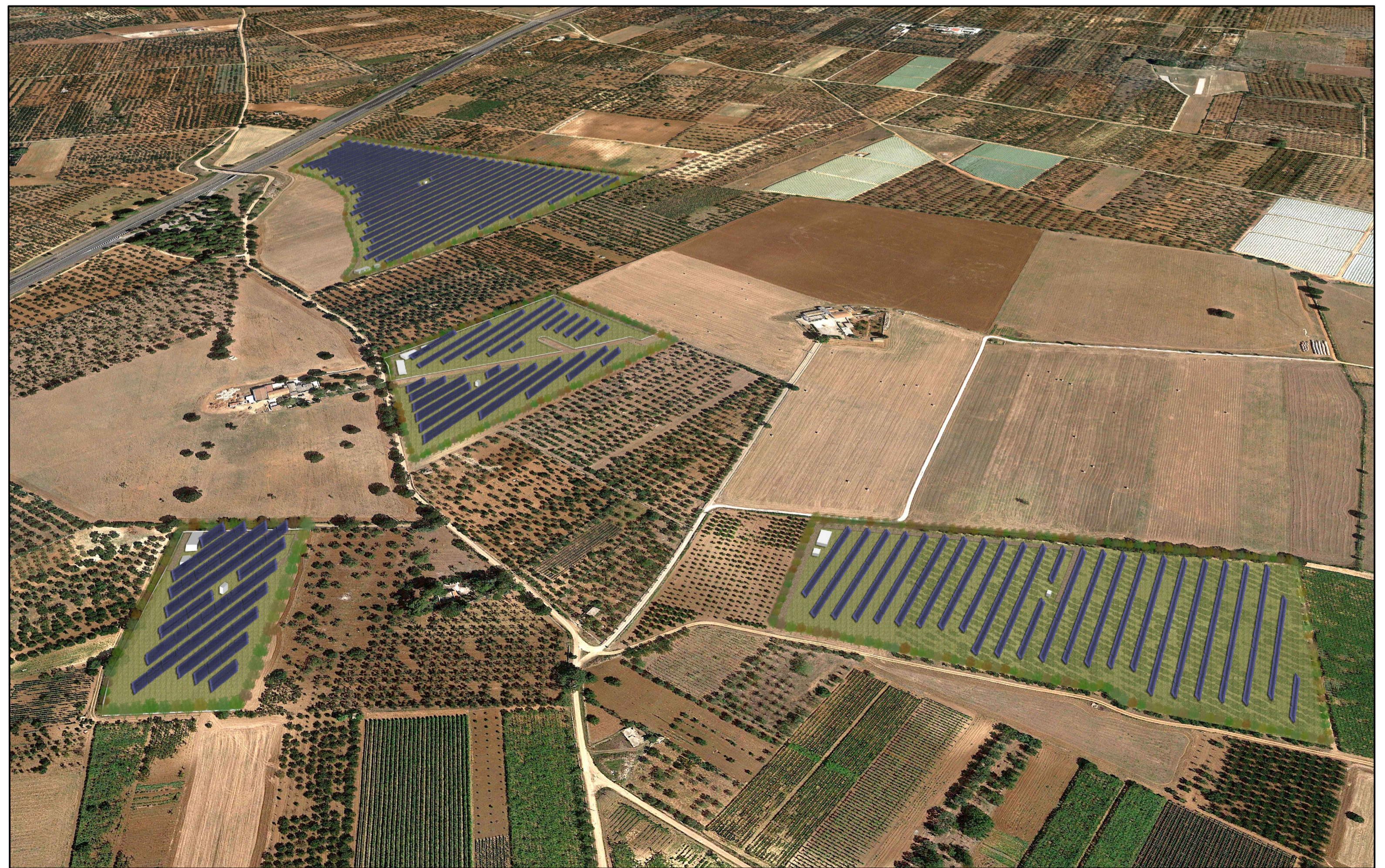
VISTA PLANIVOLUMETRICA SOTTOCAMPI 8, 9, 10, 11, 12 - STATO DI PROGETTO