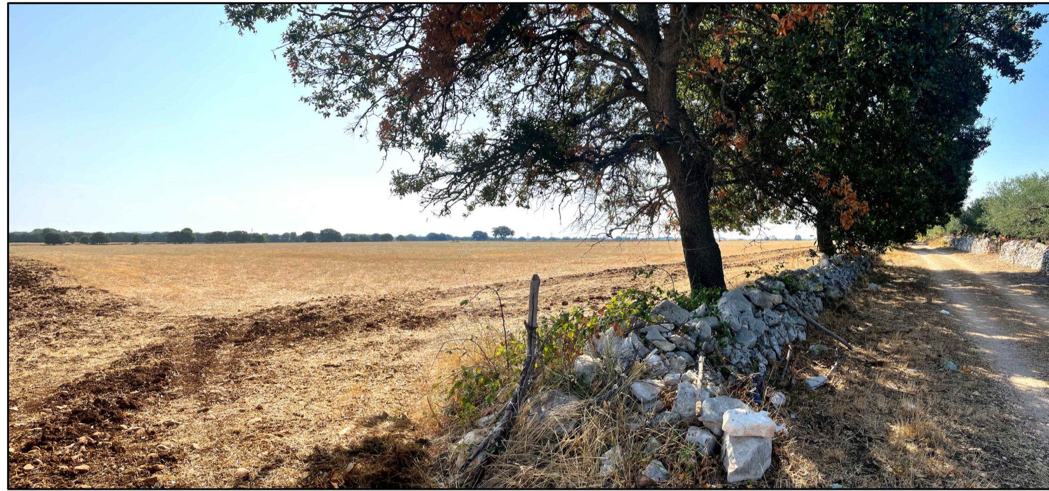
FOTOINSERIMENTO 2 - STATO DI FATTO