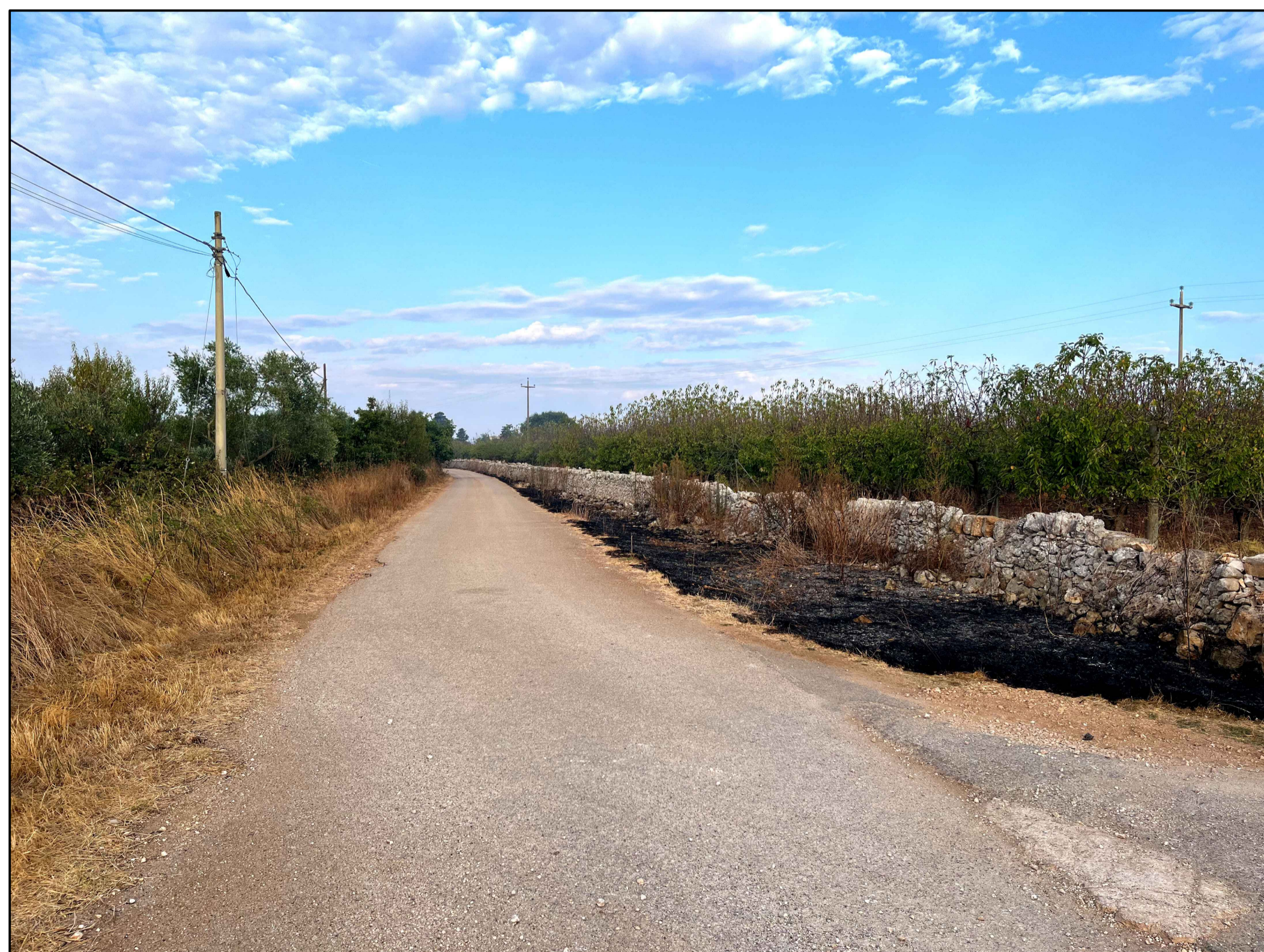
FOTOINSERIMENTO 3 - STATO DI FATTO