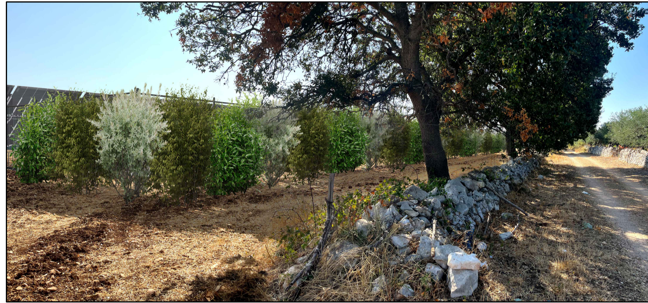
FOTOINSERIMENTO 2 - STATO DI PROGETTO