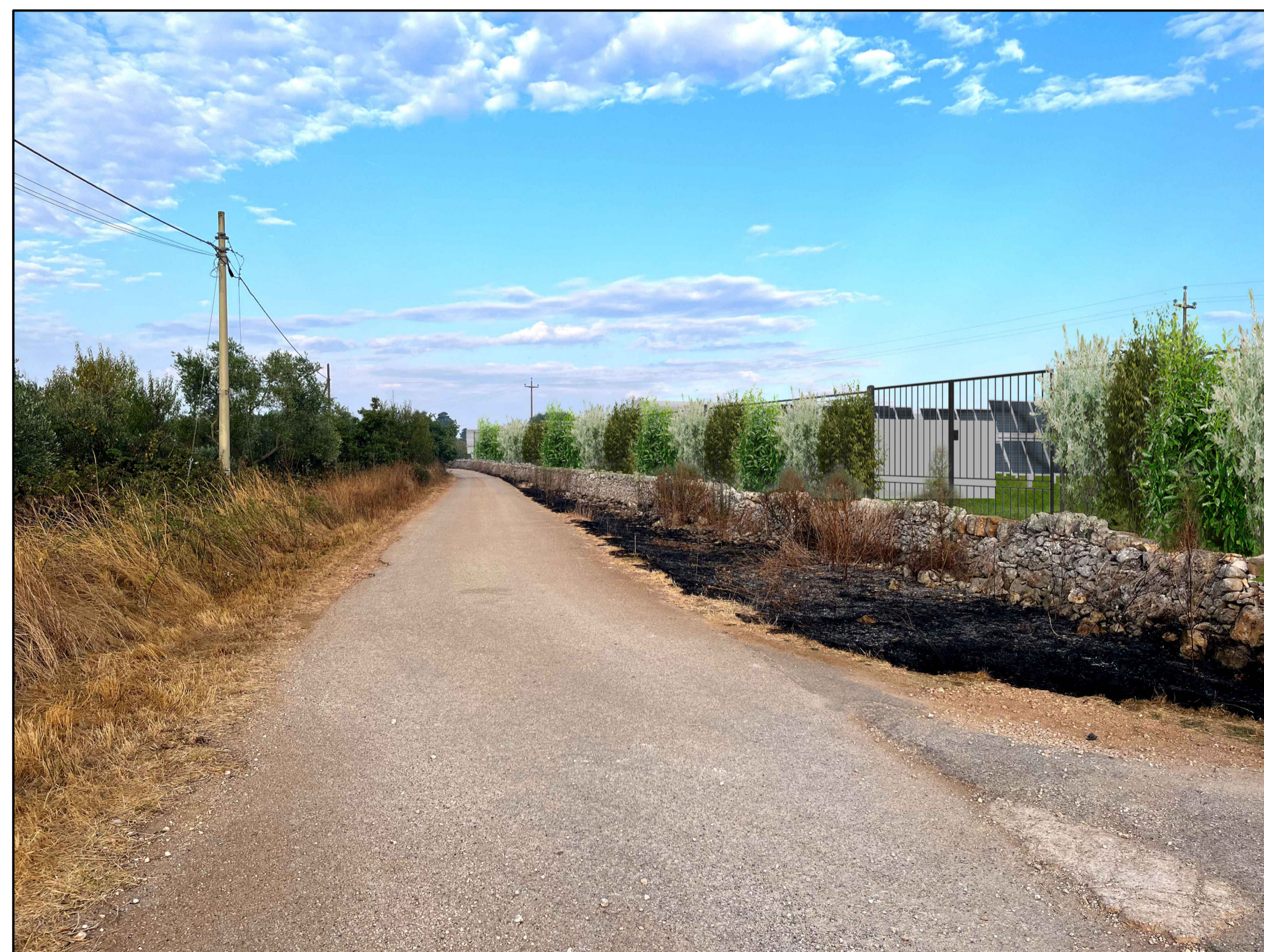
FOTOINSERIMENTO 3 - STATO DI PROGETTO