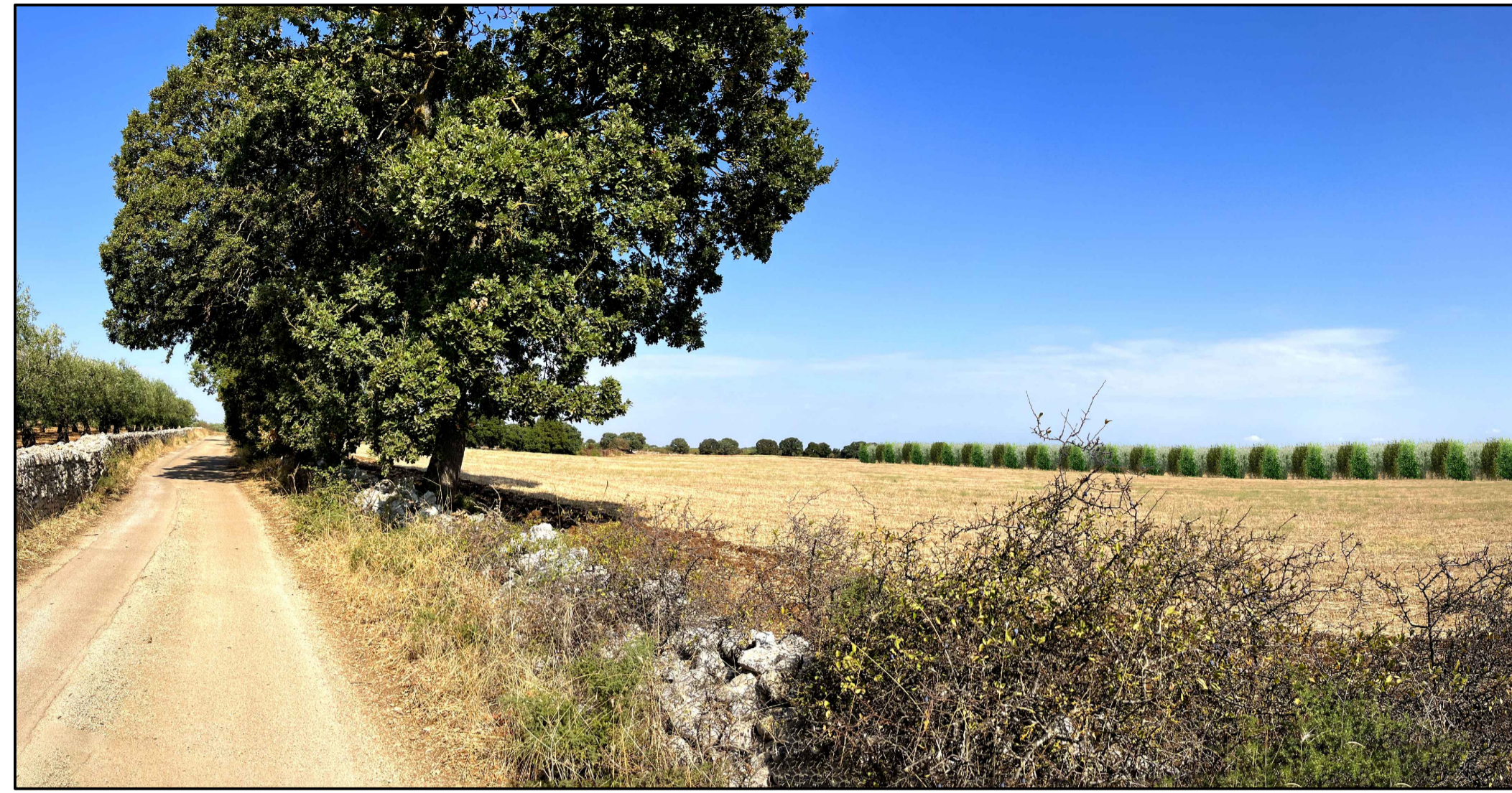
FOTOINSERIMENTO 1 - STATO DI PROGETTO