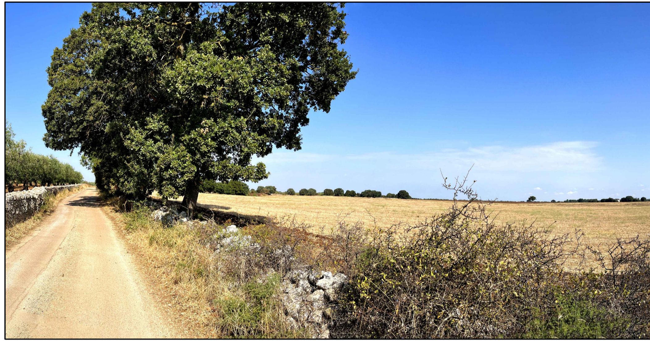
FOTOINSERIMENTO 1 - STATO DI FATTO