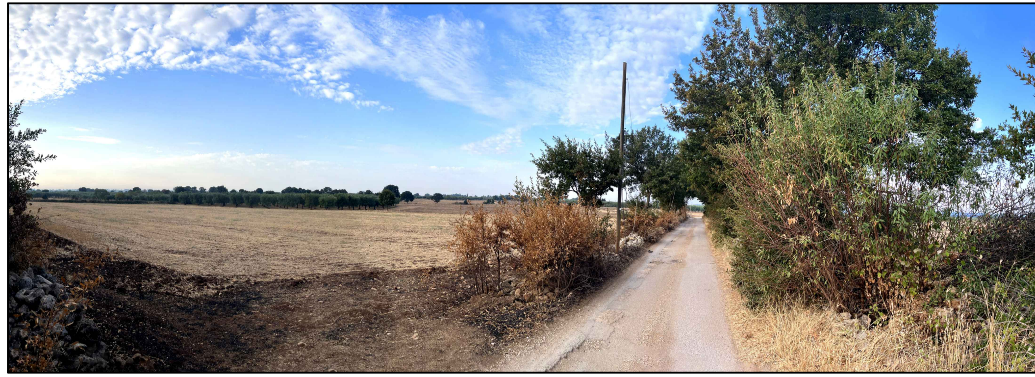
FOTOINSERIMENTO 4 - STATO DI FATTO