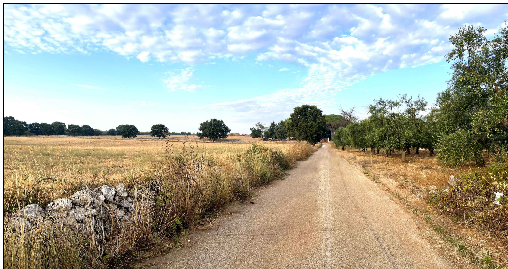
FOTOINSERIMENTO 7 - STATO DI FATTO