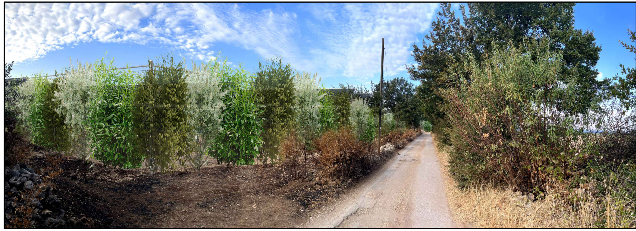
FOTOINSERIMENTO 4 - STATO DI PROGETTO