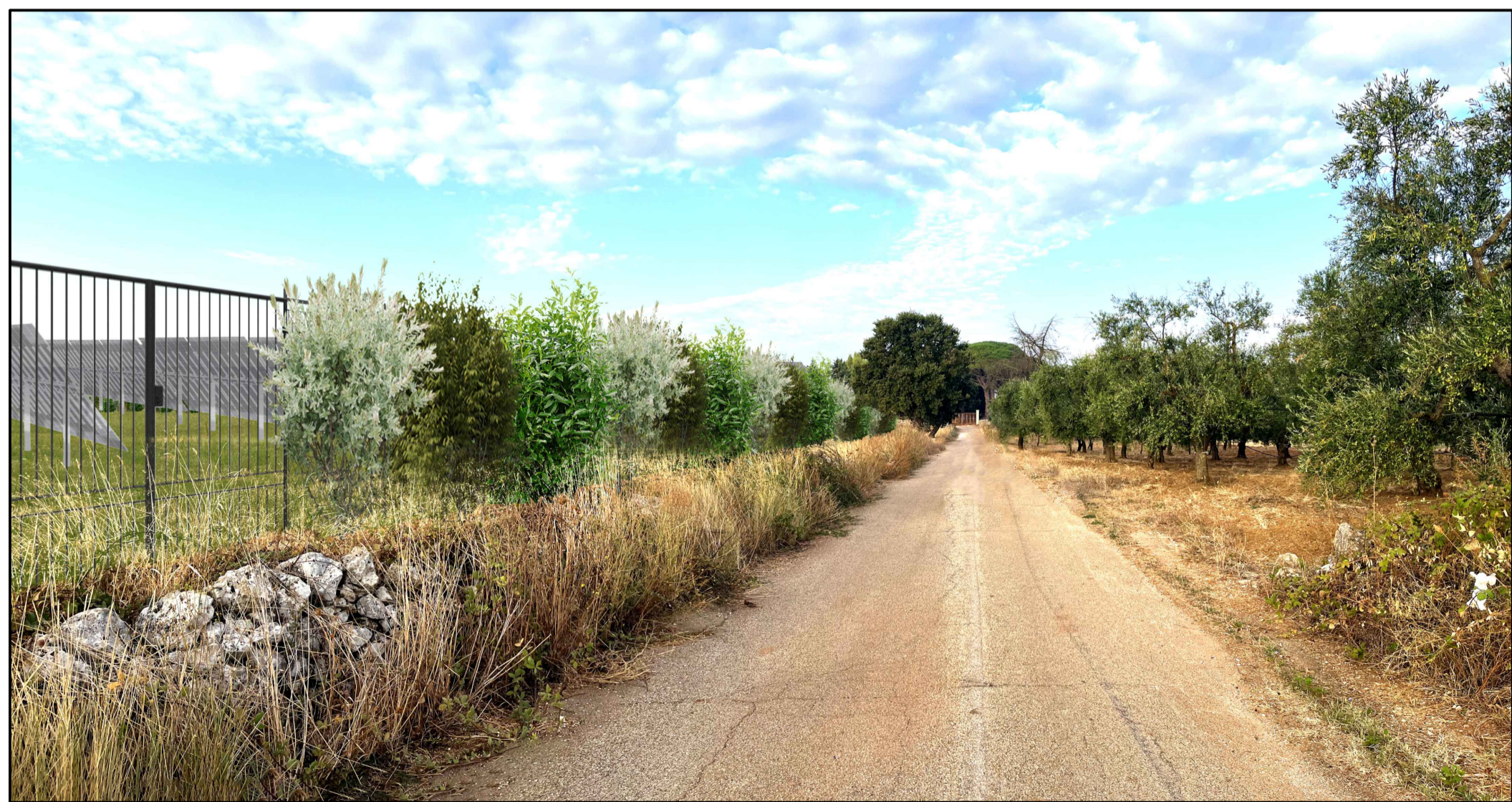
FOTOINSERIMENTO 7 - STATO DI PROGETTO