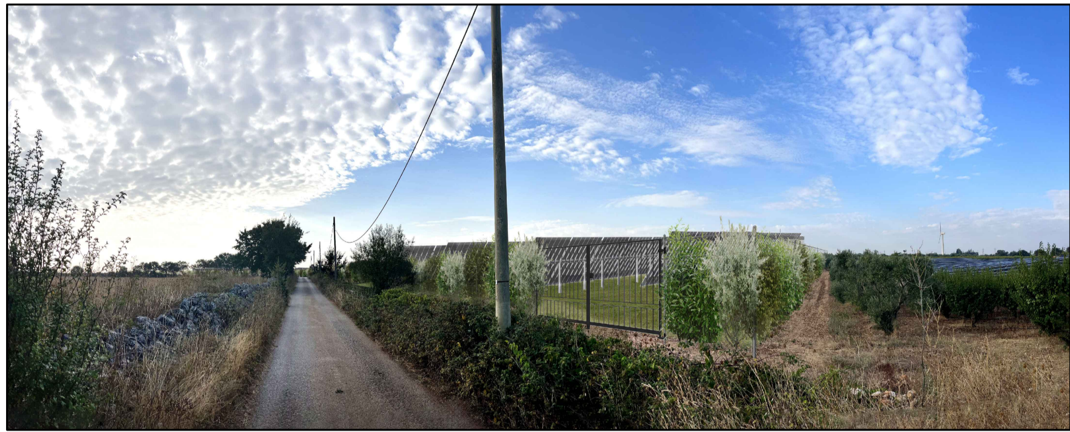
FOTOINSERIMENTO 5 - STATO DI PROGETTO