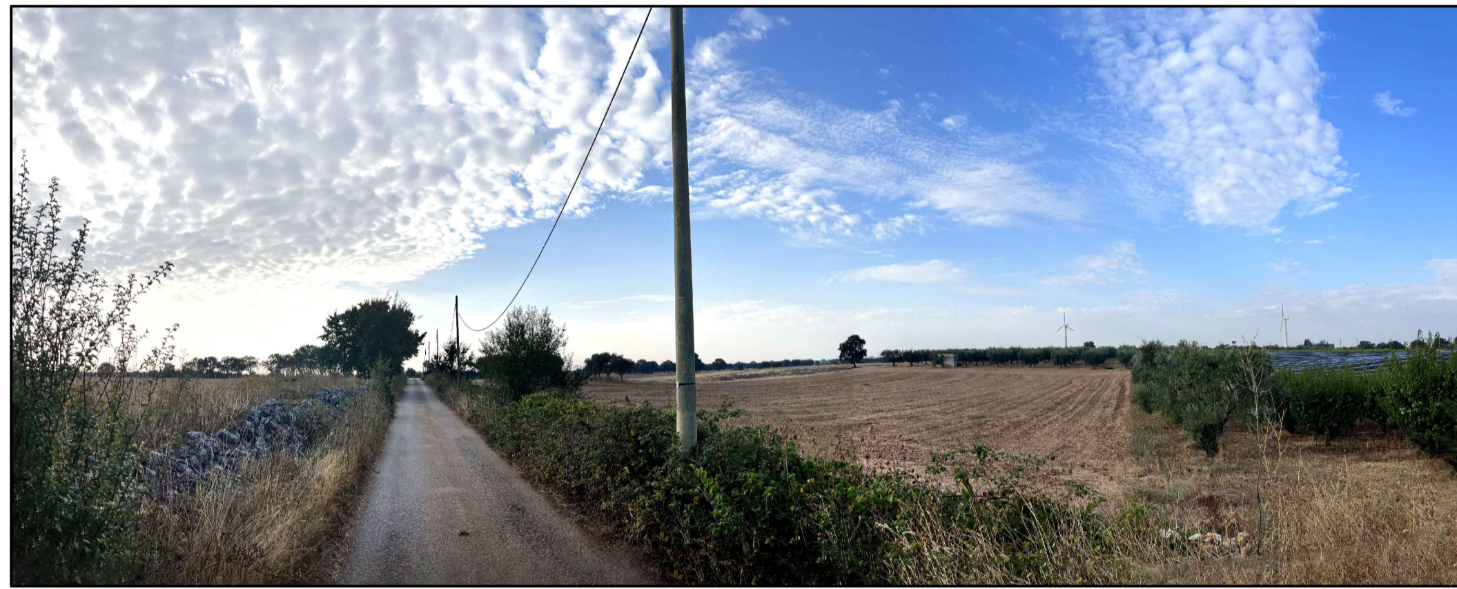
FOTOINSERIMENTO 5 - STATO DI FATTO