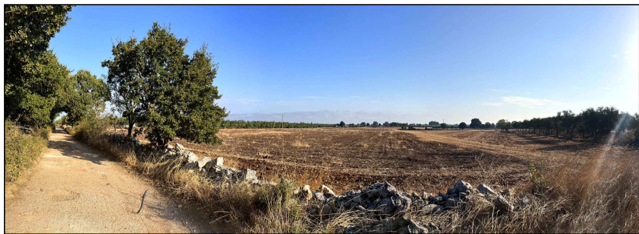
FOTOINSERIMENTO 6 - STATO DI FATTO