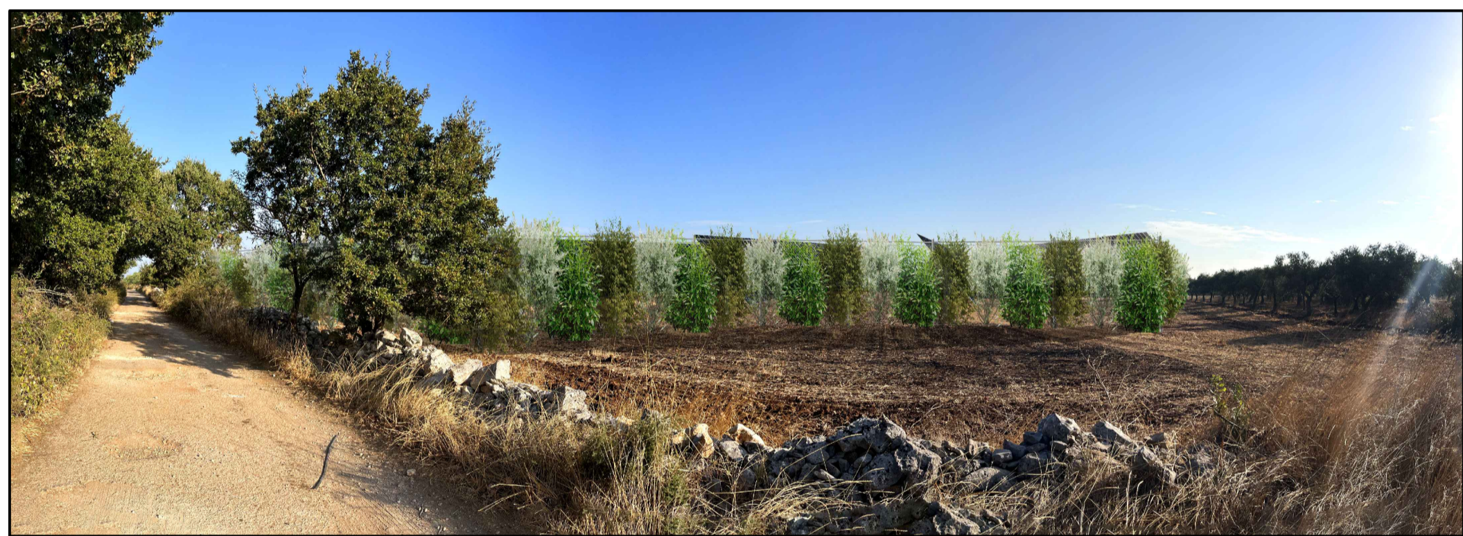
FOTOINSERIMENTO 6 - STATO DI PROGETTO