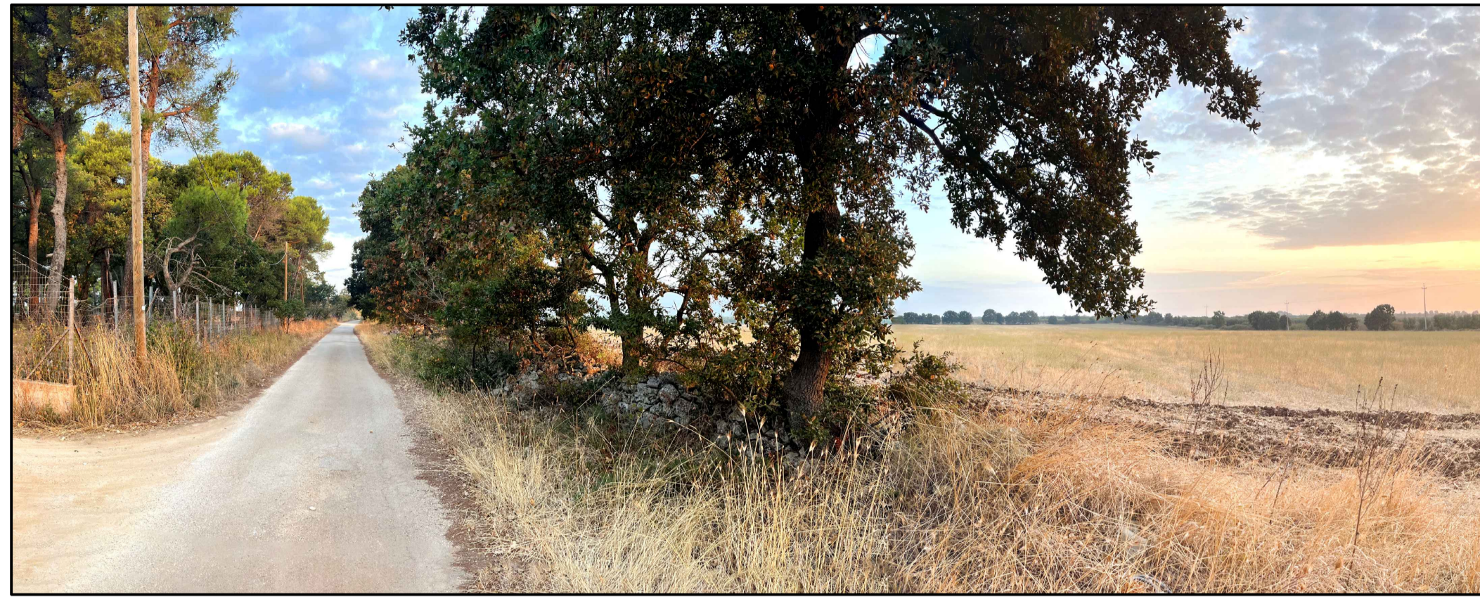
FOTOINSERIMENTO 11 - STATO DI FATTO