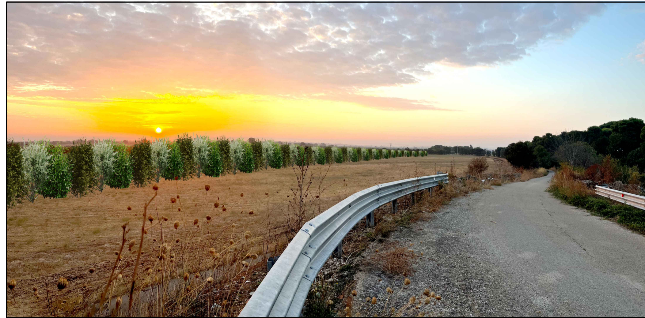
FOTOINSERIMENTO 12 - STATO DI PROGETTO