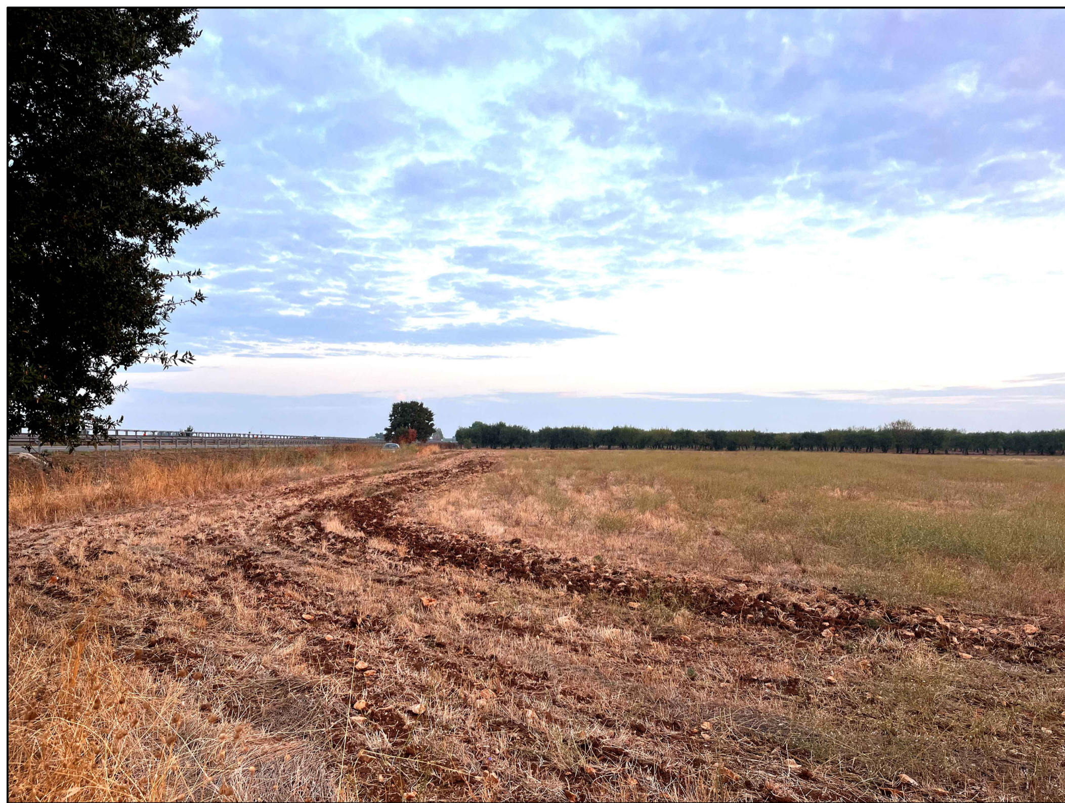
FOTOINSERIMENTO 13 - STATO DI FATTO