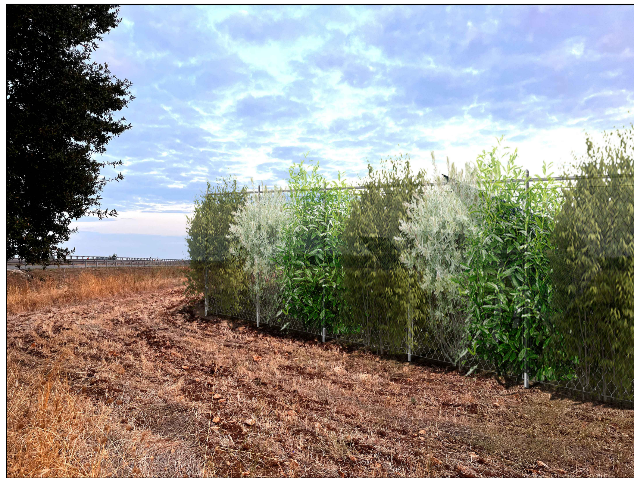
FOTOINSERIMENTO 13 - STATO DI PROGETTO