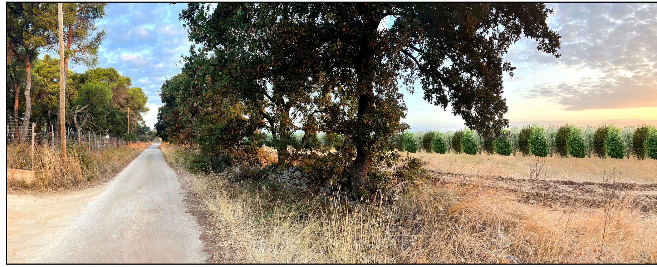
FOTOINSERIMENTO 11 - STATO DI PROGETTO