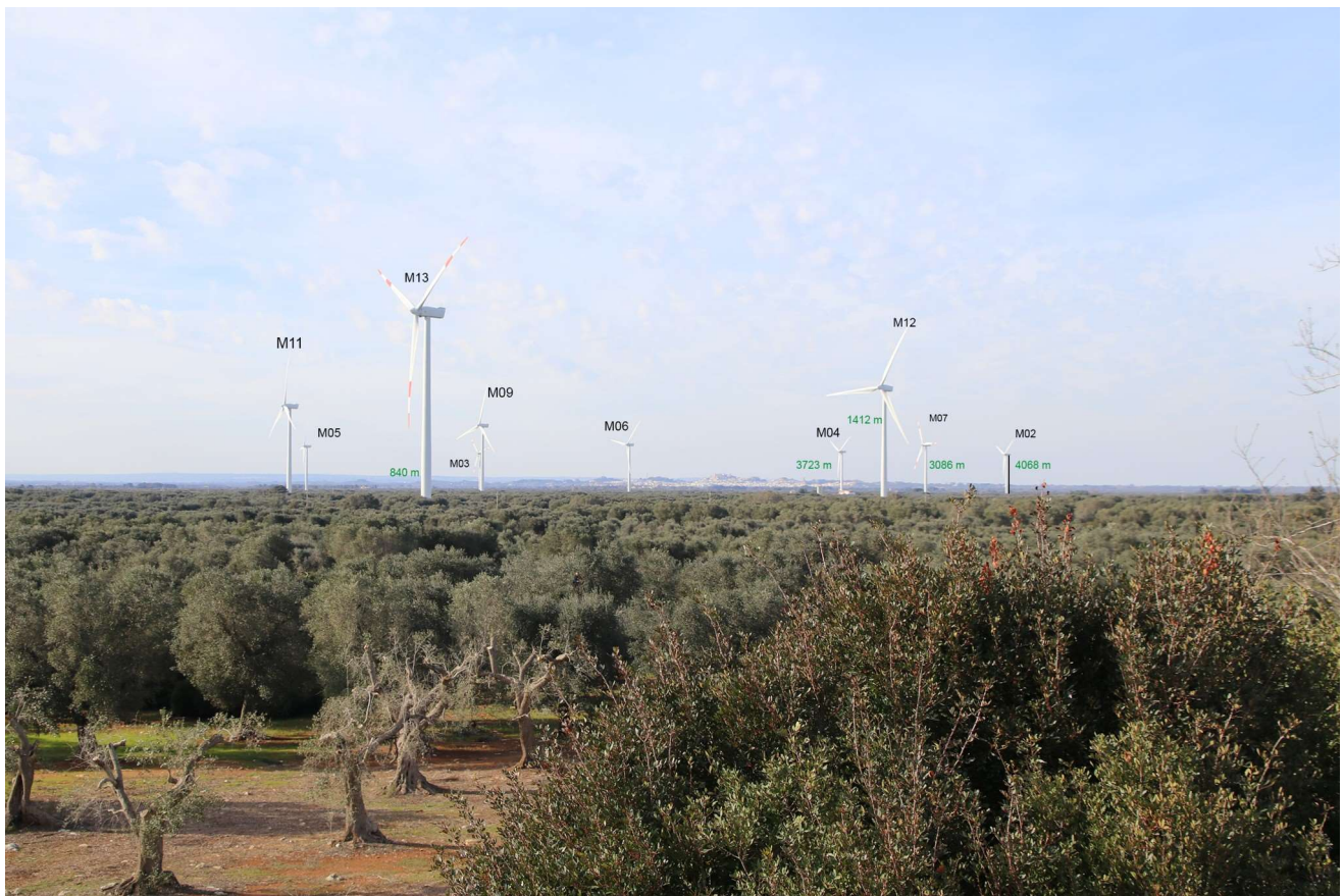
Figura 2: Impianto Eolico in territorio di Erchie (Brindisi). Aerogeneratori Gamesa G90 - Altezza al rotore m. 80, tip m. 120 Società Eolica Erchie (Realizzato). Punto di Ripresa 40.408737 17.725408 (SS 7TER) verso il baricentro impianto. Si noti come aerogeneratori con altezza pari a metà di quella di progetto sono visibili a distanza di 4000 metri.