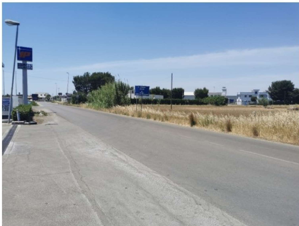
Scatto P03 Ante operam