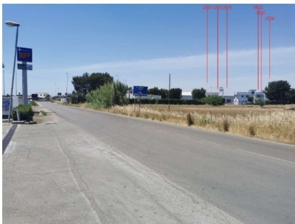
Scatto P03 Post operam