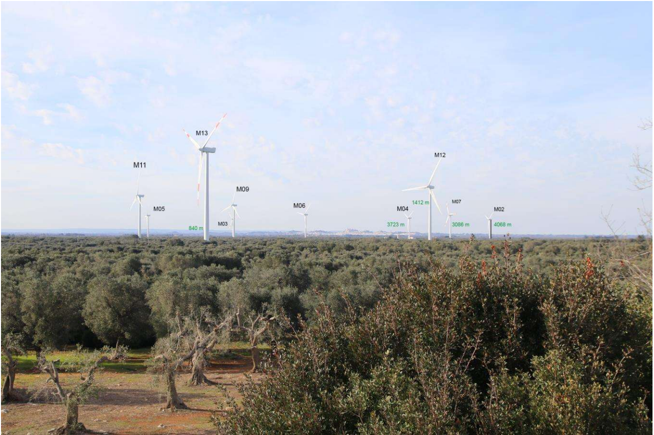
Figura 2: Impianto Eolico in territorio di Erchie (Brindisi). Aerogeneratori Gamesa G90 - Altezza al rotore m. 80, tip m. 120 Società Eolica Erchie (Realizzato). Punto di Ripresa 40.408737 17.725408 (SS 7TER) verso il baricentro impianto. Si noti come aerogeneratori con altezza pari a metà di quella di progetto sono visibili a distanza di 4000 metri.