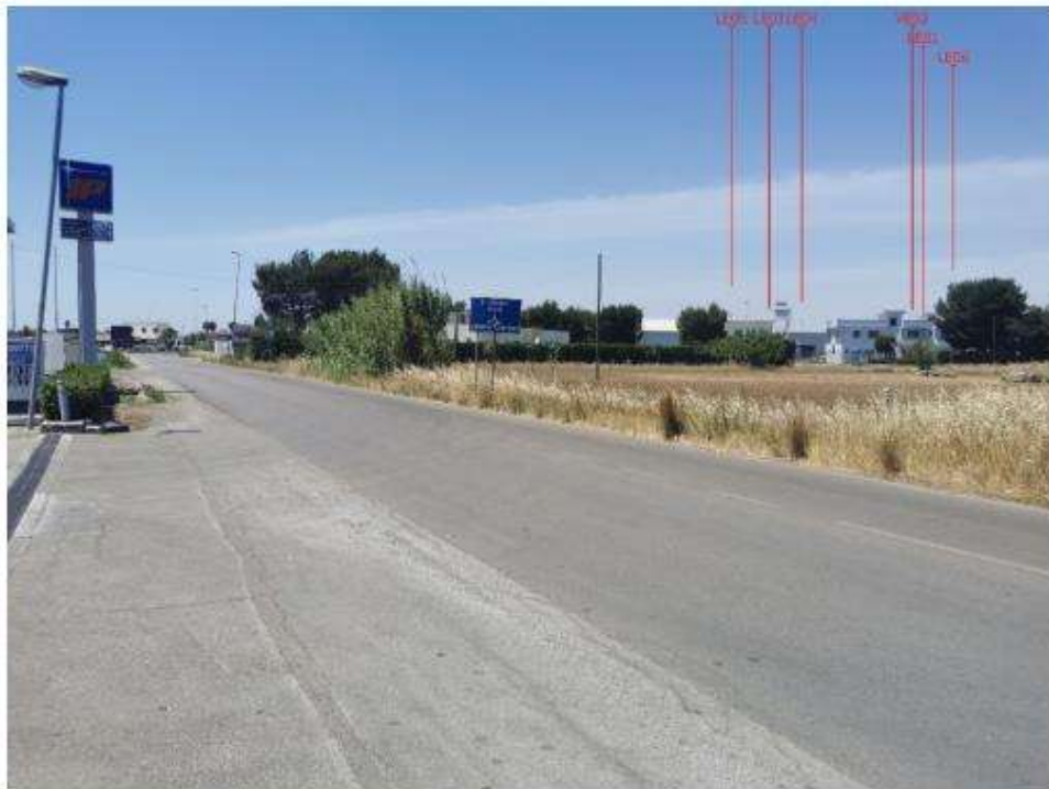
Scatto P03 Post operam