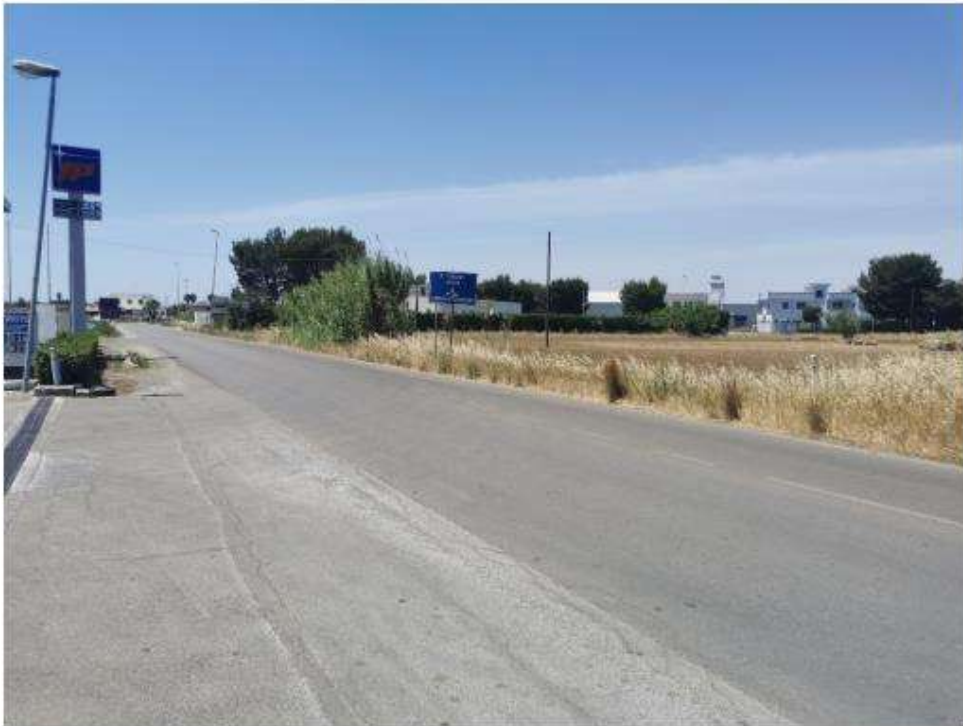
Scatto P03 Ante operam