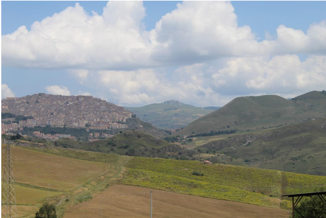
Figura 2-11: Foto 6 - Ante-operam