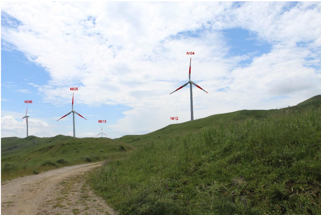
Figura 2-4: Foto 2 - Post-operam