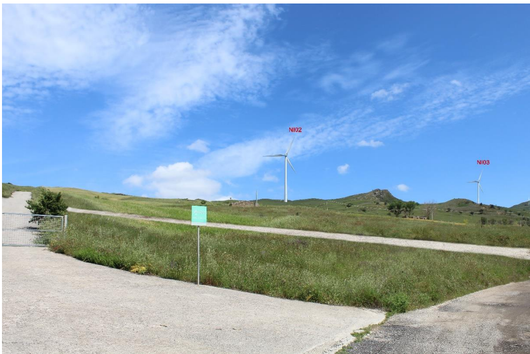
Figura 2-2: Foto 1 - Post-operam