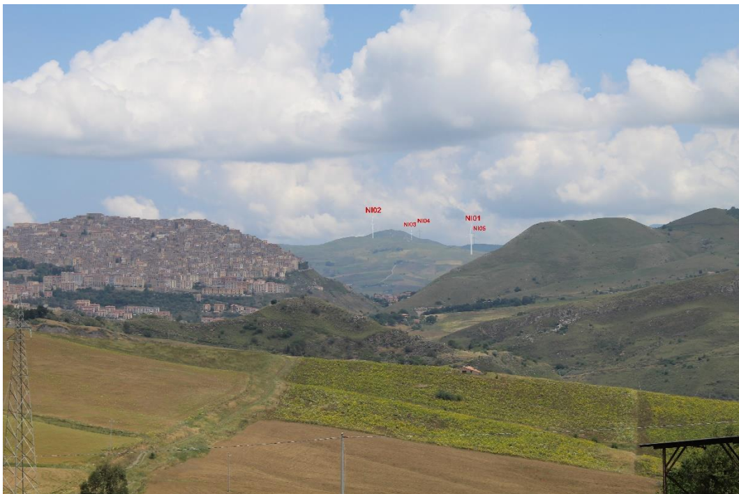
Figura 2-12: Foto 6 - Post-operam