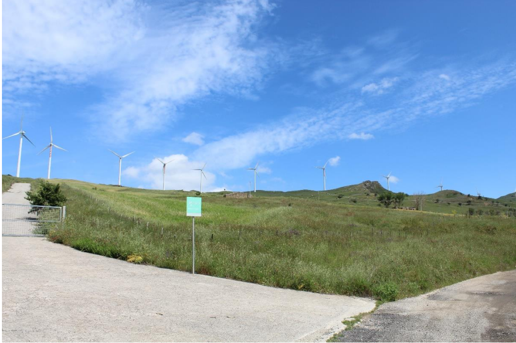
Figura 2-1: Foto 1 - Ante-operam