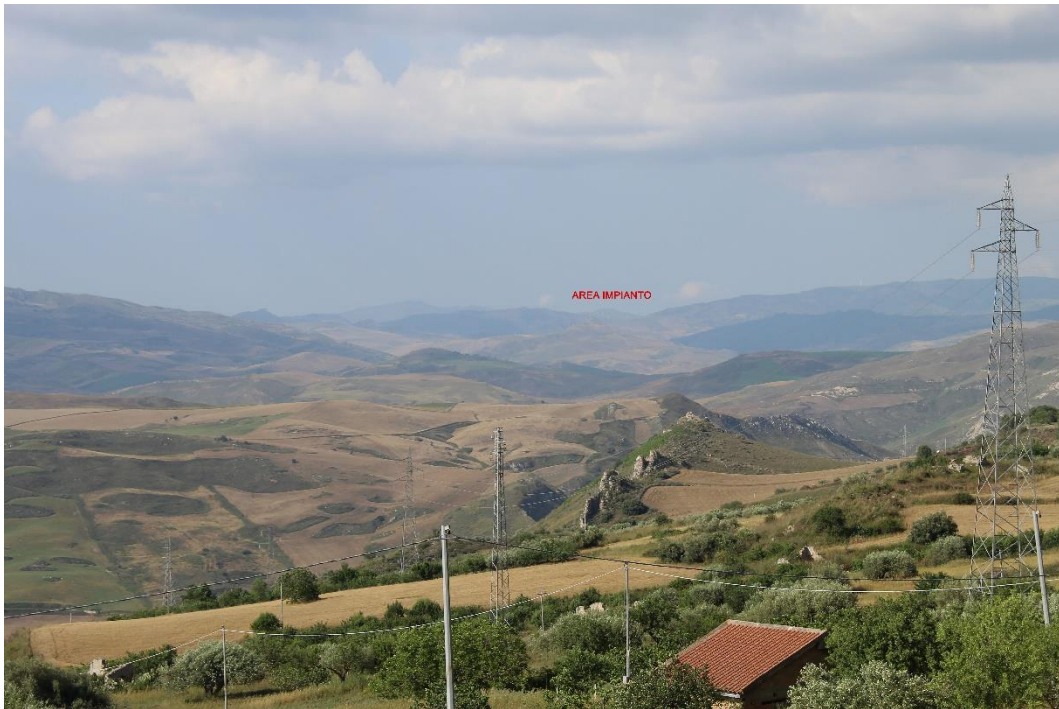
Figura 2-8: Foto 4 - Post-operam