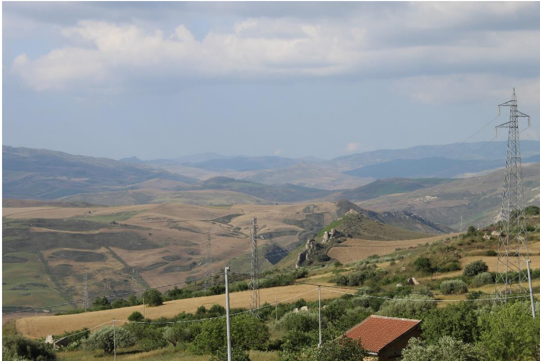
Figura 2-7: Foto 4 - Ante-operam