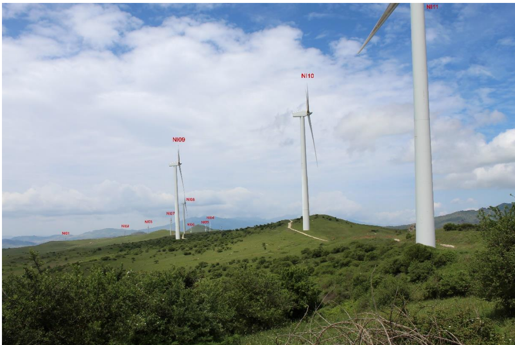
Figura 2-6: Foto 3 - Post-operam