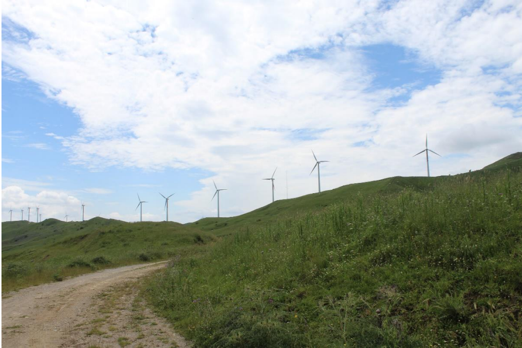
Figura 2-3: Foto 2 - Ante-operam