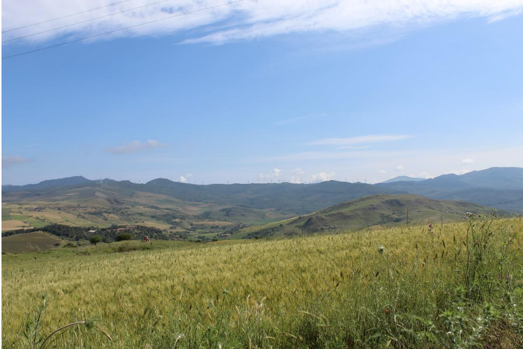
Figura 2-9: Foto 5 - Ante-operam