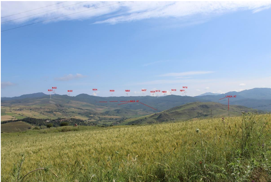
Figura 2-10: Foto 5 - Post-operam