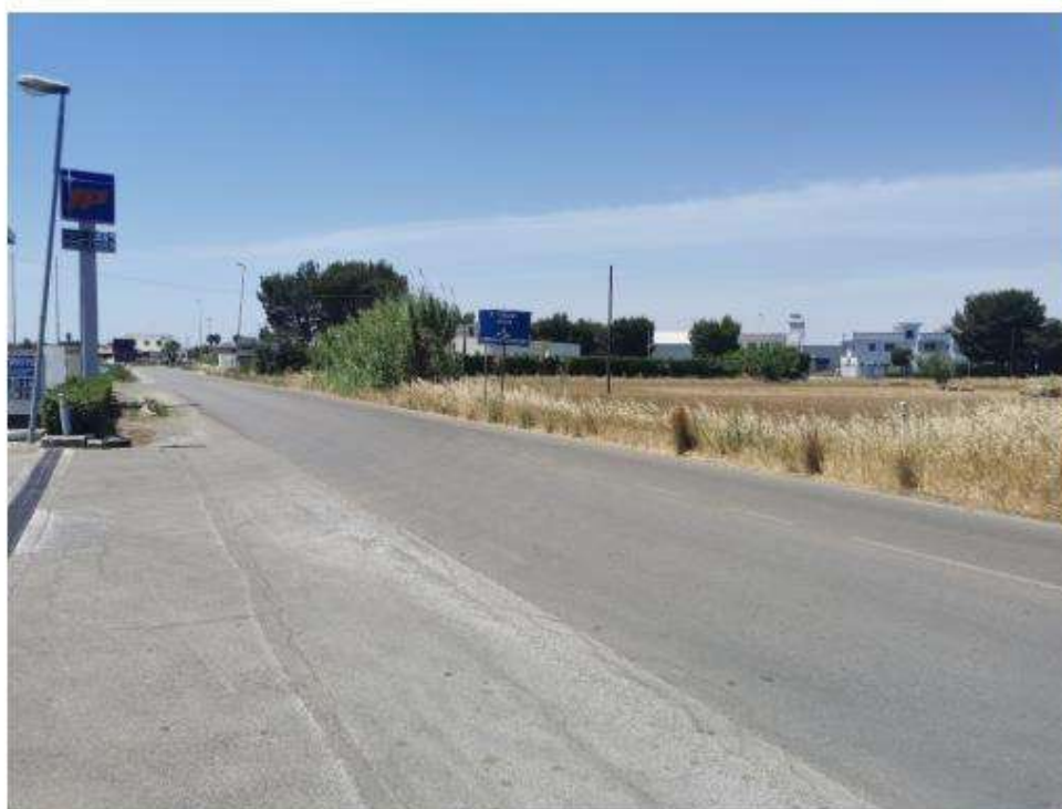
Scatto P03 Ante operam

LE05 e LE06, in quanto vi è una morfologia pianeggiante, ma di fatto non del tutto percepibili data la presenza di ostacoli visivi.