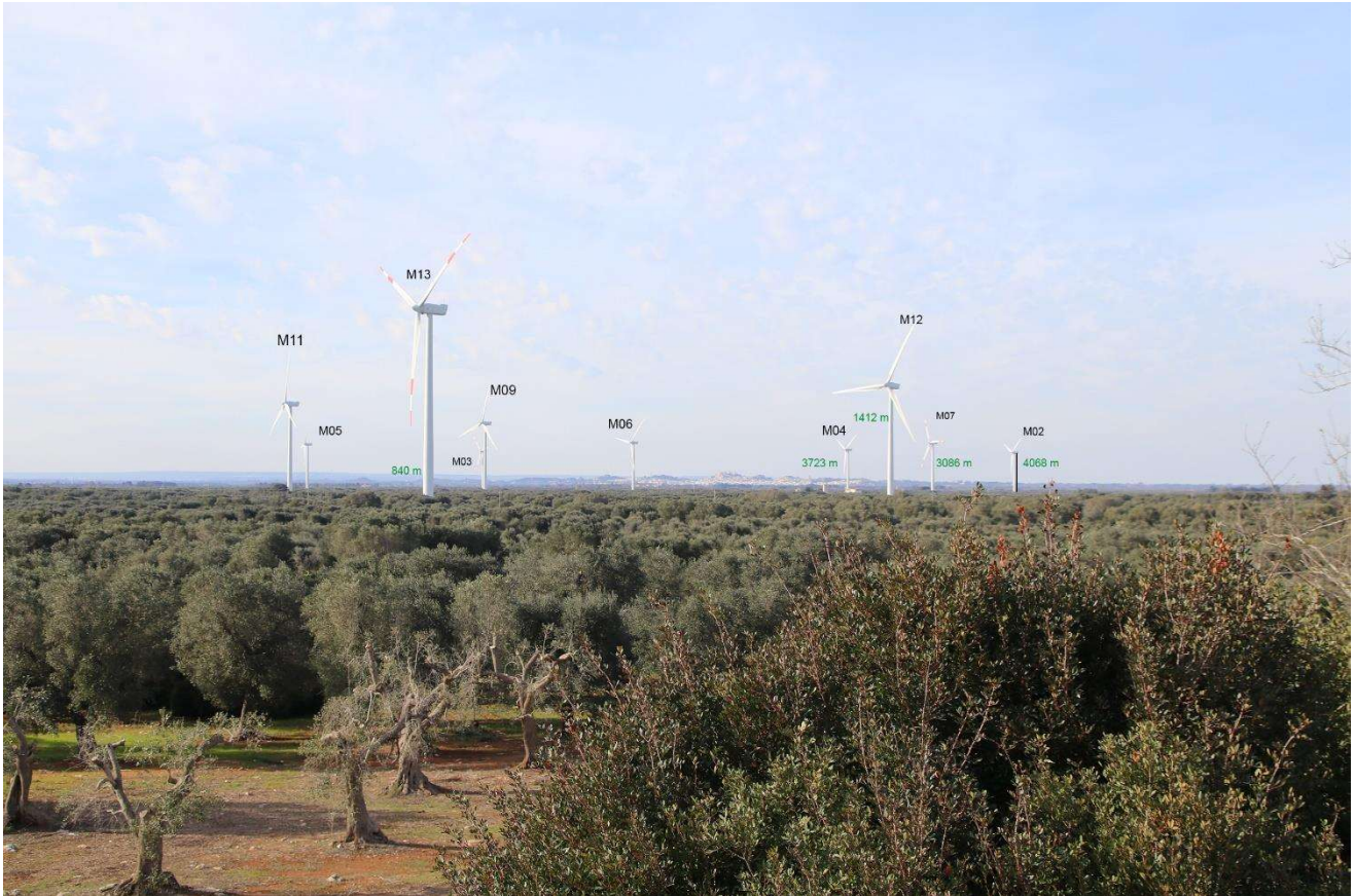
Figura 2: Impianto Eolico in territorio di Erchie (Brindisi). Aerogeneratori Gamesa G90 - Altezza al rotore m. 80, tip m. 120 Società Eolica Erchie (Realizzato). Punto di Ripresa 40.408737 17.725408 (SS 7TER) verso il baricentro impianto. Si noti come aerogeneratori con altezza pari a metà di quella di progetto sono visibili a distanza di 4000 metri.