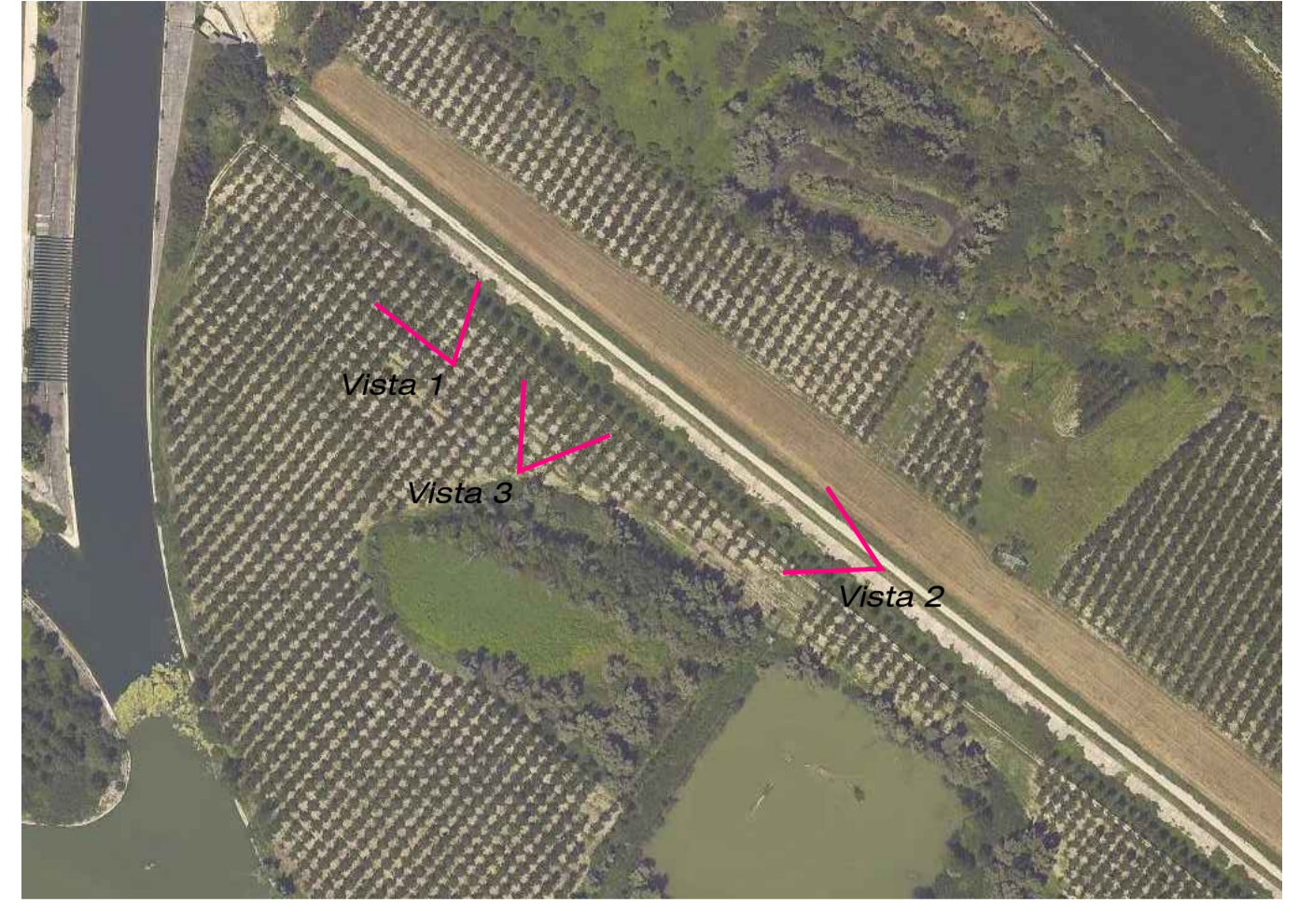
Ortofoto con individuazione dei coni ottici delle tre viste