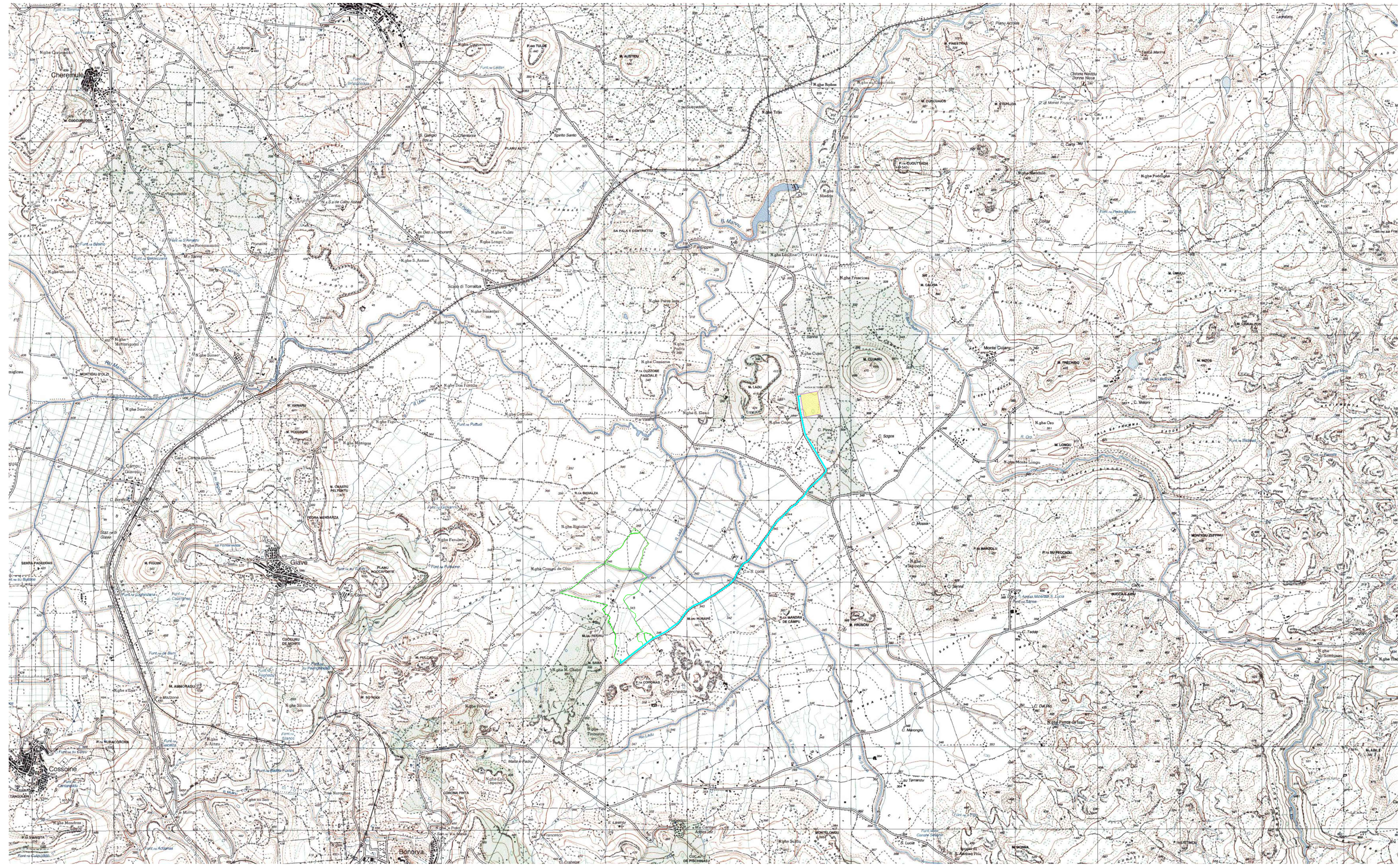
Inquadramento impianto FV fino alla nuova SE TERNA 220 / 36 kV su IGM scala 1:25000