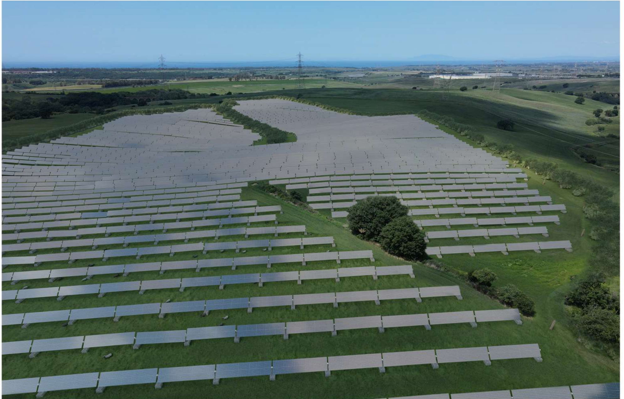
Foto 3_Vista drone_Fotoinserimento