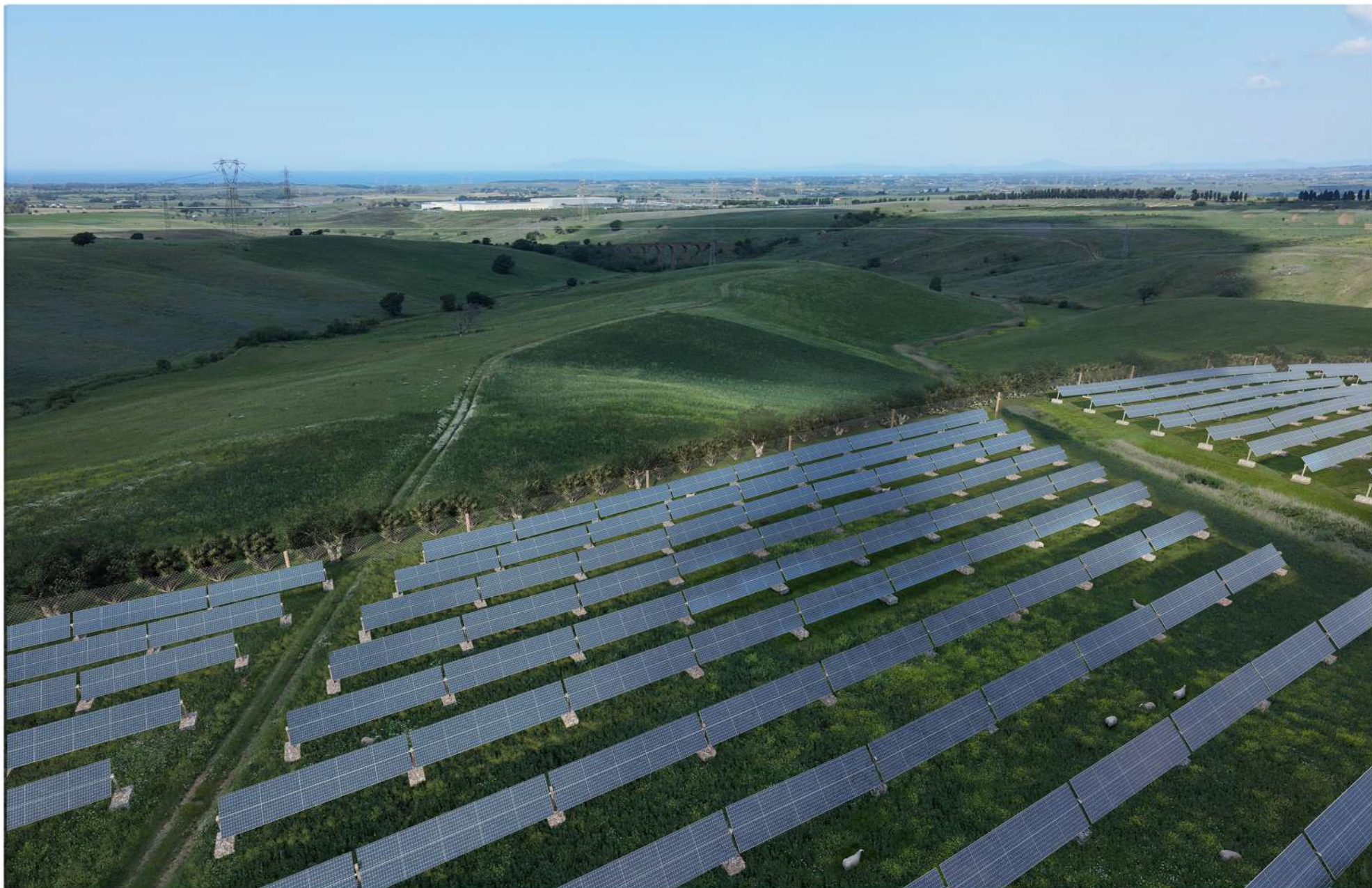
Foto 1_Vista drone_Fotoinserimento