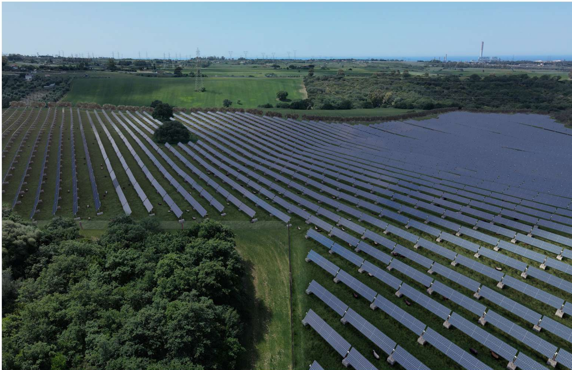
Foto 2_Vista drone_Fotoinserimento