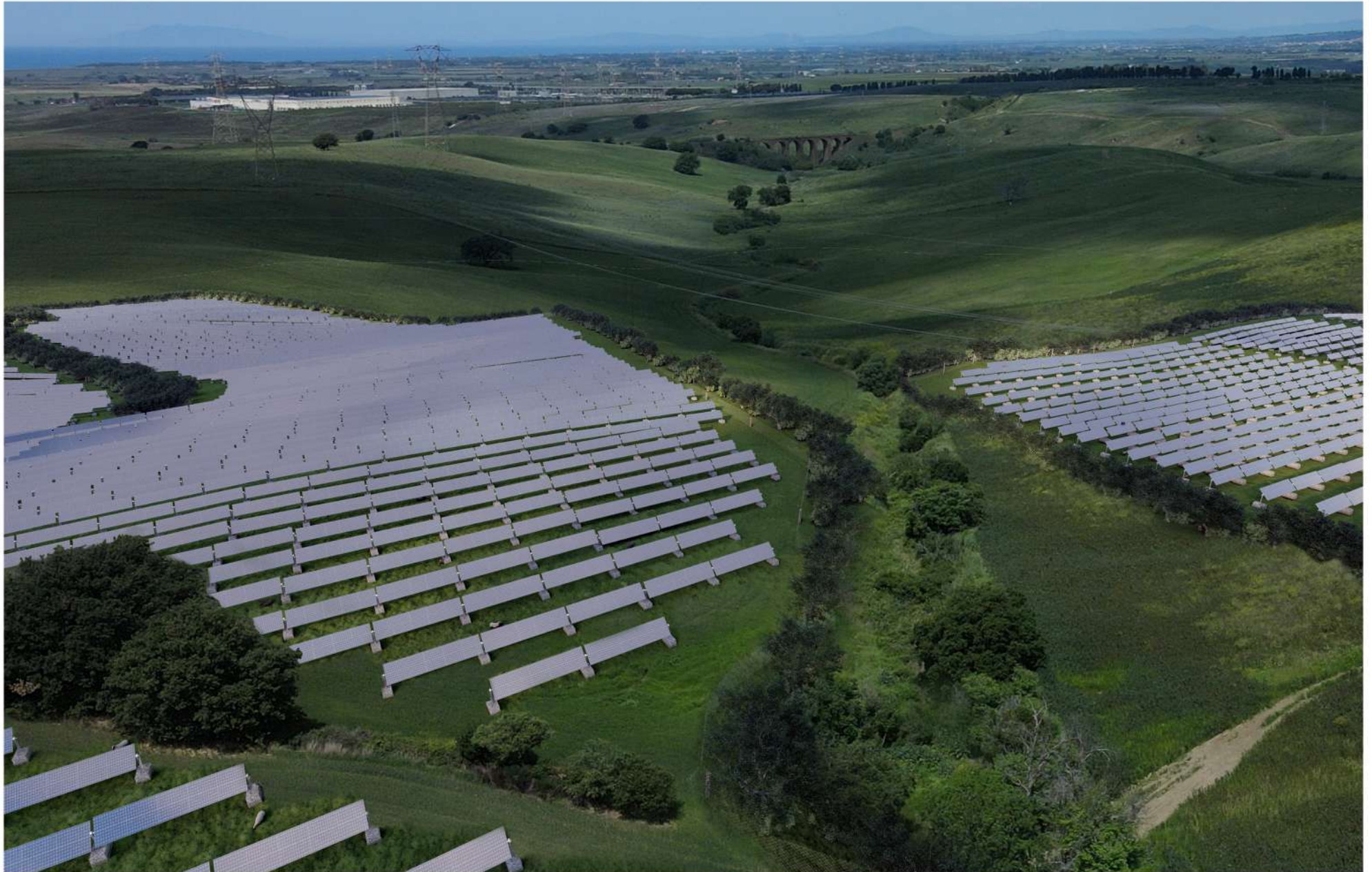
Foto 4_Vista drone