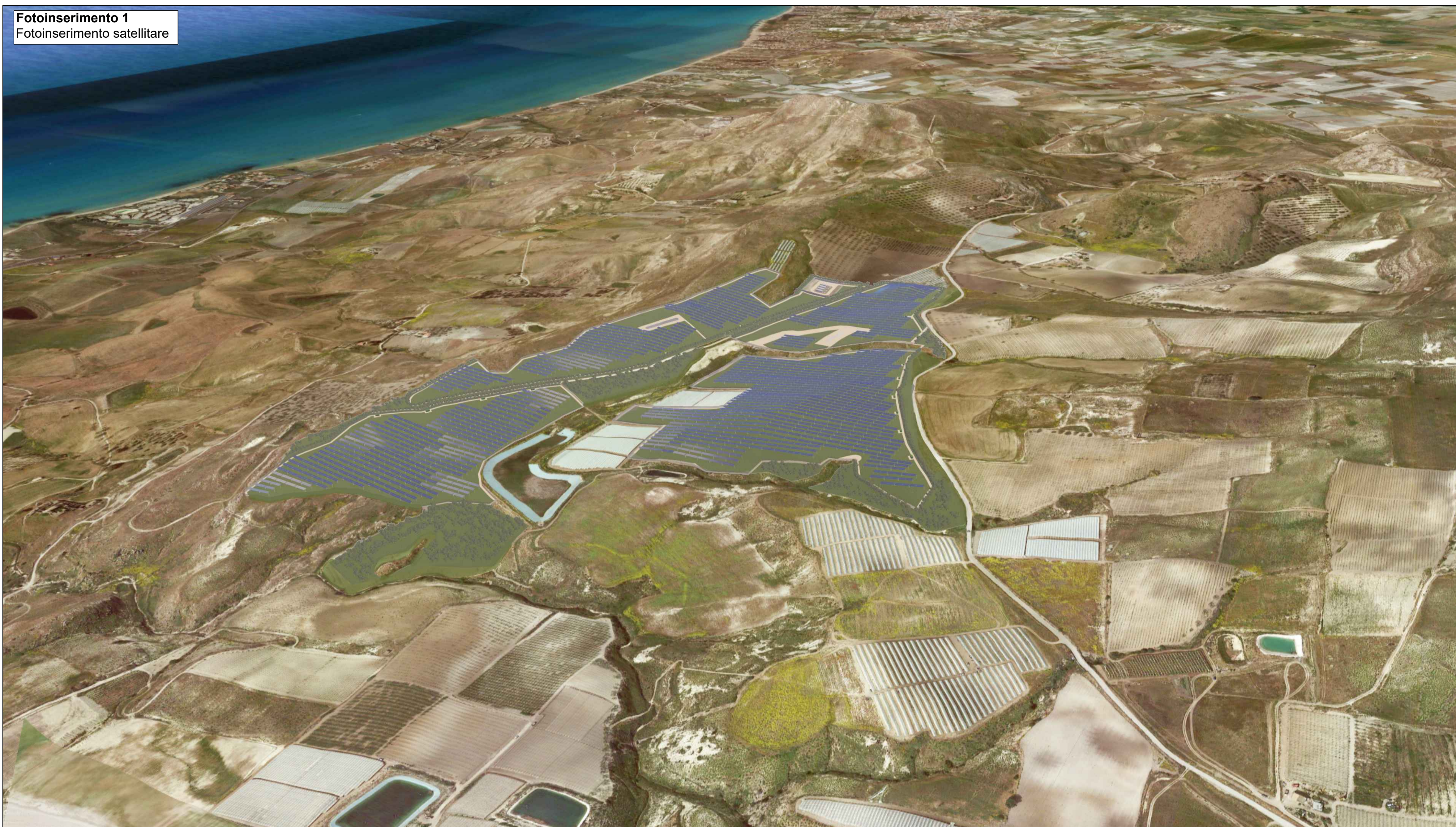
Fotoinserimento 1 Fotoinserimento satellitare