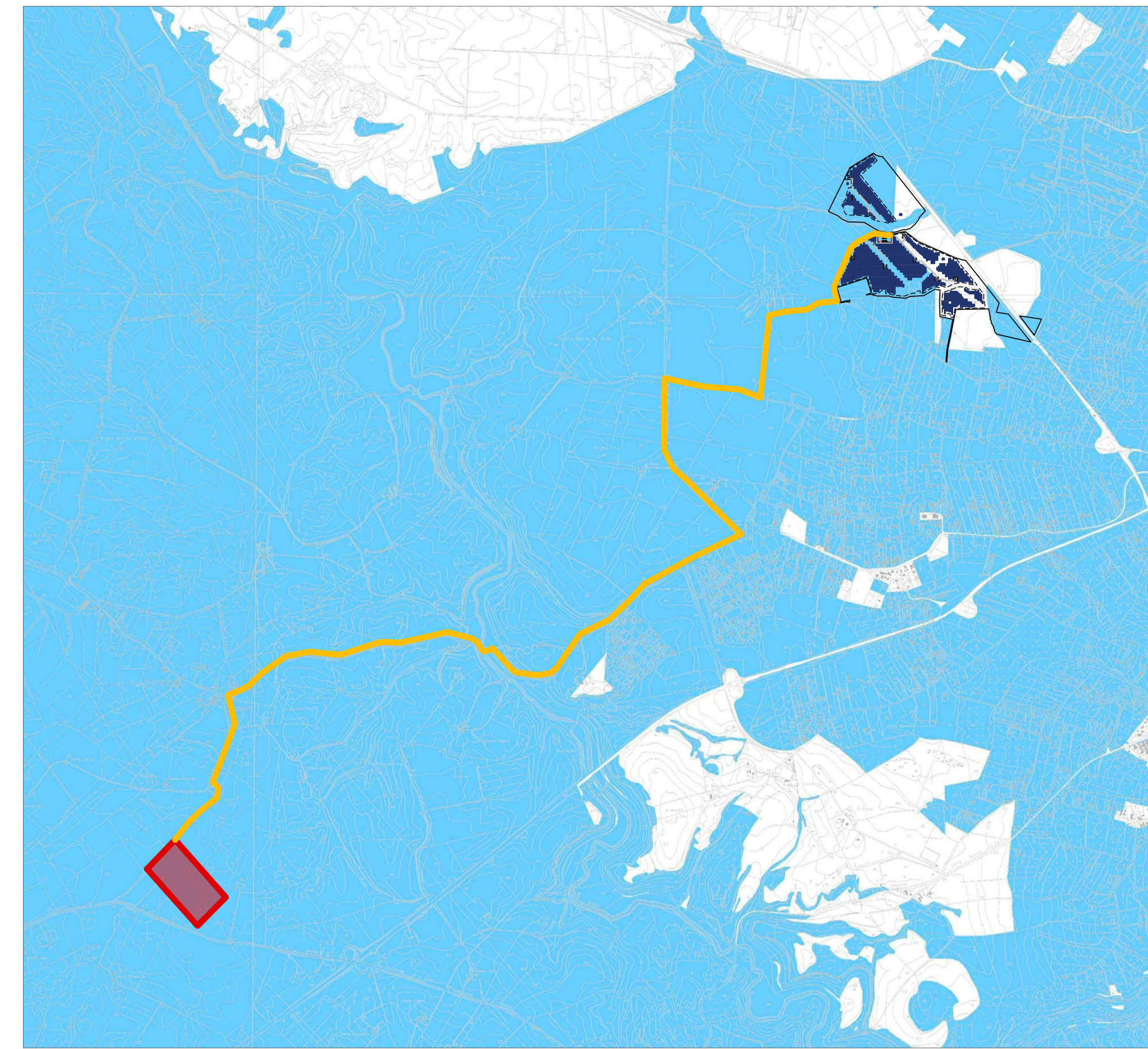
AREE NON IDONEE ALL'INSTALLAZIONE DI IMPIANTI FTV IN TERRA > 200 KwP (el. 6.1.3 del PUC) scala 1 : 25 000