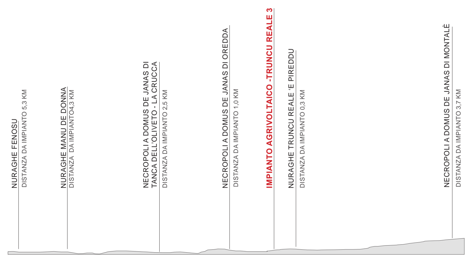
SEZIONE TIPO 1