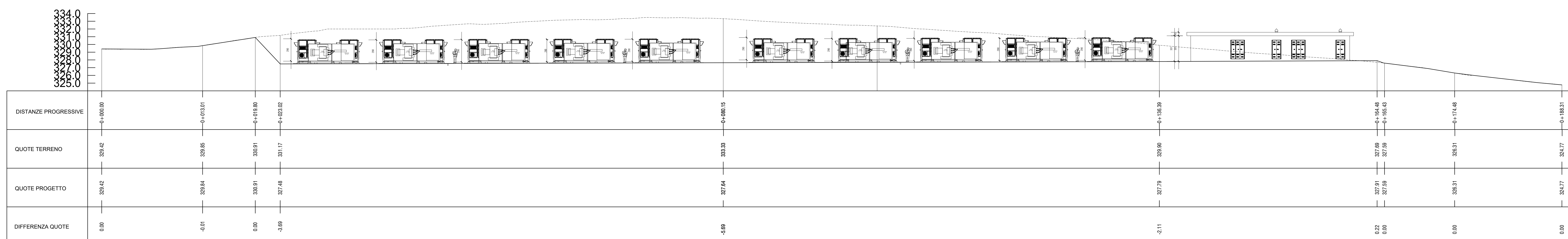
Layout Sottostazione Utente e SE TERNA "Buseto 2" Scala 1:1.000