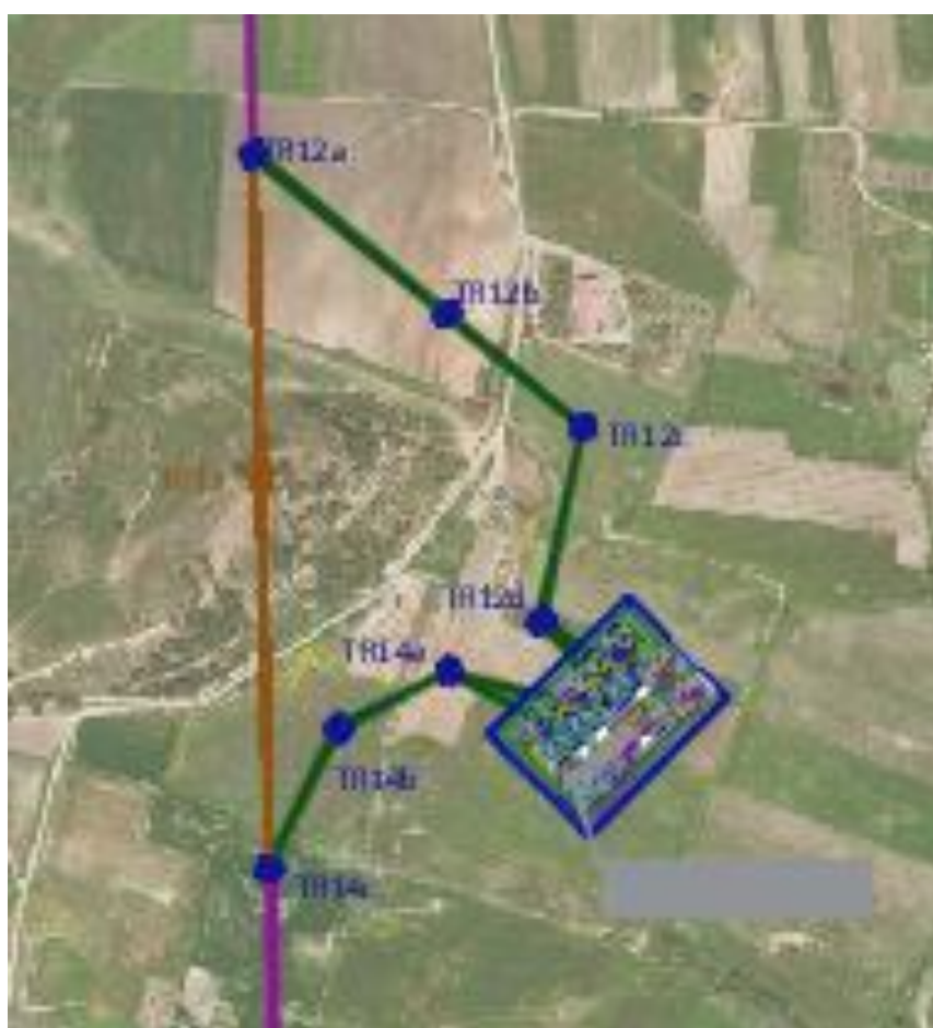
Figura 2: Inquadramento dei raccordi della nuova SE “Buseto 2” alla linea DT 150 kV “Buseto-Fulgatore” e “Buseto-Castellammare del Golfo”