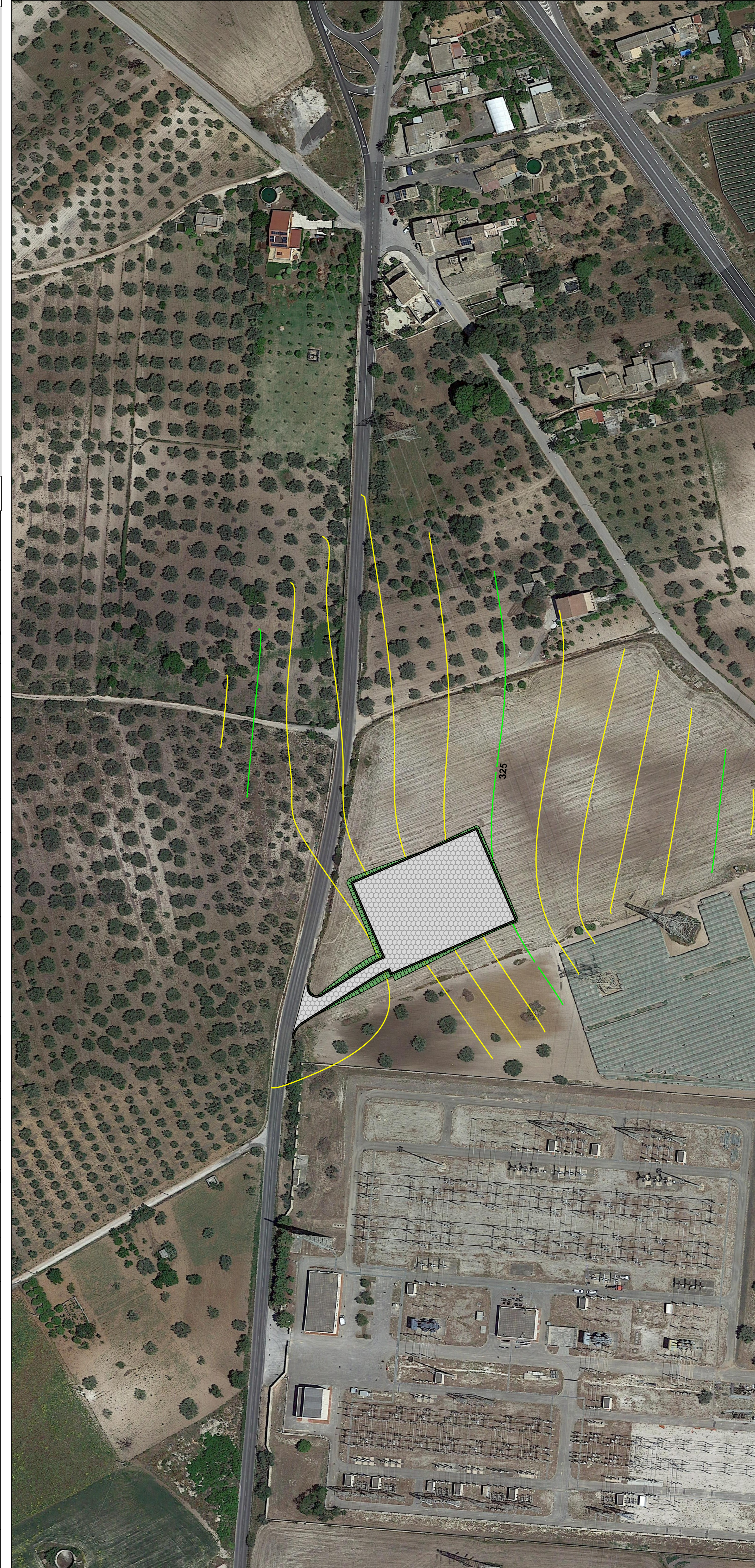
Planimetria Particolareggiata su Ortofoto - Scala 1:1000