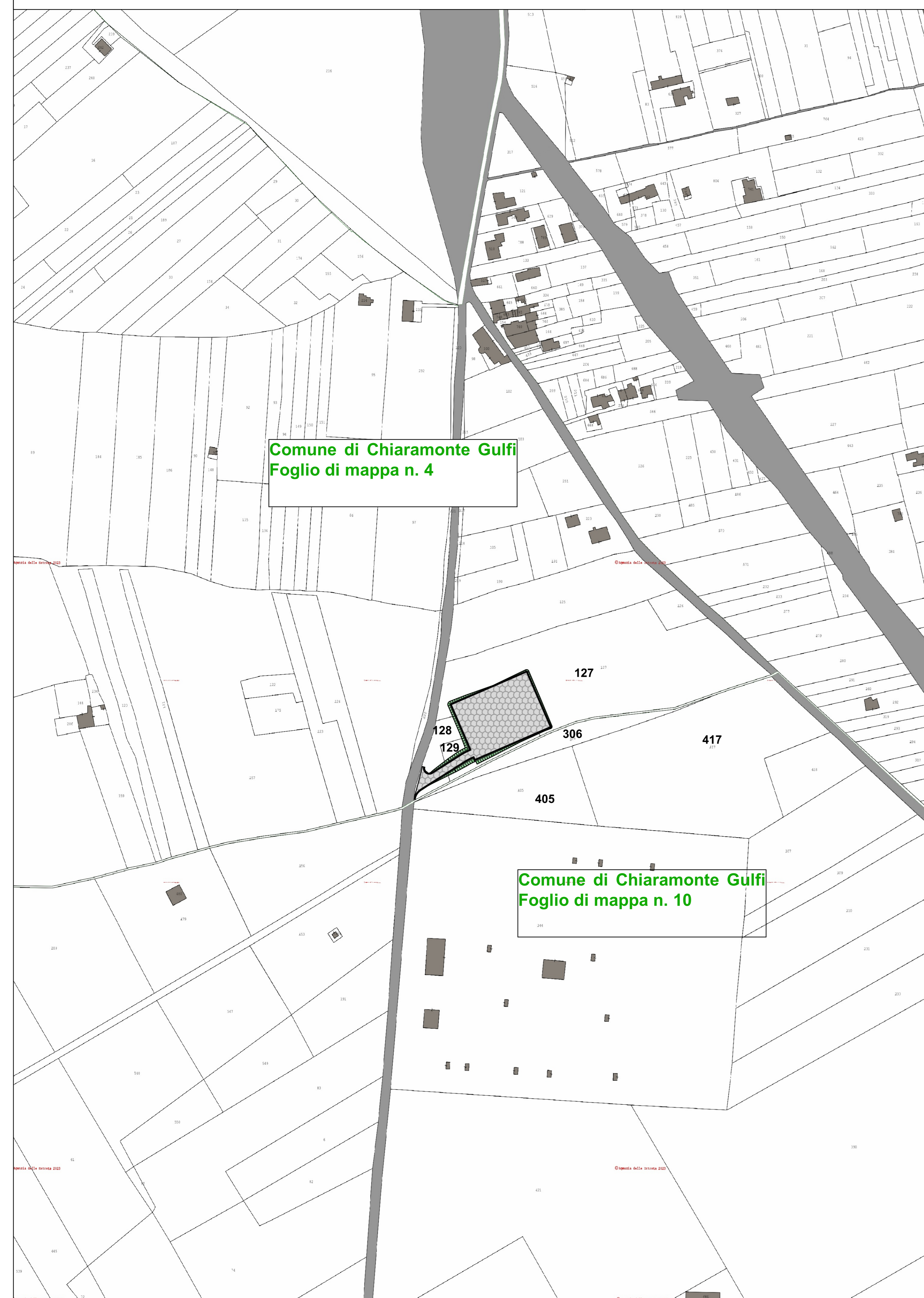
Planimetria Particolareggiata su Catastale - Scala 1:2000