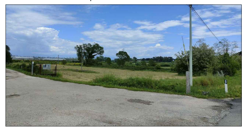
Punto di osservazione 4 - impianto visibile