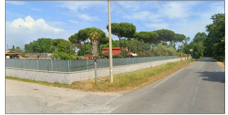
Punto di osservazione 2 - impianto non visibile