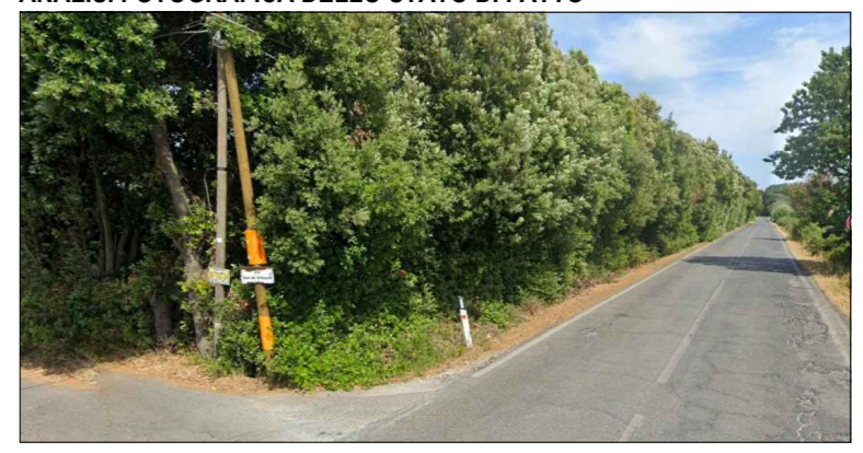
Punto di osservazione 1 - impianto non visibile