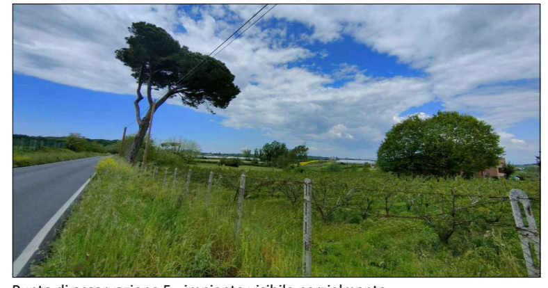
Punto di osservazione 5 - impianto visibile parzialmente