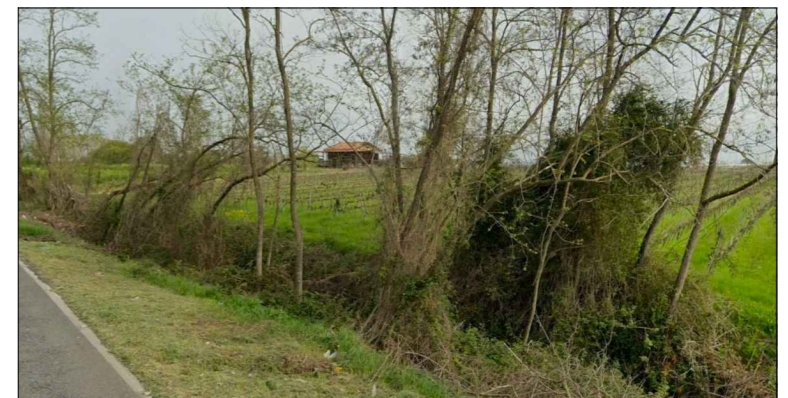
Punto di osservazione 3 - impianto visibile