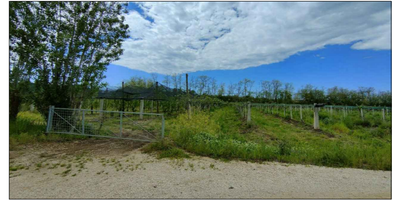
Punto di osservazione 7 - impianto non visibile