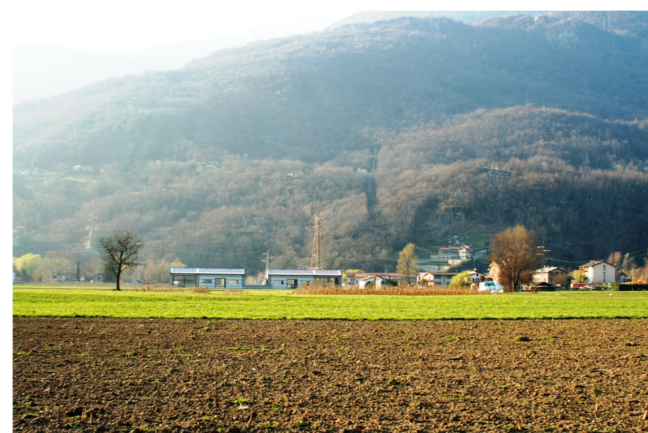
Osservatore posizionato a 500 m. dal sostegno