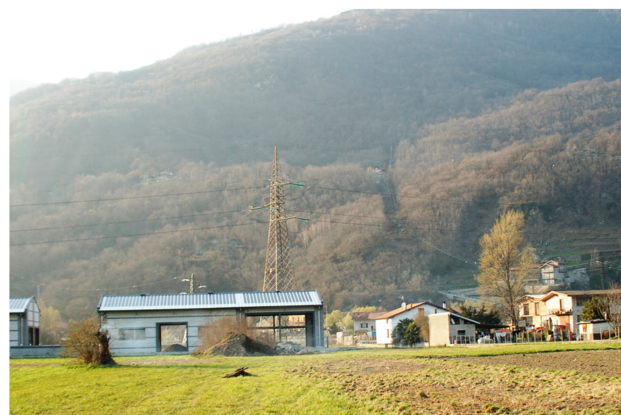
Osservatore posizionato a 250 m. dal sostegno