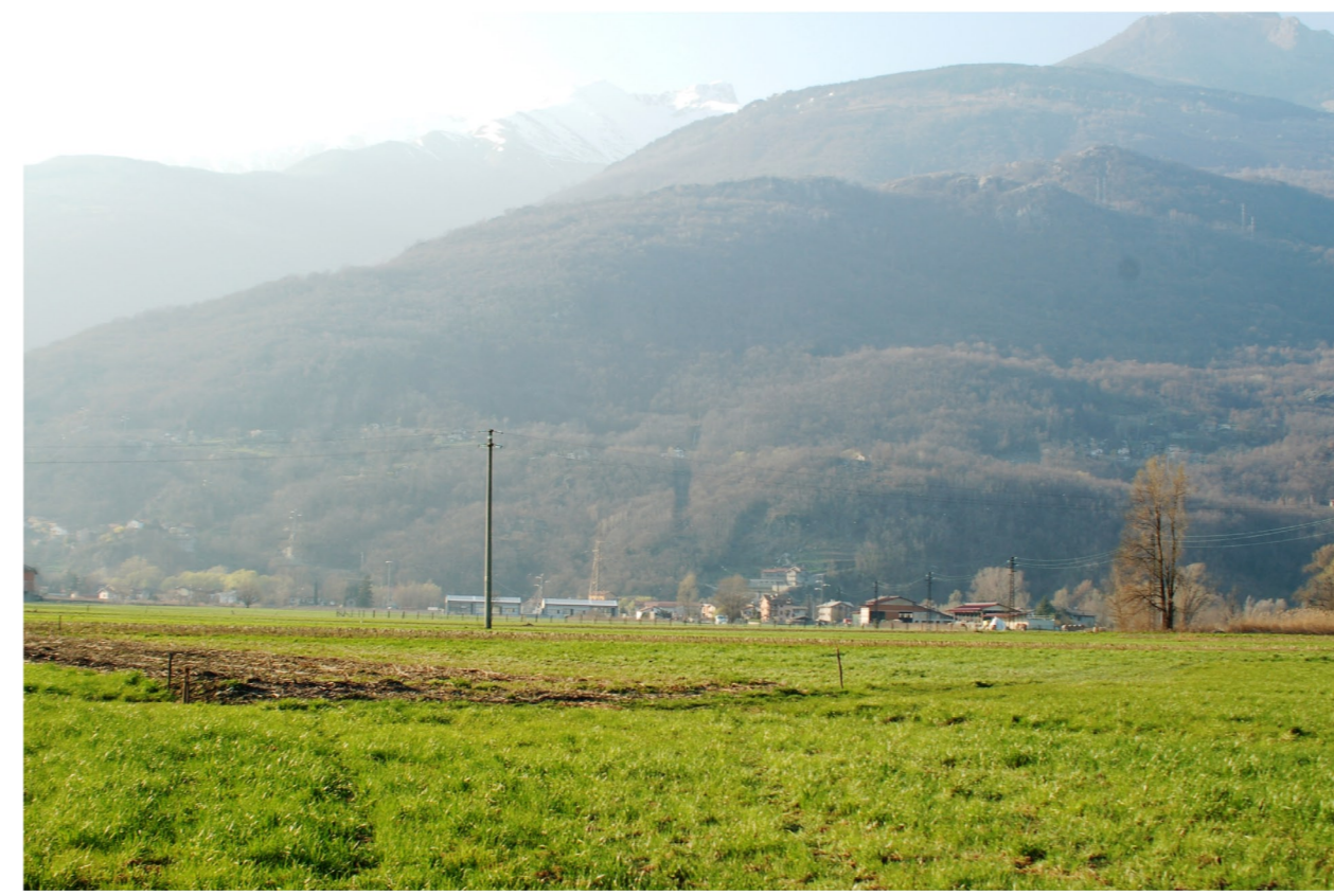
Osservatore posizionato a 1 Km. dal sostegno