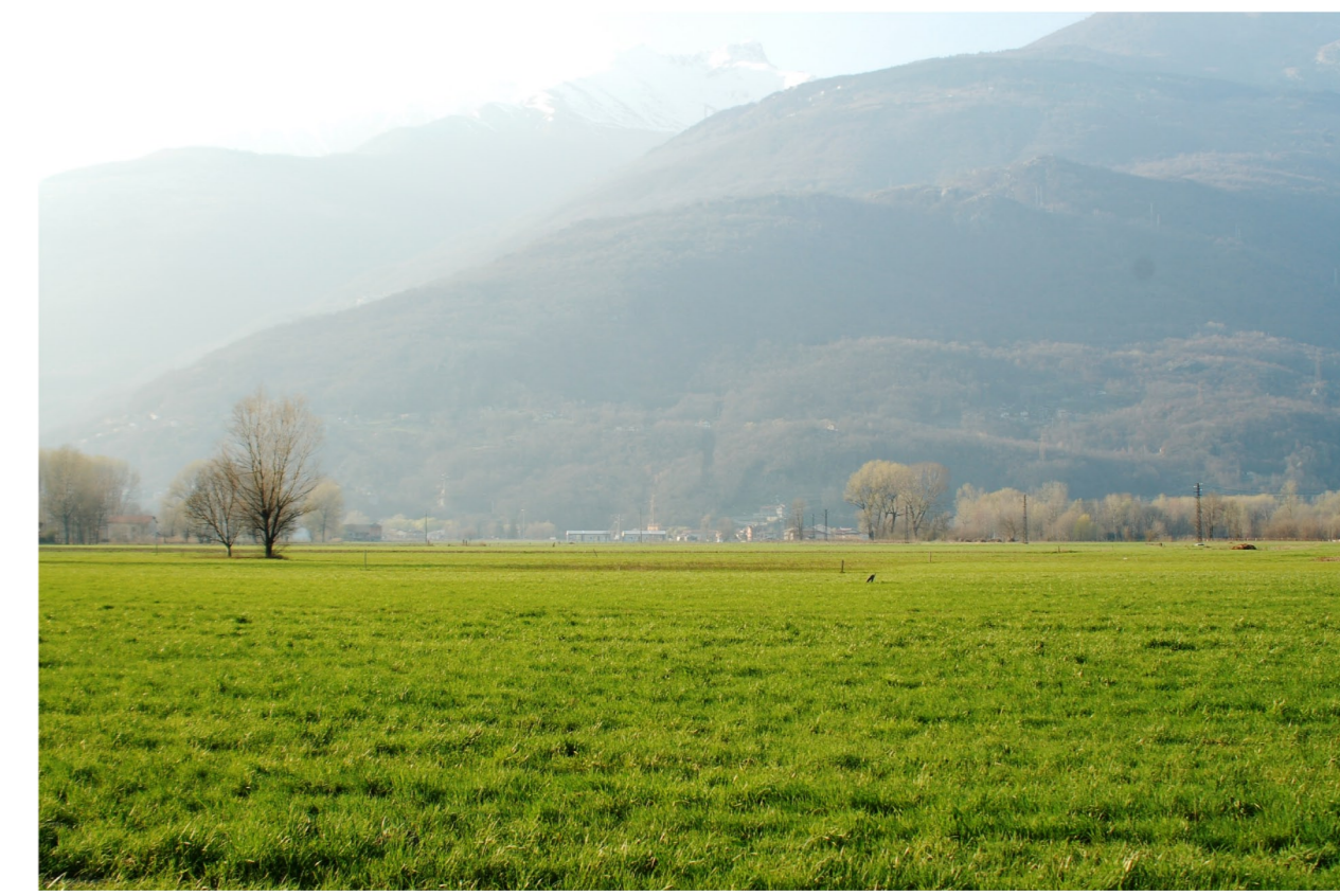
Osservatore posizionato a 1,5 Km. dal sostegno