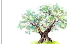
Tavola: EL. 4

Arcada s.r.l. Via Trieste 25, 95138 - Palermo info@arcadaprogetti.it arcadaprogetti@arabepc.it