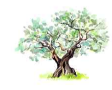
Tavola: CV.6.7 Progettazione:

ARCADIA srls Via Houel 29, 90138 - Palermo info@arcadiaprogetti.it arcadiaprogetti@arubapec.it