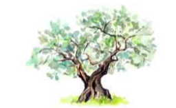
Tavola: CV.3.6 Progettazione:

ARCADIA srl Via Houel 29, 90138 - Palermo info@arcadiaprogetti.it arcadiaprogetti@arubapec.it