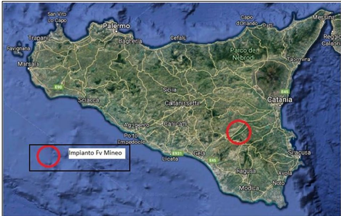
Figura 1 Localizzazione su immagine satellitare

nella provincia di Catania, nelle località “Liotta, Malaricotta, Olivo, Magazzinazzo, Russotto e Ogliastro” .