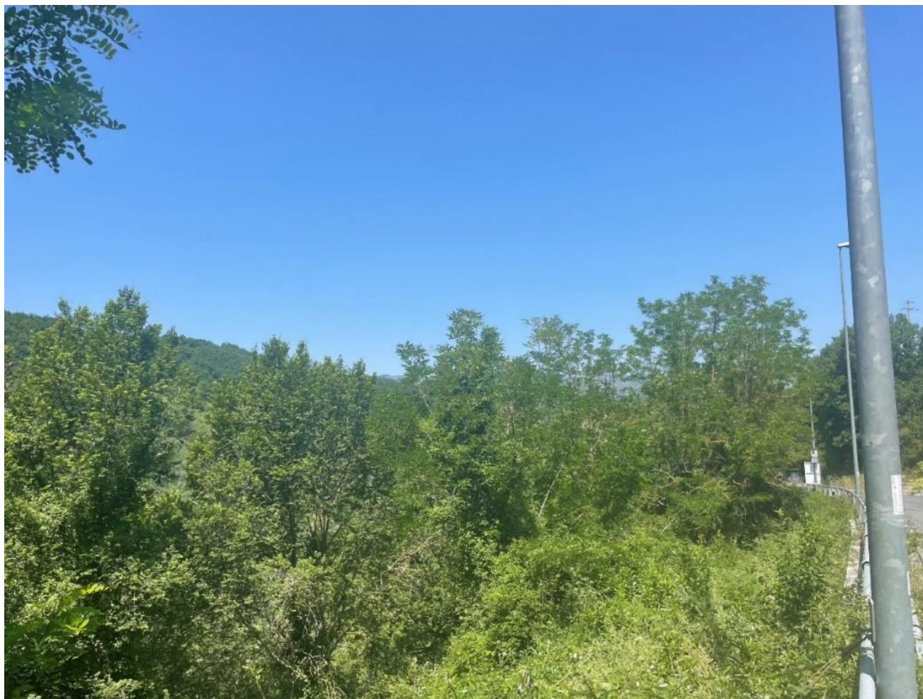
Figura 3 punto 2