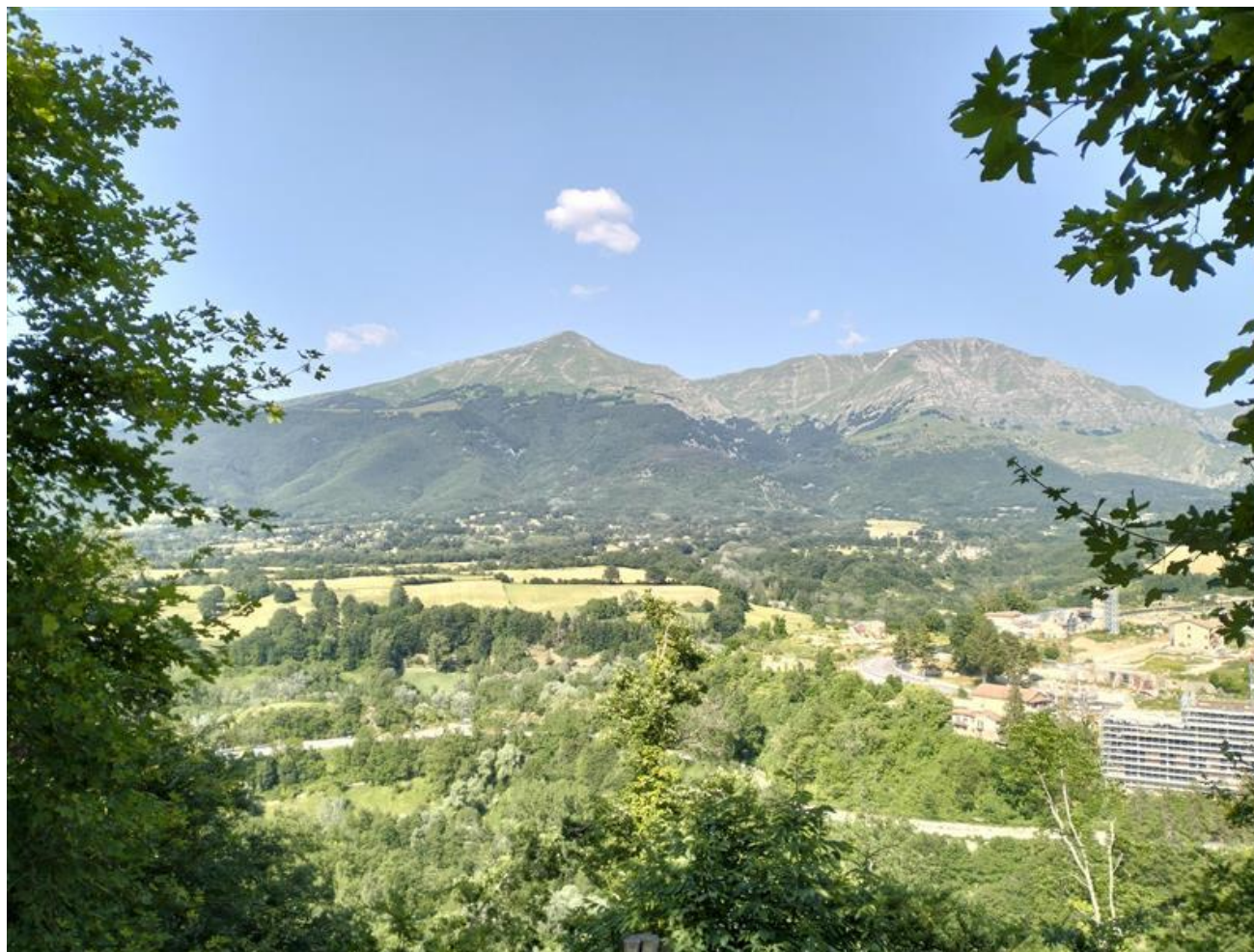
Figura 9 punto 9