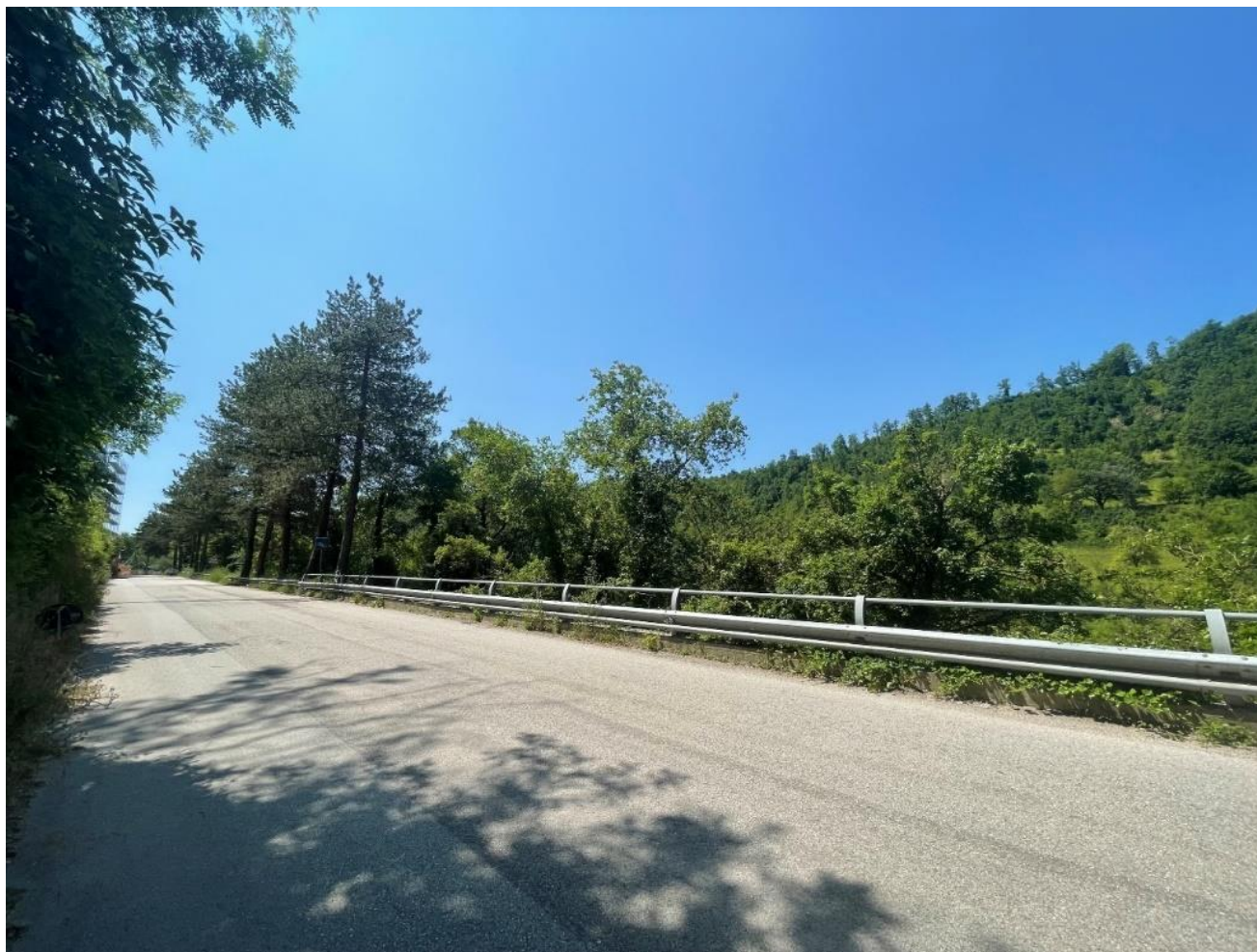
Figura 4 punto 3