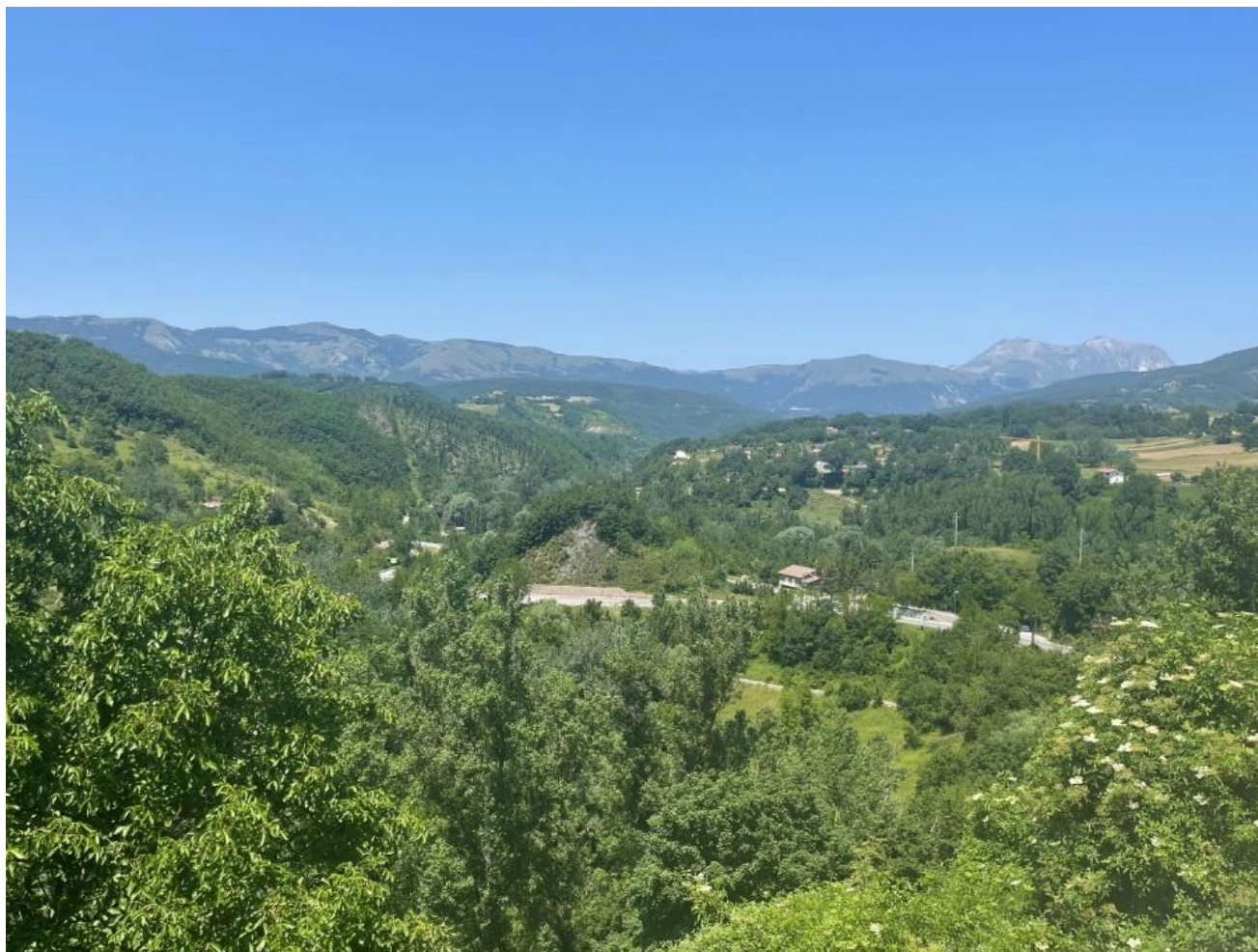
Figura 6 punto 5