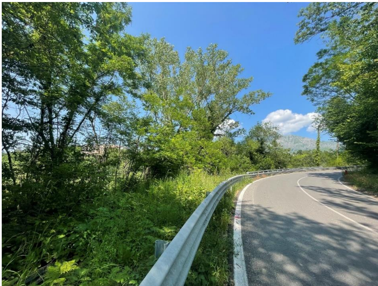
Figura 8 punto 8