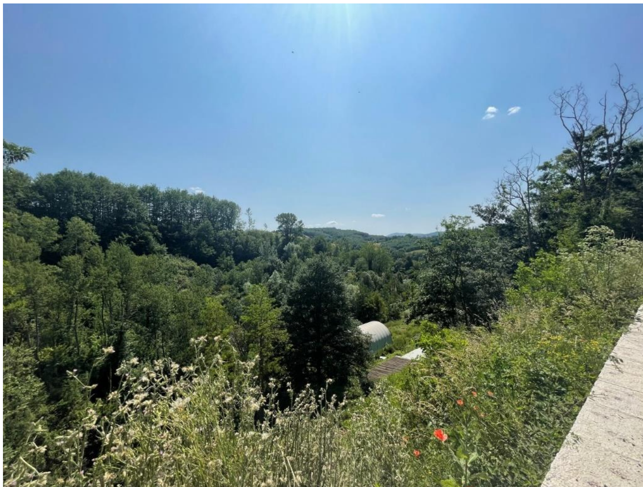
Figura 7 punto 7