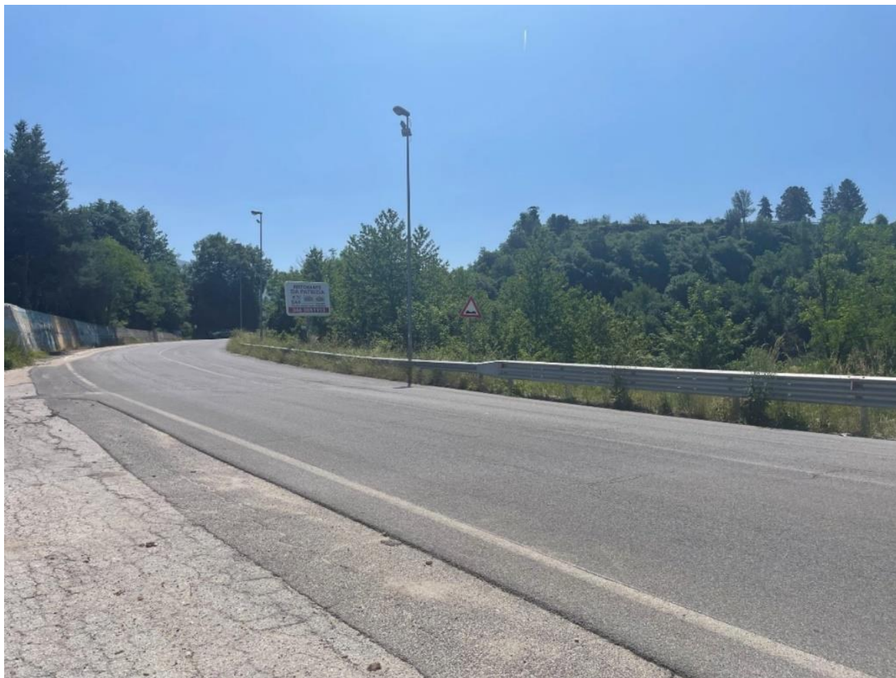
Figura 2 punto 1