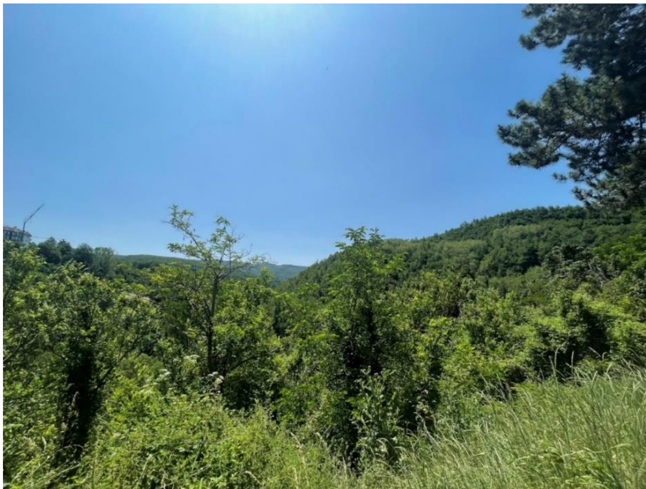
Figura 5 punto 4